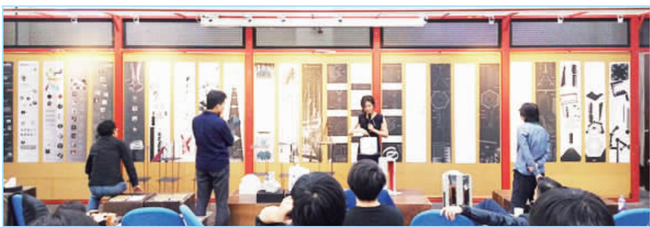
▲階梯教室成為全系的共同記憶場景。

建築設計作為在臺灣的建築學系（趨於五年制）的核心課程，一共會經歷二十多個課題：從小居室的認識，到對中小型建築群的觀察，進而理解大環境的佈局，並且希望在畢業設計時提出自我主張和看法。此間蘊含一套由簡而繁、由居家尺度到都市涵構的類比模擬，其建立起的空間知識，可視為一門對整體時空下的認知與再現藝術。