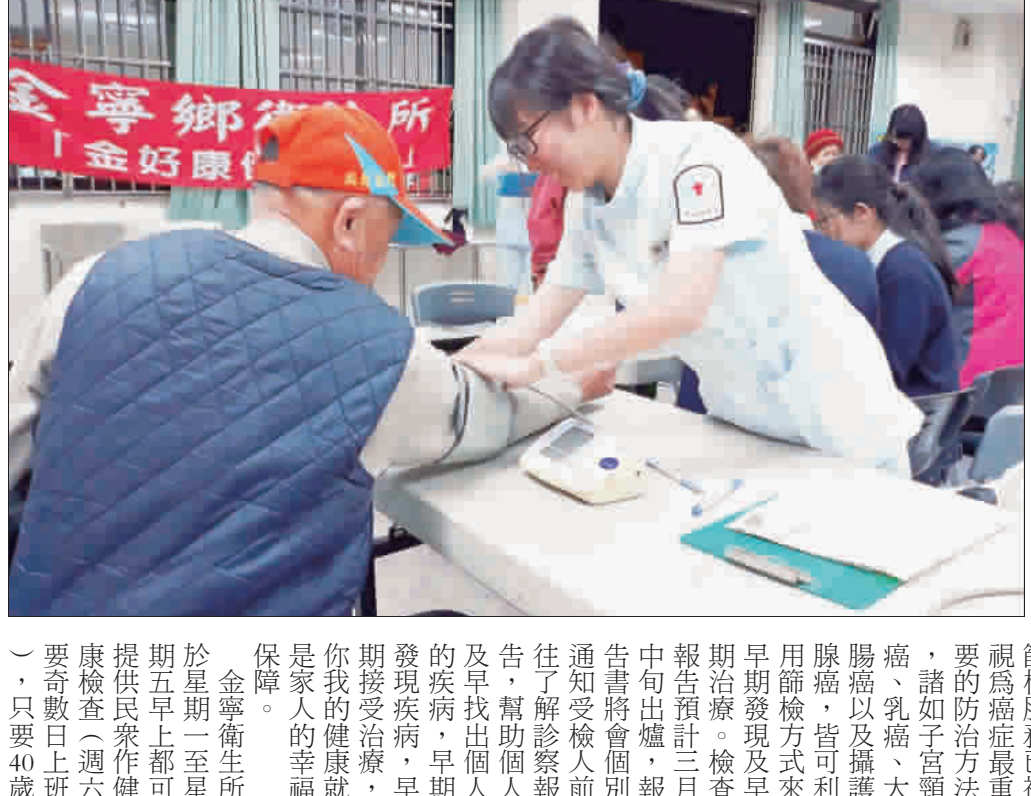
金寧鄉衛生所舉辦金好康健健康檢查，金大護理學系配合實習參與醫療服務。

記者許峻魁／金成報專稿 隨著樂齡年度的結束，金城樂齡學習中心於昨(二十三)日舉行「一〇七年度學期成果」，由金城鎮長李誠智頒發最佳學習精神獎給六十餘名參與者，肯定他們活到老、學到老的終身學習精神；頒獎過後，樂齡中心還規劃了繪畫活動，邀請大家一起在布包上創作，為一〇七年度課程畫上句號。李誠智肯定樂齡中心課程規劃上的用心，也感謝學員積極參與中心的各項課程和活動，並希望不只是可以繼續參加今(一〇八)年度的樂齡中心課程和活動，還可以邀請親朋好友一起來共襄盛舉。 金城樂齡學習中心辦理「一〇七年度學期成果暨繪畫活動」，於昨日上午九時起，在金城鎮公所五樓樂齡中心舉行，由鎮長李誠智親自頒發鼓勵獎，並邀請樂齡學員們一起出席觀禮，互相激勵加油。 而頒獎結束後，隨即展開繪畫的行動，現場學員們在無任何裝飾的手提包上，發揮各自的創意，並利用壓克力顏料來上色，藉由膠帶的黏貼創作形狀後，將顏料暈染在包包上，每件作品顏色繽紛，有人是幾何圖案，有人畫出甚至媲美名牌手提包，相當具有質感，不少學員們滿意的帶著自己的作品合照。 金城樂齡學習中心表示，去(一〇七)一年課程，總共舉辦多達一百九十八場次，學習時數統計達到四百六十七小時。而除了中心自行辦理的活動之外，還有下鄉拓點(拓點社區包含富康一村、金城新莊、古崗、北門、東門、西門、南門、民生、珠山、泗湖、金門城、前