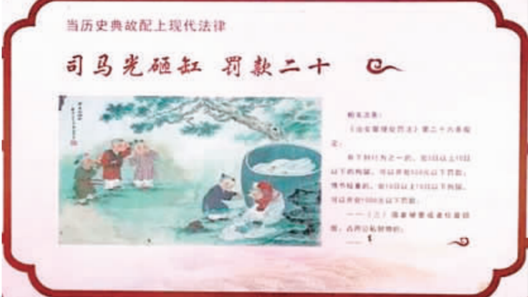
廈門一社區團日前出現一幅普及司法教育宣傳畫，內容是「司馬光砸缸罰款二十元」，見義勇為救人竟要被罰款引發議論；原回應吹毛求疵的廈門思明區司法局22日改稱，社會反響不好，已撤下。

制度，並加強監察執法，依法懲處侵害女職工孕產、產後、哺乳等權利行為。依法懲處侵害女職工孕產、產後、哺乳等權利行為。依法懲處侵害女職工孕產、產後、哺乳等權利行為。依法懲處侵害女職工孕產、產後、哺乳等權利行為。 通報稱，近年來，中國婦女就業情況總體較好，勞動參與率位居世界前列，但婦女就業依然面臨一些困難，尤其是招聘行為歧視現象屢禁不止，對婦女就業帶來不利影響。「通知」的推出，將對進一步保障婦女就業權益、促進婦女就業發揮積極作用。大陸婦女就業，因為婚育問題，長期遭受不公平待遇。不論在國企或民企，許多單位實施結婚、懷孕必須登記排隊的潛規則，女員工因為擔心失業只能配合，敢怒不敢言。 人社部發布後，立刻在網上徵求意見。但成千上萬大陸網民卻一面倒對通知表示不滿。「通知」沒有配套措施，反而讓女性更難就業。 網民多認為，「通知」看似提高女性地位，實際在提高女性用工成本與風險；上有政策，下有對策，老闆們將更不願意雇用女性。 許多網民指出，就算這麼規定，企業還是可以自主選擇用人，哪個性別帶來的利潤空間大、風險小就招誰，政府根本沒辦法監督，「人家不要妳一樣可以不要」，還有網民說，「通知」一下發後，女人更難找工作，「就會乖乖去生育了」。 「通知」這麼多規定，還不如出一條「每個公司女性占比不得低於40%」來得有用。（中央社）