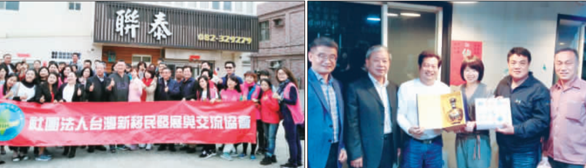
左、立委林麗蟬率團來金交流參訪，縣長楊鎮浚親切歡迎大家到訪並合影；右、縣府社會處處長董榮與金酒鎮長李誠智代表楊鎮浚縣長致贈林麗蟬委員金酒等表歡迎。

記者莊煥寧／綜合報導 立法委員林麗蟬率領台灣新移民發展與交流協會等團體抵金辦理交流參訪活動，縣長楊鎮浚歡迎一行人的到訪，他除了提到縣府會致力於營造友善生活環境，提供多樣觀光行程及充足旅遊，讓來金旅客能有賓至如歸且達到良好的渡假休閒的慢活情趣外，並強調縣府重視新住民的權益與發展，設有專責單位辦理相關業務，希望協助新住民認同在地生活，和諧共融永續發展。 利用28連假假期，林麗蟬立委率領台灣新移民發展與交流協會、台灣會幹部等多人於2月28日至3月1日在本縣辦理「108年度新住民照顧關懷服務參訪交流活動」，縣長楊鎮浚、副縣長李誠智、縣府社會處處長董榮、鄉親科張文文科長、洪學文主任、洪家豪副主任及本縣新住民姐妹代表等人陪同接待參訪並蒞宴該團。 楊鎮浚縣長歡迎及感謝林麗蟬委員率團來金參訪，並向訪賓說明施政理念，並大力行銷本縣觀光產業、金酒。他也表示，縣府會致力於營造友善生活環境，並提供觀光旅遊多樣行程及充足旅遊，讓來金旅客能有賓至如歸的感受，達到良好的渡假休閒的慢活情趣。同時金門縣政府也很重視新住民的權益與發展，統計金門有二十多位新住民，縣府也特別在社會處設鄉親科專責辦理新住民相關業務，希望透過交流觀摩協助新住民認同在地生活，和諧共融永續發展。 林麗蟬委員表示，全國中外聯二代比例逐年增加，婚姻移民及二代比例逐年增加，她及服務團隊積極協助因應婚姻移民家庭所衍生的問題，維持其家庭功能，並達到協助新住民融入台灣生活、連結多方資源，以保障新住民在台權益。也希望藉由此次參訪交流活動，能夠連結資源，了解不同單位之服務方案，提昇專業服務品質。 此次參訪聯誼活動，金門縣政府熱忱的接待，讓與會來賓從陌生到熟絡，大家賓主盡歡，期待再次來金相聚交流，活動順利圓滿成功。