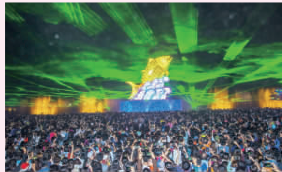
台灣燈會連假首日湧入168萬人潮，創人數新高，破800萬人次。

【中央社記者郭正瑄屏東縣1日電】在屏東東港鎮大鵬灣舉行的台灣燈會，今天連假首日湧入168萬人次，創燈會開幕以來入園人數新高，也讓今年的台灣燈會破800萬人次。 台灣燈會30年來首度在屏東舉辦，因為大鵬灣地形，讓燈會交通成了大考驗，觀光局原先預估今年台灣燈會參觀人數可能沒辦法像在中台及桃園舉辦的台灣燈會般破千萬參觀人次，沒想到燈會試營運就被網友瘋傳，佳評如潮，民眾喻為「史上最完美台灣燈會」，連外埠及參觀過的外國人士都稱讚。 台灣燈會15日試營運，19日開幕，將在3月3日結束，24日是第一個假日，當天入園人數首度破百萬，今天連假首日，縣府在晚上11時宣布，入園人數破167萬，讓在屏東舉辦的台灣燈會突破觀光局預估的800萬人次，來到836萬人次，也是13天來第2次破百萬人次。 【中央社記者郭正瑄屏東縣1日電】在屏東大鵬灣舉行的台灣燈會，昨天168萬入園創燈會新高，今天人潮再爆量，到傍晚進園人數比昨天多，有可能再創開園以來的參觀人數新高。縣府今調整接駁，交通比昨天順暢。 台灣燈會昨天參觀人數破167萬，創開園13天新高，也使被喻為「史上最完美台灣燈會」，參觀人次來到836萬，突破觀光局原先預估的800萬人次。