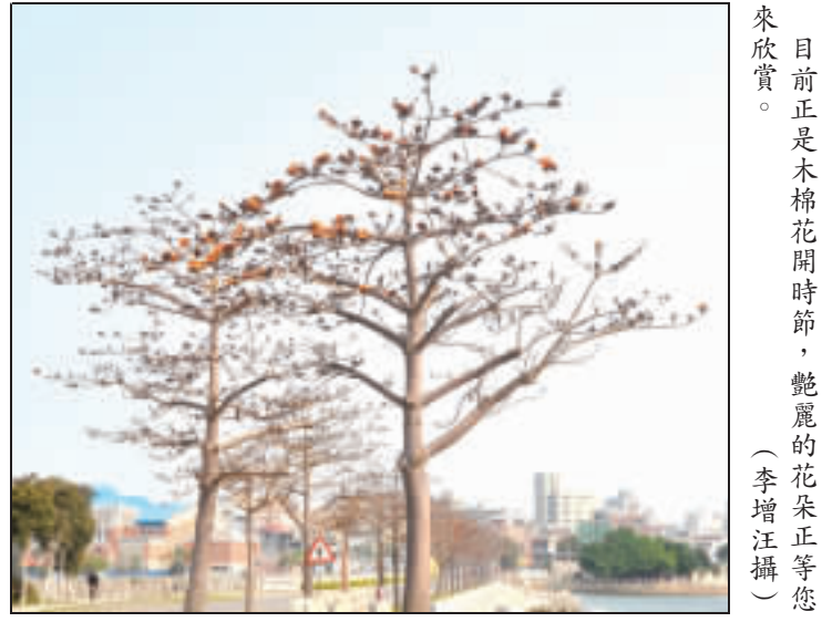
目前正是木棉花開時節，艷麗的花朵正等著您來欣賞。