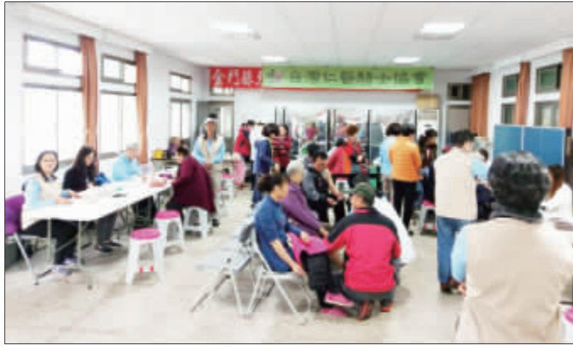
台灣仁醫騎士協會醫師和服務團隊到烈嶼辦理聯合義診活動。

記者許加泰／烈嶼報導 台灣仁醫騎士協會醫師和服務團隊，昨日再度到離島烈嶼東林社社區活動中心進行一天的聯合義診活動，提供中醫診斷治療、中藥、針灸、推拿整復等服務。此次來金的醫師，皆為各醫學會理事長、醫學博士、國醫大師、教授等資深醫師醫資深推拿師到診，病患把握機會求診，向醫師諮詢病痛，透由醫師的把脈、針灸、推拿解痛，治療，減輕身體上的痛苦。