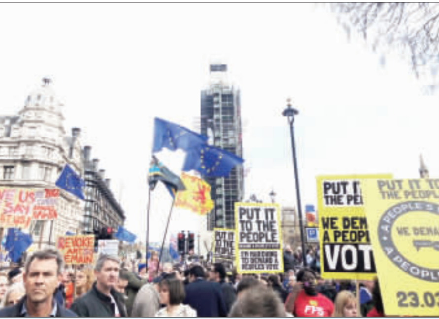
訴求2次脫歐公投 倫敦遊行人數逾百萬 反對退出歐盟的英國民眾23日聚集倫敦市中心遊行，訴求舉行第2次脫歐公投。主辦單位稱參與人數超過100萬，和2003年的反戰遊行並列為英國本世紀最多參與的遊行活動。(中央社)