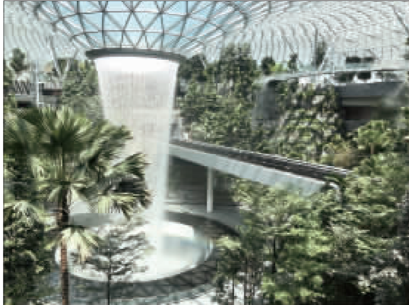
星耀樟宜40公尺高室內瀑布引人注目 「星耀樟宜」4月17日開幕，其中，最引人注目的莫過於從高約40公尺傾瀉而下的室內瀑布。(中央社)

現狀停滯不前，決定因應全球航空業激烈競爭，樟宜機場從2014年底興建「星耀樟宜」(Level 3) 耗資新幣17億元，為樟宜機場注入更多活水頭，提升國際競爭力。 「星耀樟宜」耗資新幣17億元(約新台幣38億元)打造，金額之高令外界咋舌。「星耀樟宜」坐落樟宜機場最核心位置，約有55萬平方公尺，大樓地面與地下各5層樓，兼具現代多功能時尚生活中心。 林信任指出，「星耀樟宜」4