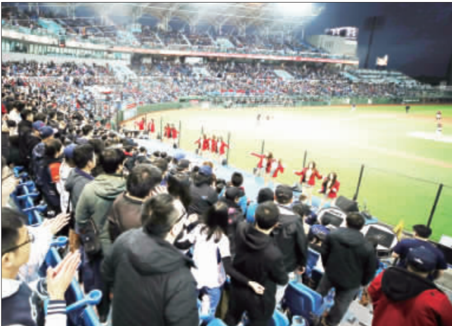
中職30年首戰 破萬球迷進場 中職30年球季首戰吸引1萬3591人到桃園棒球場觀賽，連9年開幕戰破萬人，終場桃猿以6比2擊敗統一獅隊，拿下聯盟開幕戰2連勝。(中央社)