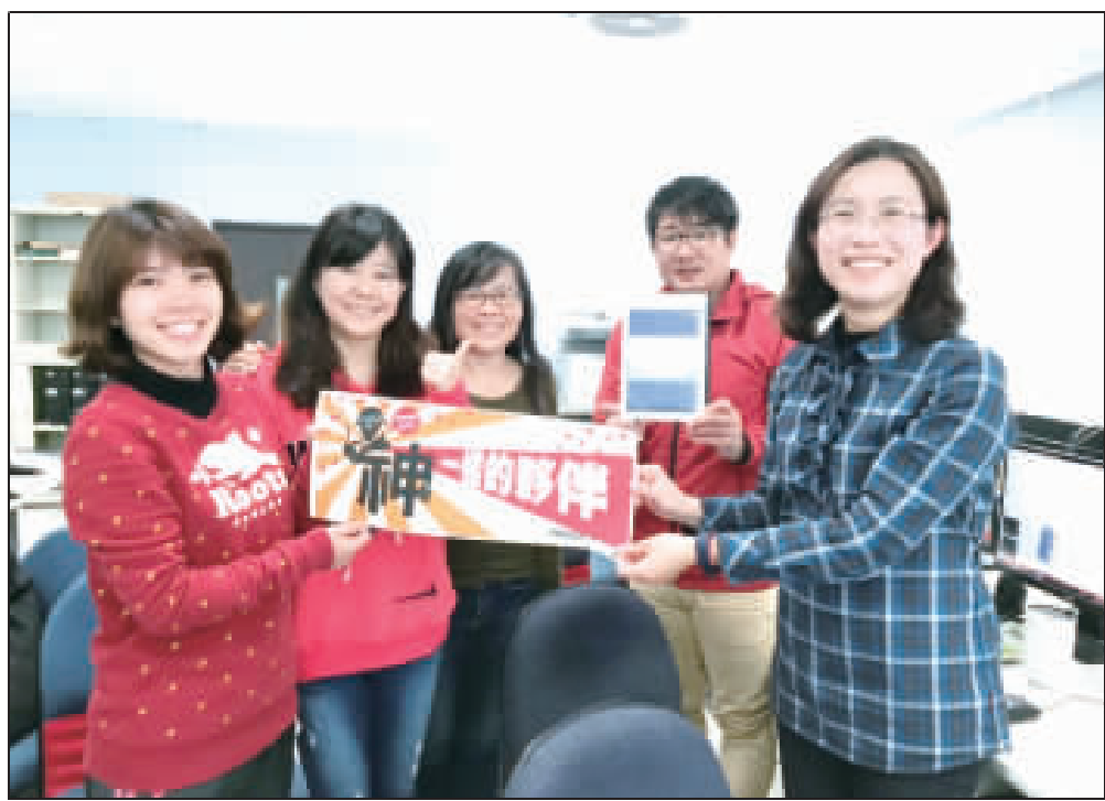
何浦國小推行動學習，國立台北教育大學資訊系教授劉遠楨蒞校帶領師生認識行動學習的重要性及精神，接續將由老師結合課程，讓學生運用3D產品挑戰閱讀。

學習不會只有一種可能！何浦國小第一學年推動行動學習，昨日邀請台灣行動學習的計劃主持人（國立台北教育大學資訊系教授）劉遠楨到場分享，帶領師生認識行動學習及其精神，而經過這次變學生學習的固定模式，希望透過研究將老師與學生創新學習開關，接續將運用數位科技作為輔助，尤其，現今遊戲內容新奇多，老師將把各領域能夠應用的內容，設計在遊戲中，以有趣的評量方式，讓孩子在操作中共同討論學習過程的內容，加深學習印象和