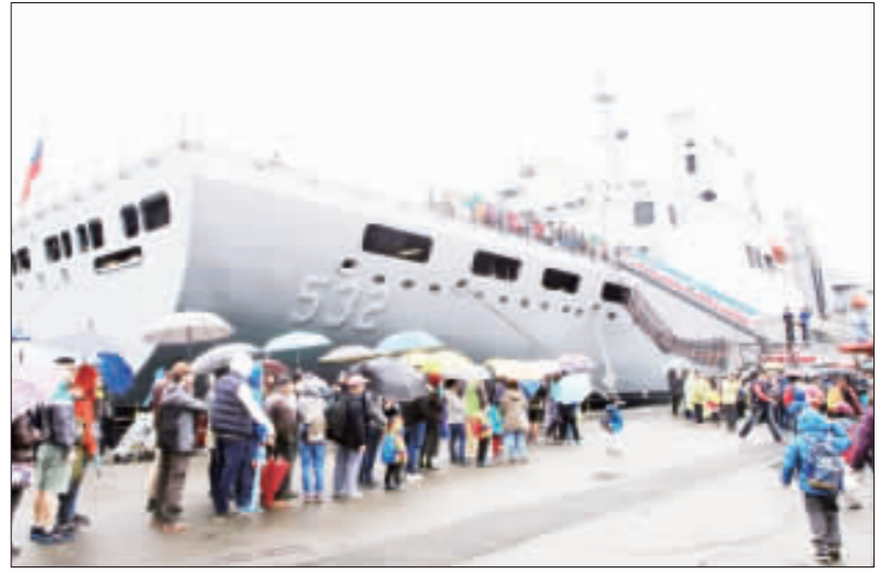
敦睦艦隊停靠基隆港 參觀人潮大排長龍 海軍敦睦遠航訓練支隊24日起一連兩天，在基隆港東五碼頭開放民眾登艦參觀，吸引大批民眾冒著細雨前往排隊登艦。

【中央社記者溫貴香馬尼拉24日電】總統蔡英文結束「海洋民主之旅」第一站馬尼拉訪問，今天啟程訪問諾魯，將與諾魯總統瓦卡舉行雙邊會談並將在國會發表演說與見證兩國簽署海巡協定。 蔡總統上午與馬尼拉總統雷蒙索及傳統領袖舉行早餐會後，將搭乘專機前往諾魯，因時差諾魯當地時間快4小時，約在諾魯當地時間晚間7時抵達，下榻當地美侖飯店。 蔡總統訪問諾魯期間，也將與諾魯國會議長布爾曼、參議院議長、參議院、慰勉台中央民總醫院「骨科醫療義診團」、參加駐諾魯技術團「台灣農畜教育中心」開幕典禮、參觀西港灣Boe Declaration紀念碑與見證中華民國(台灣)政府與諾魯共和國政府海巡協定等。 紀念碑設於2018年太平洋洋島國論壇活動期間，為見證由澳大利亞、紐西蘭及出席的太平洋國家共同簽署的宣言而設立，宣言內容強調氣候變化對太平洋國家人民的最大威脅，重申推動執行巴黎協定的承諾，也是首次將應對氣候變化的威脅納入安全聲明。 26日蔡總統將啟程前往馬紹爾群島出席「太平洋婦女領袖聯盟會議」並與隨團記者茶敘，27日專機離開馬紹爾群島共和國，將過境美國夏威夷；蔡總統過境夏威夷將發表演說，美國智庫傳統基金會將同步視訊，美國聯邦參議院外委會亞太小組主席賈德納、聯邦眾議員約霍將出席與談，28日返抵國門。