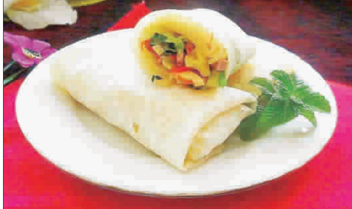
金門文化園區31日下午辦理《清明節講古、體驗包金門七餅、緬懷蔡復一先賢》系列活動。(文化園區提供)

金門文化園區歷史民俗博物館也指出，關於「金門七餅」的由來，民間盛傳與金門明代先賢蔡復一抗倭有關。明代蔡復一曾高居「五省總督、七省經略」之官職，因為當為公務廢寢忘食。蔡夫人很貼心，體諒蔡復一，不忍其推餓，故靈機一動，想到將各種食材切細煮熟，再以餅皮包裹，如此就可手持一邊忙公事一邊取吃。據說，百姓們讚美蔡夫人的賢慧與聰慧，因此也有「妻餅」之稱。不過，這項傳統風俗雖然仍在金門流傳，但許多金門人和孩子卻可能不知道，故特別辦理此項活動，邀請親友到文化園區聽古及體驗金門包七餅的文化意義，並藉以緬懷先賢蔡復一，歡迎鄉親踴躍報名參加。(文化園區提供)