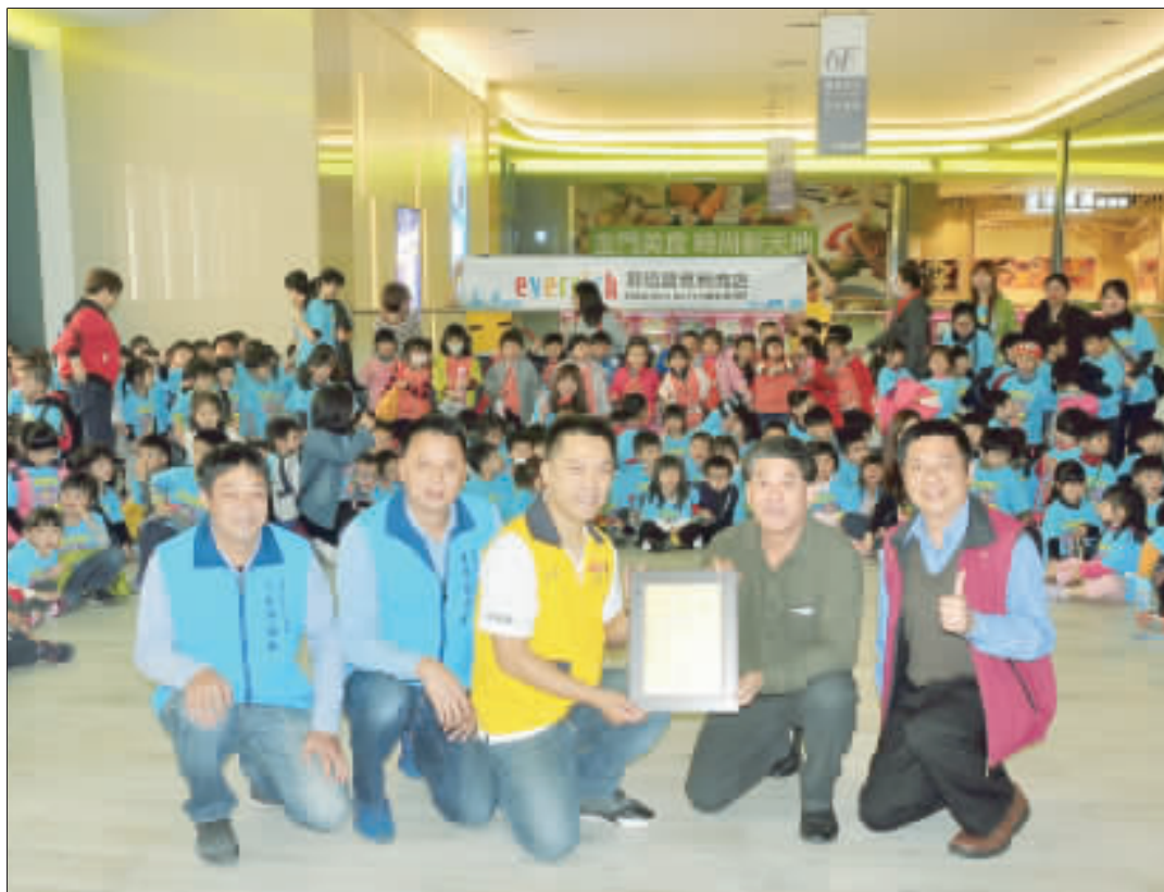
金湖鎮公所與昇恆昌公司昨日請金湖學區的小朋友看電影。