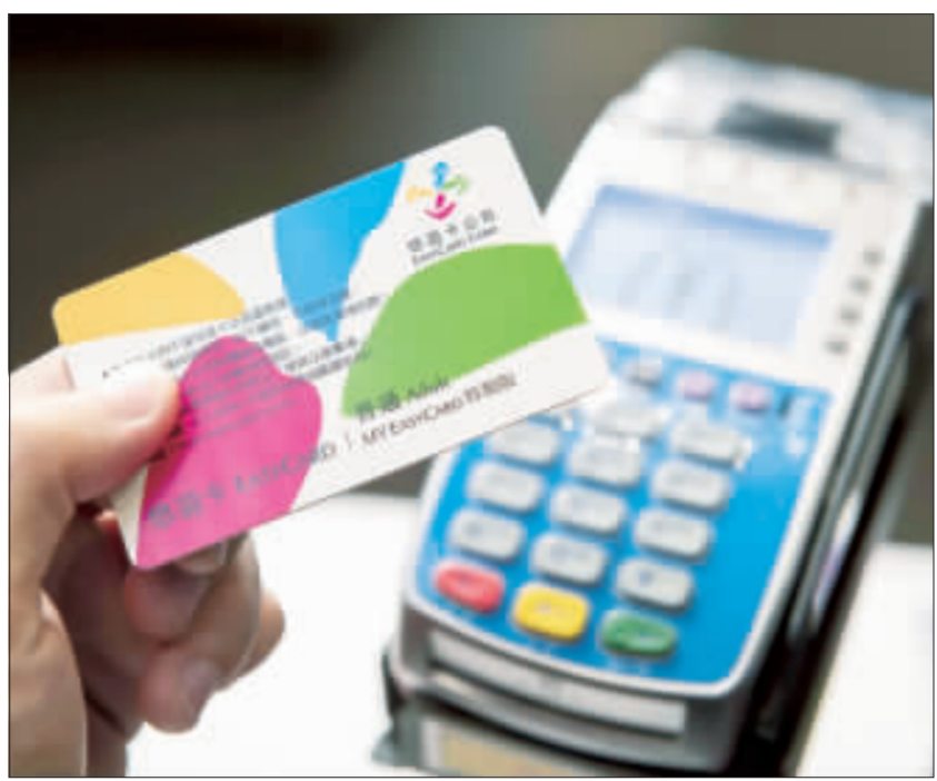
攜手悠遊卡公司 4大票證可在麥當勞感應付費

金管會提醒民眾，購買利變型保單時，應注意三大面向：首先，保險公司應具備信譽，其次，保險契約應清楚，最後，消費者應了解保險商品內容，審慎評估自身需求。 金管會表示，消費者在購買利變型保單前，應注意三大面向：首先，保險公司應具備信譽，其次，保險契約應清楚，最後，消費者應了解保險商品內容，審慎評估自身需求。