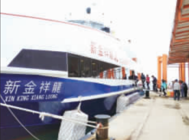
清明連假假期，因應遊客眾多，航港局將加強小三通連假防疫安檢。

記者許峻峻／綜合報導 一〇八年清明節連假假期從今天開始起，連假四天的假期，交通部航港局表示，將加強小三通航線防疫安檢，並與防檢局相關單位共同強化非洲豬瘟的防疫安檢。