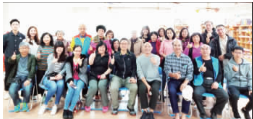
瓊林宴商業經營模式座談會中，公部門、居民、學界等集思廣益，思考社區發展未來。（主辦單位提供）

瓊林宴商業經營模式座談會中，公部門、居民、學界等集思廣益，思考社區發展未來。主辦單位提供。 瓊林宴商業經營模式座談會中，公部門、居民、學界等集思廣益，思考社區發展未來。主辦單位提供。