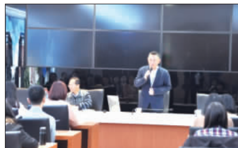
縣長楊鎮浩昨日上午接見縣府暨所屬機關107年高普考暨地方特考錄取新進人員並進行座談。

記者李增汪／綜合報導 縣長楊鎮浩昨日上午接見縣府暨所屬機關107年高普考暨地方特考錄取新進人員，強調打進考選行政環境，讓不管是來自台灣或本地鄉親考上公職的新進人員，今後一起共事，並能發揮個人專長和才能，在工作崗位上盡本份，一起努力來為金門鄉親服務。