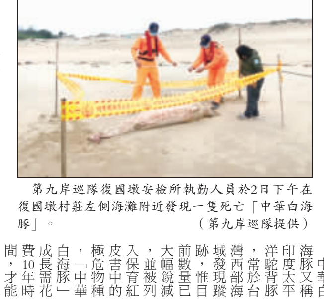
第九岸巡隊復國墩安檢所執勤人員於2日下午16時在復國墩村莊左側海邊發現一隻死亡「中華白海豚」。

記者陳冠霖／綜合報導 第九岸巡隊復國墩安檢所執勤人員於2日下午16時左右，在復國墩村莊左側海邊發現一隻死亡鯨豚屍體，經初步檢驗，死因不明。