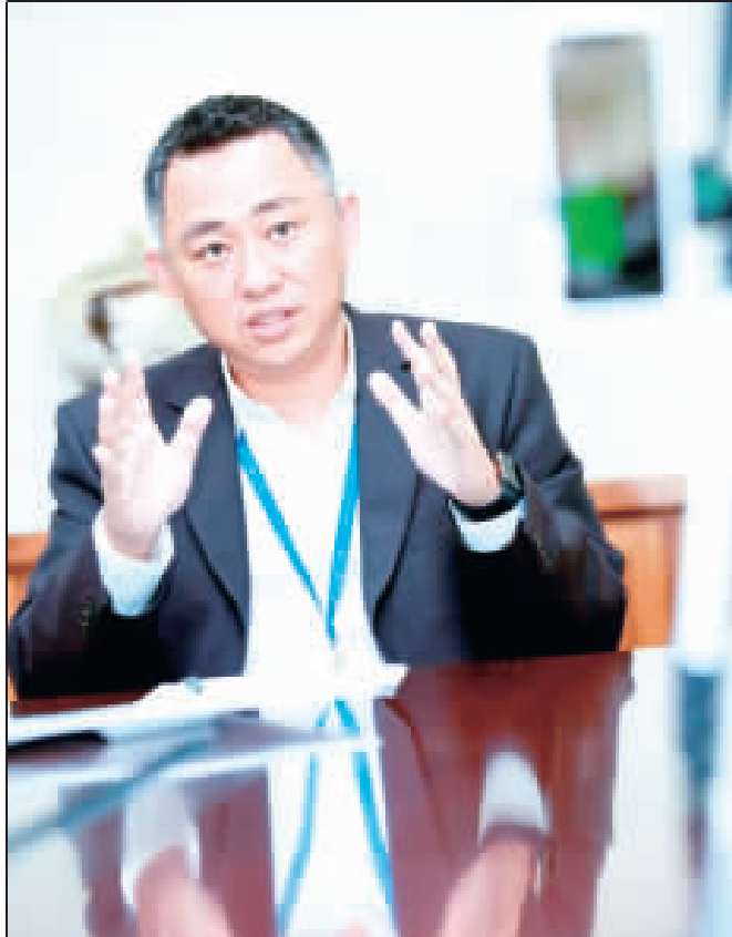
上、金門縣長楊鎮浚昨透過網路直播與民眾暢談百日縣政；下、接受媒體訪問。

網友辛辣提問 坦誠面對鄉親 記者楊水詠／縣府報導 金門縣長楊鎮浚昨天就職一百天，特別透過網路直播的方式，與民眾暢談百日縣政。在全長約一小時的直播問答過程中，不少鄉親辛辣提問，包括55歲勸勉金與金酒重慶任用等鄉親關注問題，縣長楊鎮浚都一一說明，期解除鄉親心中的疑慮和問題。 在選總統長所提出的「找回價值、開創新局」政見口號，縣長楊鎮浚說，「找回價值」就是找回金門固有的價值，「開創新局」就是讓金門有新的發展機會。上任三個月，他表示一直做內部盤整、重建財政紀律、人事方案盤整、環境永續態度，以及跟對岸談如何攜手合作，若基礎未做好，縣政發展是不會永續的，所以希望打造一個永續的環境。 楊鎮浚說，他選擇政治工作，受鄉親囑託承擔縣政及參與金門發展方向及決策，但政治人物來去無常，打造一個不受外界干擾、沒有選舉考量的行政團隊，才是讓金門永續發展的關鍵。而且，他來自企業界，希望把企業精神導入政府裡面，建立嚴正的財務態度，做該做的事，一毛錢都不會省，對地區好的加大力度都沒有問題，不該花的絕對不花。 針對受到熱議的55歲至64歲勸勉金議題，楊鎮浚表示，這項措施的確造成財政負擔，有人說停止、有人說要改發放方式或是訂定落日，都是討論過程，縣府做民調只是回應民意，並非以讓社會理解不同聲音和立場；但在政策形成過程中，有心人士的操作成爲要砍掉年金，是一件遺憾的事，但他也強調，比較相對單薄，要努力推的主要有兩項： 另外在農特產品銷往大陸，楊鎮浚表示，講了十年來的牛肉輸往大陸，基本上已突破，大陸也核可金門牛肉進去，目前在做內部的出口程序，很快就會有這項好消息。 他進一步指出，金門的產業結構比較相對單薄，要努力推的主要有兩項：