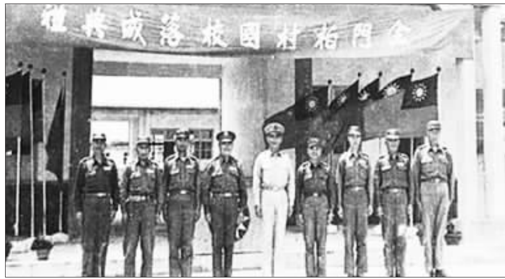
上、左：民國47年柏村國校落成典禮；下、郝柏村（中）今年3月時在郝龍斌（左）的陪同下，拜訪柏村國小。

記者陳冠霖／金湖報導 民國48年落成啟用的柏村國小，至今年屆滿建校60週年，將於4月26日舉辦「柏村一甲子，春風榮耀」擴大慶祝活動，系列活動包括校友及資深教職員工、推崇三代同堂校友、校友親子足球運動會及幼兒園表演、校友親子足球運動會及慶祝慶餐會等，屆時前台北市長郝龍斌也將代表年邁的父親郝柏村出席校慶，一同見證柏村的一甲子歲月。 柏村國小表示，「柏村一甲子，春風榮耀」是柏村國小建校60週年擴大慶祝的主題，時間訂於4月26日上午隆重舉行，校方會同校友會、家長會、並會特別致函邀請當年建校郝柏村將軍家族蒞臨校慶。 柏村國小呼籲歷屆校友、學生家長、校區鄉親們攜眷相挺，出錢出力，共同參與，要把這一次盛大的校慶辦得熱熱鬧鬧，除了讓校友們迴眸母校相見歡