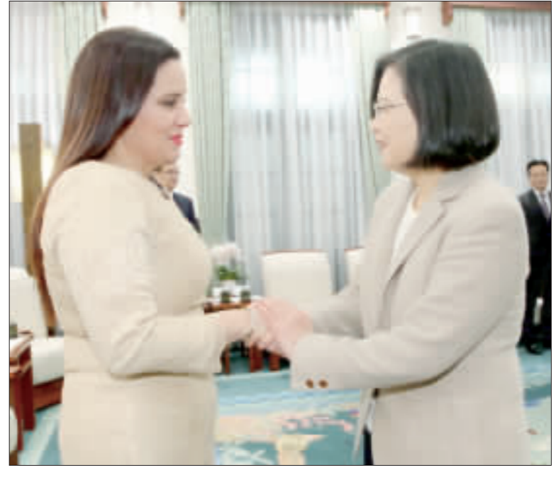
總統蔡英文(右)接見宏都拉斯共和國第一夫人葉安娜(Ana Garcia de Hernandez)(左)。

【中央社記者溫貴香台北3日電】總統蔡英文今天接見宏都拉斯第一夫人葉安娜(Ana Garcia de Hernandez)(左)及第一夫人葉安娜(Ana Garcia de Hernandez)(右)。 總統蔡英文今天接見宏都拉斯第一夫人葉安娜(Ana Garcia de Hernandez)(左)及第一夫人葉安娜(Ana Garcia de Hernandez)(右)。 總統蔡英文今天接見宏都拉斯第一夫人葉安娜(Ana Garcia de Hernandez)(左)及第一夫人葉安娜(Ana Garcia de Hernandez)(右)。