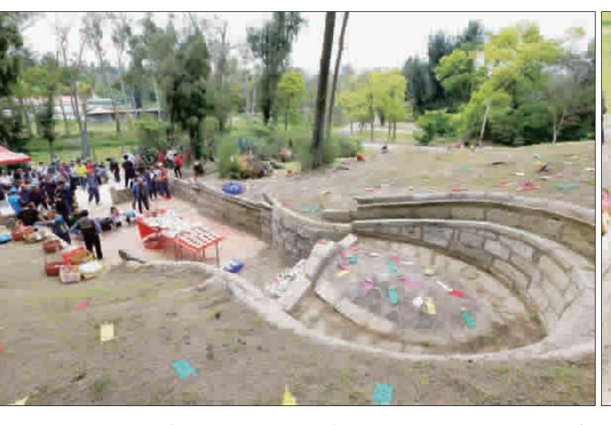
左、右：瓊林蔡氏宗親親往於每年4月4日前往金防部營區內掃墓祭祖。

書暨評估單、接種卡等，讓家長及學生詳閱相關資訊，再評估學生健康狀況後，學生及家長可在同意書上簽名同意，才可進行接種。