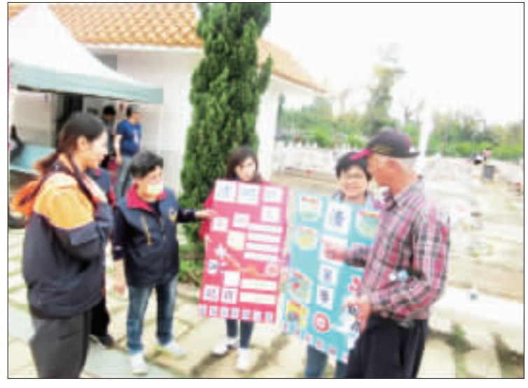
金寧消防分隊於清明節掃墓期間結合義消、婦女防火宣導隊展開防火宣導。

記者陳冠霖／金湖報導 清明連續假期，各鄉鎮地區勢必湧入大批掃墓祭祖人潮，有鑑於以往掃墓期間山林火災層出不窮，金寧消防分隊特於清明節掃墓期間結合義消、婦女防火宣導隊對轄區內易發生雜草火警之地點加強防火巡邏及搶救訓練，並推展各機關、校園、賣場、商店實施清明防火宣導，推廣消防常識，提醒民眾遵行「四不二記得」掃墓防火注意事項，以防範火災發生。 鑑於民眾掃墓祭祖時易因燃燒冥紙、墓園周邊雜草造成空氣污染，並因濃煙瀰漫道路兩旁，影響行車視線造成交通事故，甚至不慎波及周邊農作物、建築物造成嚴重危害。金寧消防分隊宣講時特別提醒民眾，掃墓祭祖時切記「四不二記得」：「不」亂燒雜草、「不」亂丟煙蒂、「不」讓冥紙飛揚、「不」燃放爆竹、「不」亂丟將垃圾帶走、「記得」將餘燼撲滅。並建議民眾可自備水桶、瓶裝水、水袋、鏟子等，於火勢初期即可先行撲滅，以避免擴大延燒釀成災害。而往年經常可見有民眾