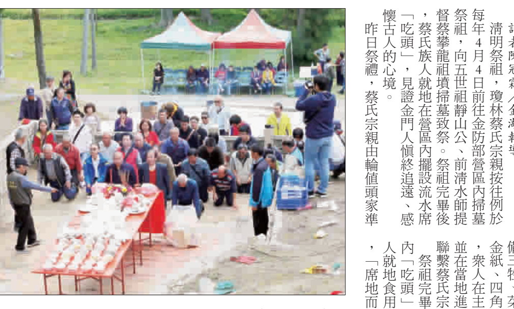
清明節前夕，佛光山金蓮淨苑授例舉辦清明法會，透過金剛寶懺的唱誦和拈香禮拜，祈佑世人能同登法苑。(翁維智攝)

社團法人金門縣金寧鄉盤山下堡翁氏二房宗親會昨日於宗祠舉行「清明祭祖」大典，並頒發優秀子弟獎學金。(翁維智攝)