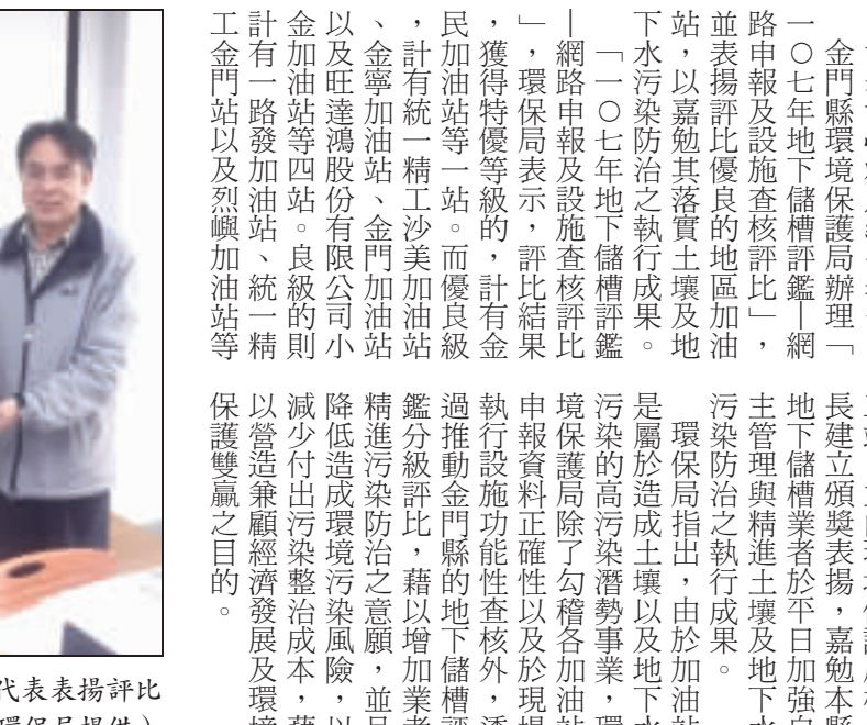
環保局由局長楊建立（右）代表表揚評比優良的地區加油站業者。

記者許峻魁／綜合報導 金門縣環境保護局辦理「一〇七年度地下儲槽評鑑」網路申報及設施查核評比，並表揚評比優良的地區加油站，以嘉勉其落實土壤及地下水污染防治之執行成果。 「一〇七年度地下儲槽評鑑」網路申報及設施查核評比，獲得特優等級的，計有金寧加油站等四站。而優良級計有統一精工沙美加油站、金寧加油站、金門加油站以及旺達鴻股份有限公司金寧加油站等四站。良好的評比，減少付出不必要成本，藉以營造兼顧經濟發展及環境保護雙贏之目的。 三站，並由環境保護局局長楊建立頒發表揚，嘉勉本縣地下儲槽業者於平日加強土壤管理與精進土壤及地下水污染防治之執行成果。 環保局指出，由於加油站是屬於造成土壤及地下水污染的高污染潛事業，環境保護局除了勾稽各加油站申報資料正確性以及於現場執行設施功能性查核外，透過推動金門縣的地下儲槽評鑑分級評比，藉以增加業者精進污染防治之意願，並且降低造成環境污染風險，以減少付出不必要成本，藉以營造兼顧經濟發展及環境保護雙贏之目的。