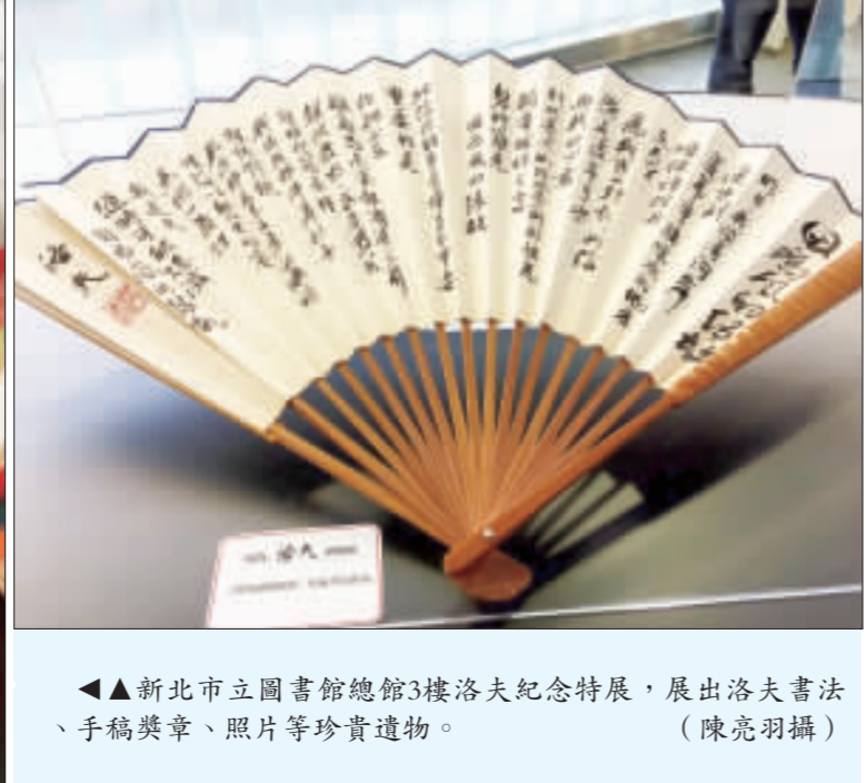
▲▲ 台北市立圖書館總館3樓洛夫紀念特展，展出洛夫書法、手稿獎章、照片等珍貴遺物。