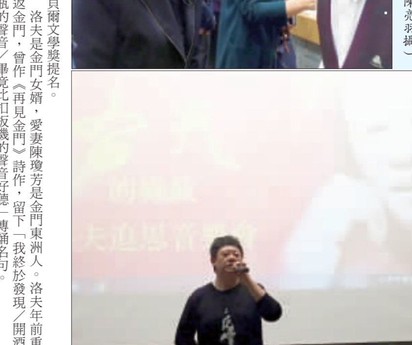
▲▲ 台北市立圖書館總館3樓洛夫紀念特展，展出洛夫書法、手稿獎章、照片等珍貴遺物。