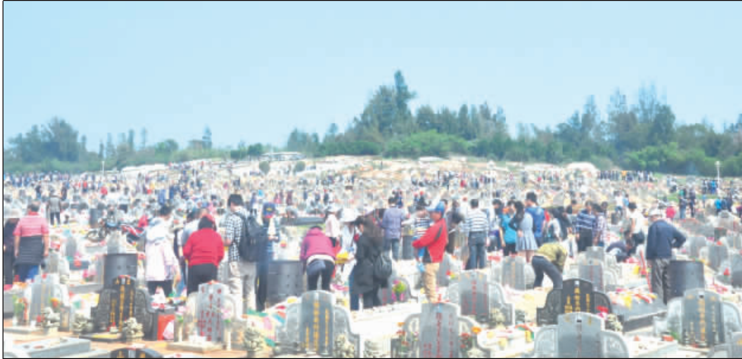
昨日是清明節，各公墓處處可見掃墓人潮，虔誠在先人墳前祭拜。

鳳胎的哥哥「涇優」和姊姊「涇綠」快上許多。 根據台北市立動物園保育員觀察，「金沙」在兩次懷孕的後期，就開始挑挑細細選適合的材料，每天很努力地往回巢箱內做窩，然後這一次當媽媽就面臨「打二」的艱鉅挑戰，也戰戰兢兢地一邊摸索一邊學習，總算將龍鳳胎「涇優」和「涇綠」順利扶養長大；而這次「金沙」只要專心照顧一隻小寶寶就好，加上第二次當媽媽已具備足夠的經驗和技巧，這回在育幼時，「金沙」就顯得駕輕就熟許多。 歐亞水獺的育幼方式和爪哇水獺完全不同，公水獺(「小金」)並不會協助育幼，所以自上一胎開始，「金沙」在生產後都是獨自哺育幼仔的。幸好「金沙」的母性很強，即使是第一次當媽媽就面臨「打二」的艱鉅挑戰，也戰戰兢兢地一邊摸索一邊學習，總算將龍鳳胎「涇優」和「涇綠」順利扶養長大；而這次「金沙」只要專心照顧一隻小寶寶就好，加上第二次當媽媽已具備足夠的經驗和技巧，這回在育幼時，「金沙」就顯得駕輕就熟許多。