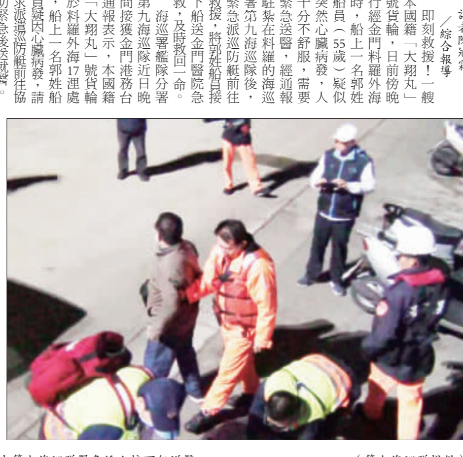
左、右：一艘本國籍貨輪船上一名郭姓船員(戴口罩者)疑似突然心臟病發，由第九海巡隊緊急派人接下船送醫。