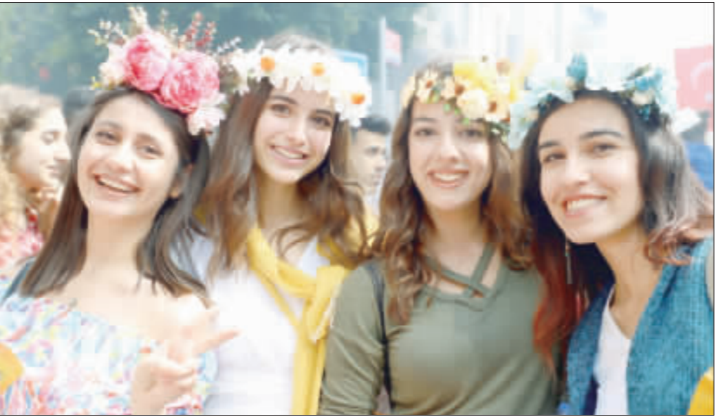
土耳其阿達那全城狂歡 橙花嘉年華 土耳其阿達那全城狂歡，6日以色列其南部阿達那「國際橙花嘉年華會」據說是土耳其唯一街頭狂歡活動，6日以色列繽紛彩旗遊行進入最高潮。圖為參加活動的女孩。

【中央社耶路撒冷6日電】以色列9日將投票決定是否要延長總理尼坦雅胡(Benjamin Netanyahu)任期，儘管他貪污醜聞纏身，還遭到前軍方首長的強力挑戰，尼坦雅胡長期保護以色列安全與經濟成長，擔任總理已逾13年，民調顯示，他可以再次輕鬆獲勝。 如果尼坦雅胡勝選，就將超越以色列國父班古里昂(David Ben-Gurion)，成為以色列在位最久的總理。 尼坦雅胡今天在選前最後對右翼選民喊話，如果勝選，將合併約旦河西岸以色列占領的屯墾區。 部分民調顯示，聯合黨贏得的席次可能不及甘茨的藍白聯盟(Blu and White)，但仍可以和其他右翼政黨結盟，組成執政聯盟。