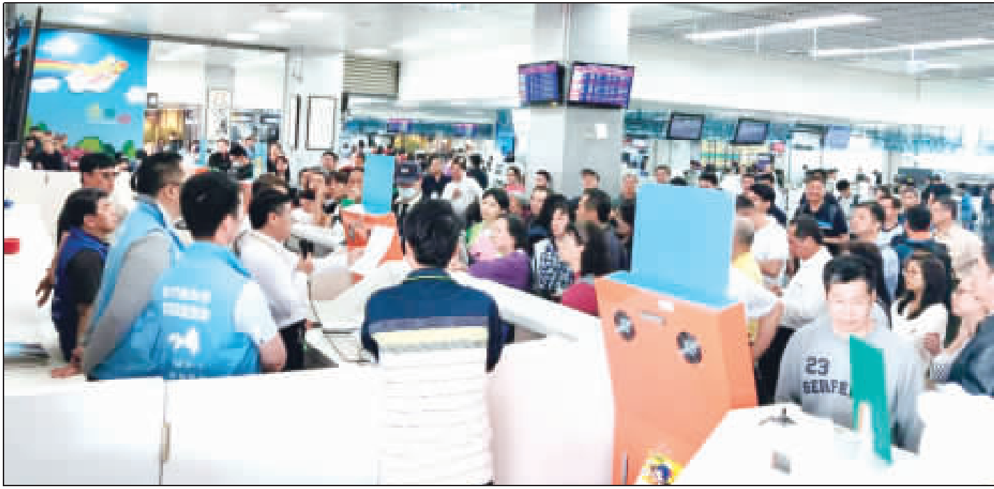
縣府團協同立委陳玉珍團協調爭取增開加班機與軍機，航站人員進行候補唱名。

搭乘專船來金旅遊，受到旅台鄉親的肯定與歡迎。縣府表示，每年春節、清明或端午的重要節日子，縣府台金包船部分，特別感謝台灣的金門同鄉會協助和幫忙，使旅台鄉親能搭乘包船返鄉，提供空中交通的另一選擇，而且清明包船海象良好，鄉親搭船頗為舒適和安全。