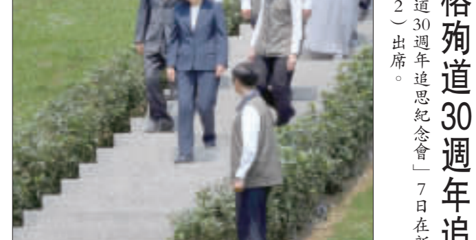
「鄭南榕殉道30週年追思會」7日在台北市鄭南榕自由之翼紀念墓園舉行，總統蔡英文(左二)出席。(中央社)

【中央社台北7日電】總統蔡英文7日出席在台北市鄭南榕自由之翼紀念墓園舉行的「鄭南榕殉道30週年追思會」。總統在會中致詞，追思鄭南榕為民主自由奮鬥的精神，並勉勵國人繼續為民主自由努力。