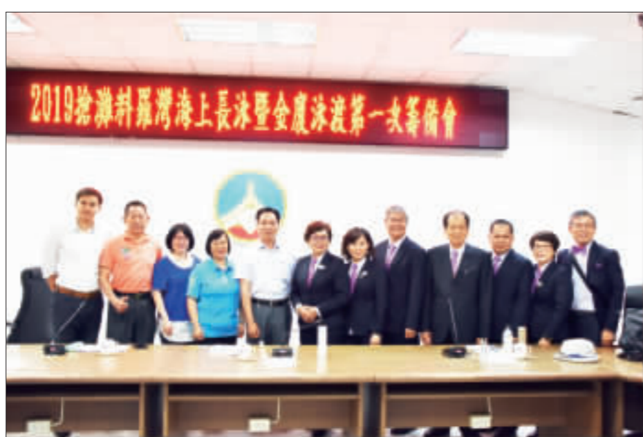
2019搶灘料羅灣海上長泳暨金廈泳渡召開籌備會，力求今年活動圓滿順利。

記者詹宗翰／金湖報導 為推動社區總體營造，鼓勵地區立案之社區發展協會踴躍參與，金門縣文化局辦理「108年金門縣社區營造點徵選補助計畫」，自即日起受理申請，類別共五類，歡迎於金門縣發展協會報名參加，補助經費每案以最高十五萬元為限。 文化局表示，今年金門縣社區營造點徵選補助計畫申請類別包括：「社區村落文化（含六大項）」、「擴大民間參與」、「文化友善據點」、「社區體驗/小旅行」及其他，鼓勵社區透過影像紀錄、刊物出版、人才培訓、社區特色工藝開發、傳統藝術保存與發展、戲劇、音樂、舞蹈