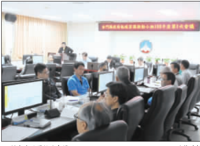
縣府昨召開低碳會議。

「金門縣低碳家園推動小組」一〇八年度第一次委員會議於昨日下午二時起，在金門縣政府第一會議室召開，由縣長楊鎮浚親自主持，縣府各一級、二級單位均派員出席，另金門國家公園管理處、台灣電力公司也派員出席，共同參與與金門低碳島的建置。 楊鎮浚表示，金門是行政院核定的低碳示範島，過去幾年中，在中央協助與地方努力之下，地區也有些成效，低碳永續是金門長期永續的目標。 會中討論了「金門縣低碳家園推動小組」一〇八年度第一次委員會議的討論過程。楊鎮浚表示，金門是行政院核定的低碳示範島，過去幾年中，在中央協助與地方努力之下，地區也有些成效，低碳永續是金門長期永續的目標。