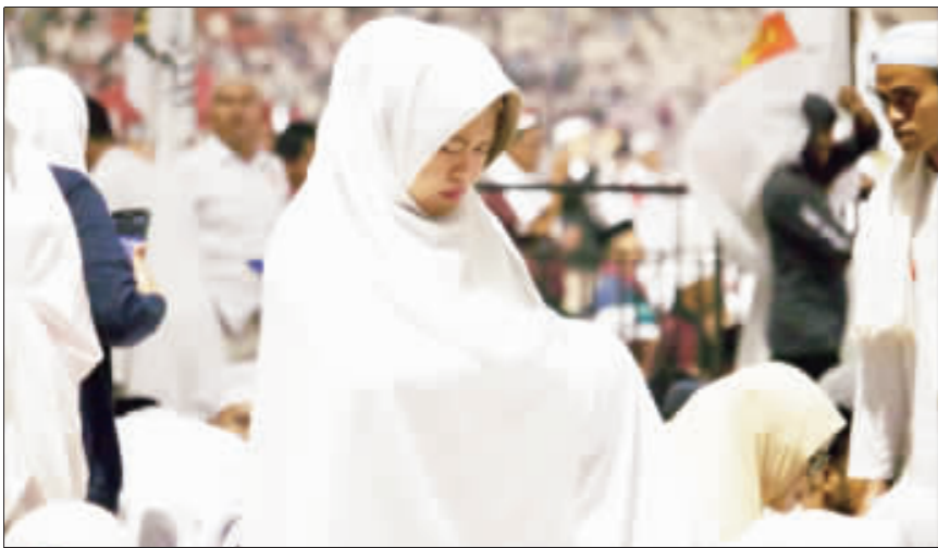
印尼反對陣營總統候選人普拉伯沃舉行大型集會，印尼國家體育館擠滿穿著嚴守伊斯蘭教規服裝的民眾。

【中央社記者石秀娟雅加達10日電】印尼大選倒數，反對陣營總統候選人普拉伯沃動員穆斯林，高舉伊斯蘭大旗。尋求連任的總統佐科威也打宗教牌，拉攏保守派穆斯林。外界憂心「認同政治」會加深社會分裂。