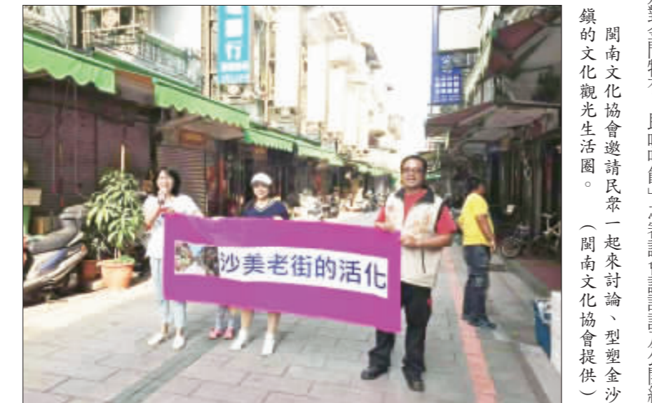
閩南文化協會邀請民眾一起來討論、型塑金沙鎮的文化觀光生活圈。

金門縣閩南文化協會表示，論壇將以「型塑金沙在地文化觀光生活圈」為主題，邀請專家學者、民間團體、社區發展協會等共同參與，探討金沙地區文化底蘊、生活圈發展、觀光生活圈型塑等議題。論壇將於7月12日開始至7月14日活動期間，能夠諸事圓滿順利。 活動籌備會請各單位合作，從活動場地整理、賽道障礙物清理、C/C、選手交通食宿、醫護……等事項，規畫並投入人力辦理，務求自7月12日開始至7月14日的活動期間，能夠諸事圓滿順利。