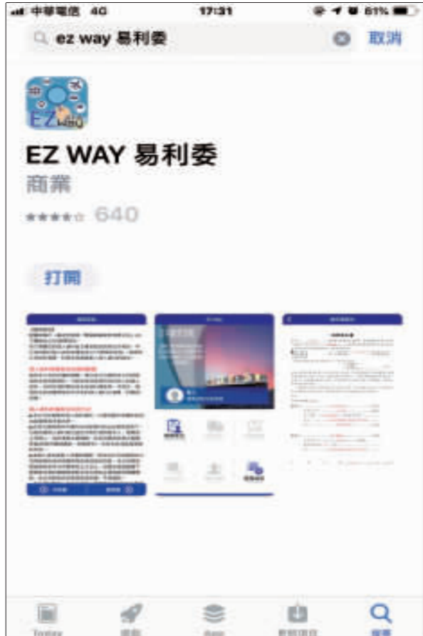
EZ WAY 易利委 App 截圖，顯示了該App的登錄頁面，包括「EZ WAY 易利委 商業」標題、電話號碼「540」以及「打開」按鈕。下方有「EZ WAY 易利委」的App圖示。