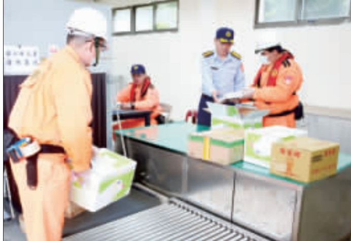
上、後豐執檢站對進港漁船實施檢查及在後豐海域模擬發現不明動物屍體進行蒐檢情形；下、料羅商港安檢所針對運往台灣物資包裹進行安檢及拆封檢查情形。