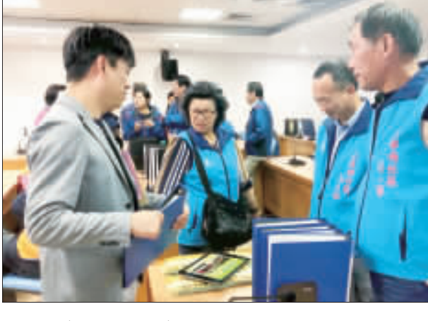
金寧祥和和計畫志願服務團隊評鑑中，評審委員給予志願服務團隊建議與鼓勵。(古寧志願服務提供)

記者李金鎗／金寧報導 為落實「志願服務法」及鼓勵社會福利和計畫運用單位推展志願服務工作，金門縣政府社會處於三月底假金門縣社會福利計畫第一會議室舉辦「金門縣社會福利志願服務團隊評鑑」，經評審團評定優良志願服務團隊名單出爐，獲獎團隊將配合國際志工日慶祝大會中公開表揚。 為使各志願服務團隊的志願服務工作，能更進一步，由社會處委辦，金門縣社會福利志願服務團隊評鑑，經評審團評定優良志願服務團隊名單出爐，獲獎團隊將配合國際志工日慶祝大會中公開表揚。 金門祥和和計畫志願服務團隊評鑑中，評審委員給予志願服務團隊建議與鼓勵。(古寧志願服務提供) 分項項(15分)進行逐項解說與討論，以期團隊均能理解每個評鑑指標之意義，以及如何呈現與整與佐證之資料。 由此次參與評鑑之單位所呈現之服務事項，充分展現出社會福利志願服務團隊(以人為尊)的服務精神，除了依志願服務對象的多元與創新性服務，發揮志願服務最大能量外，更從受服務對象的角度規劃志願服務內容，使服務更具專業與效能。特別感謝委員的鼎力相助，給予金門縣社會福利志願服務團隊許多實質的建議與鼓勵。 也由衷感謝所有志願服務單位，在服務的過程中，秉持助人精神，堅定信念，與所有志願服務團隊攜手並進。 金門祥和和計畫志願服務團隊評鑑成績結果：(一)績優志願服務團隊：第一名：山外社區綜合福利服務隊。第二名：青岐社區志願服務隊。第三名：古寧頭社區志願服務隊。第四名：金山東店社區發展協會志願服務隊。第五名：料羅商港社區志願服務隊。第六名：湖里社區綜合福利服務隊。第七名：金寧鄉社區志願服務隊。