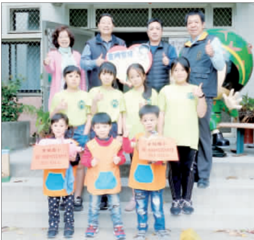
古城國小師生將兒童節園遊會所得盈餘捐給家扶中心，希望家扶中心扶幼館的興建能早日達成。