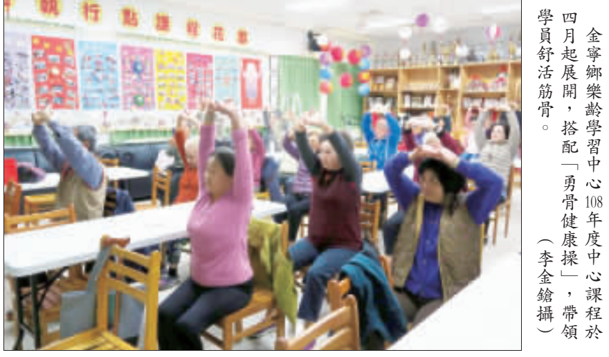
金寧樂齡學習中心108年度中心課程於四月起展開，搭配「勇骨健康操」，帶領學員舒活筋骨。(李金鎗攝)