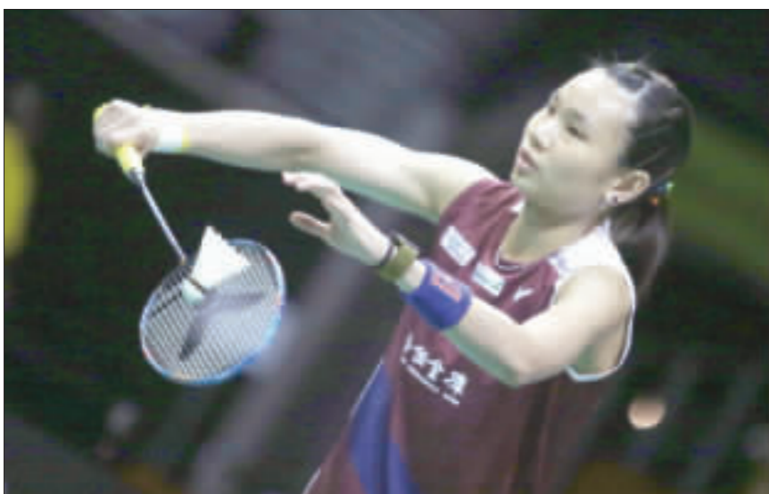
世界球后戴資穎14日在新加坡羽球公開賽女單決賽中，擊敗日本好手奧原希望奪冠。

【中央社記者黃自強新加坡14日電】世界羽球公開賽女單決賽中，戴資穎以2比1擊敗日本好手奧原希望，奪得冠軍。這是戴資穎在2017年、2018年、2019年、2020年、2021年、2022年連續第6次奪冠，也是她生涯第4座馬來西亞公開賽冠軍。戴資穎在比賽中展現了強大的實力，最終以21比19、21比15擊敗了奧原希望。