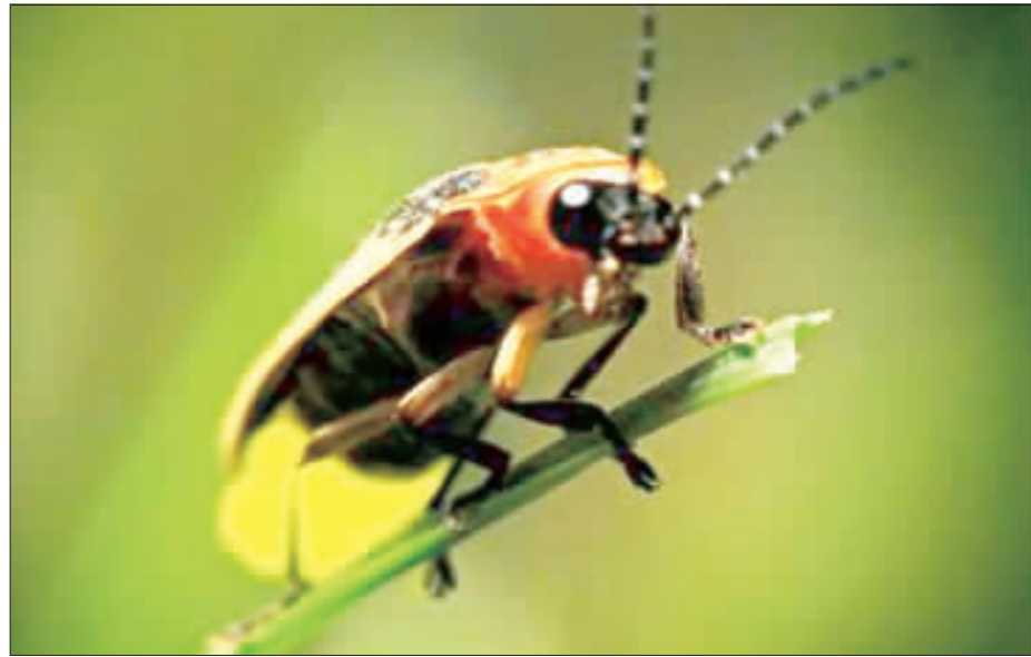
台北市許多公園都有螢火蟲復育棲地，像大安森林公園、木柵公園、榮星花園公園等處皆可賞螢。

戴資穎在比賽中展現了強大的實力，最終以21比19、21比15擊敗了奧原希望。戴資穎在比賽中展現了強大的實力，最終以21比19、21比15擊敗了奧原希望。戴資穎在比賽中展現了強大的實力，最終以21比19、21比15擊敗了奧原希望。