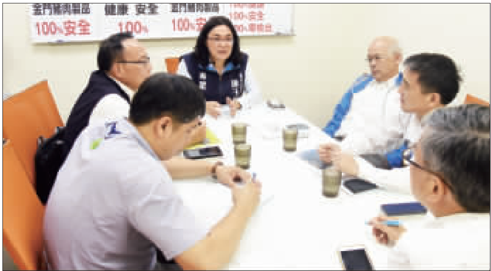
立委陳玉珍為確保金門縣相關產業發展，同時重視非洲豬瘟防疫，昨於立法院召集農委會動植物防疫檢疫局及金門縣政府建設處與動物防疫所相關人員會商。

受中國大陸爆發非洲豬瘟影響，金門縣自去年8月起頻頻發現海漂豬，類且已經檢出4件海漂豬具有非洲豬瘟病毒核酸反應性，立委陳玉珍為確保金門縣相關產業發展，同時重視非洲豬瘟防疫，昨(17)日下午特別於立法院召集農委會動植物防疫檢疫局及金門縣政府建設處與動物防疫所相關人員會商，以不違背法令規章，以下同時顧及防範來勢洶洶的非洲豬瘟疫情，達成促進金門的豬肉產品得到消費者的信心並且順利銷售共識。 根據非洲豬瘟中災區應變中心表示，中央應變中心表示，金門縣4月7日及8日發現的非非洲豬瘟病毒核酸反應之境外漂流豬肉，周邊半徑3公里內豬場檢驗結果，非洲豬瘟均為陰性，防檢局將於今日(18)日凌晨零時解除豬肉產品之管制。