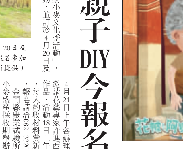
4月20日上午10時在金獅影城舉行《花帽阿獺2》全國首映會。

【記者李增江/綜合報導】《花帽阿獺2》由前總統馬英九夫人周美青首次擔綱片中的兩隻主角「小金」及「小美」的聲優演出，榮獲2018年信誼兒童動畫獎「首獎」殊榮，並將於4月20日上午10時在金獅影城舉行《花帽阿獺2》全國首映會，再為金獅水鄉添聲。