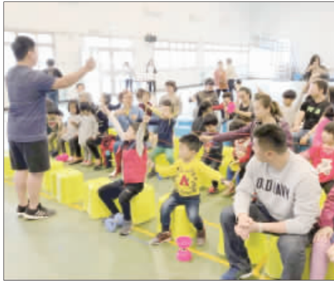
上、下：金鼎國小辦理一項幼兒園親子扯鈴活動，老師指導學童扯鈴基本動作。