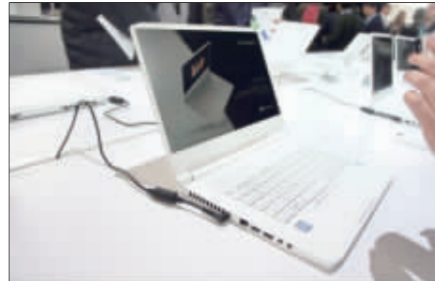
電腦品牌廠宏碁在紐約舉行全球發表會，推出新品牌ConceptD系列筆電，目標族群為設計師等專業用戶。(中央社)