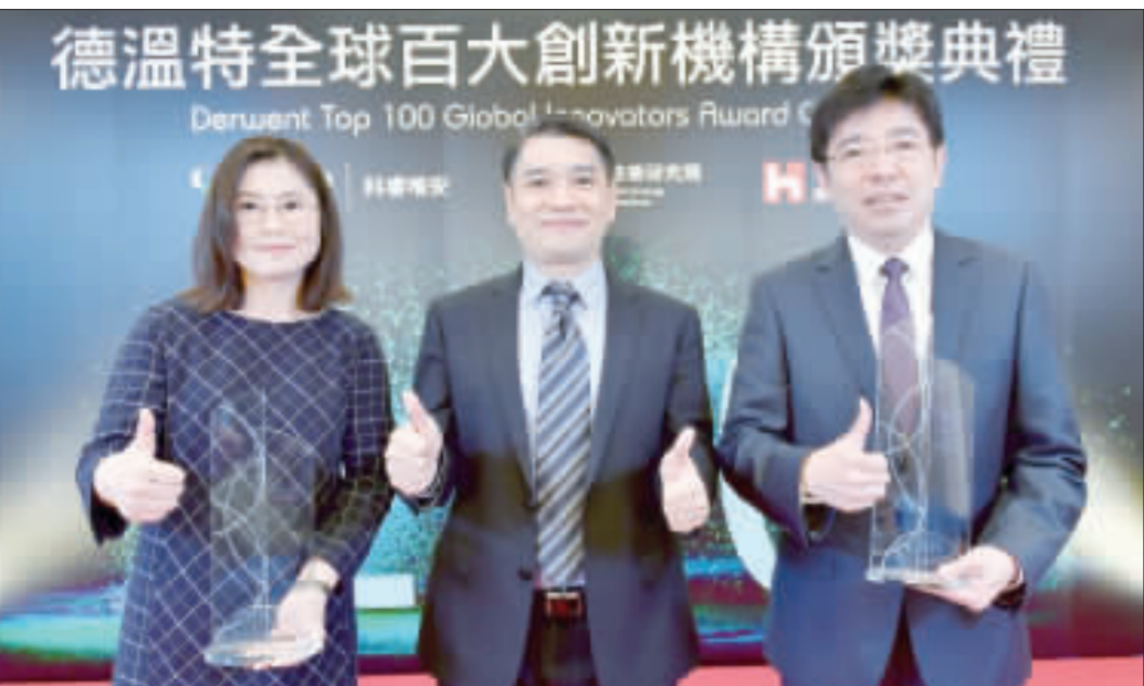
德溫特全球百大創新機構頒獎典禮，工研院與鴻海集團代表(左)接受美國科索唯安「德溫特全球百大創新機構」獎。