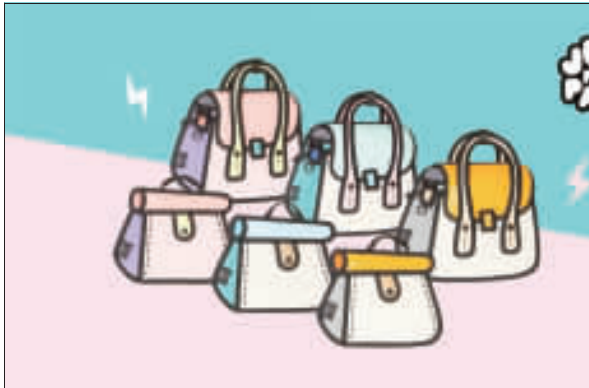
上、Jump From Paper往身上背，就能吸引眾人目光；下、Jump From Paper 10年共累積推出218個系列包款，將推出10週年紀念包款「貓頭鷹包」、「蛋糕包」。