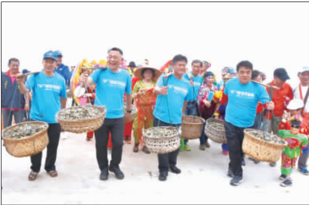
上、縣長楊鎮浚等人從蚵田挑石蚵上岸；左、民眾開心剝蚵體驗，場面壯觀。

陸泉州郵政發起千人遊金 首發團昨抵金 縣府出動電音三太子迎賓 記者翁維智/綜合報導 大陸泉州郵政為回饋儲蓄用戶，並行銷金門，昨(21)日起特別推出「郵百姓情懷，儲萬家幸福」千人遊金門大型活動，連續5天，泉州郵政將陸續組織5團(200人)抵金展開2天1夜的旅遊活動。 第1團二百多名遊客昨率先抵金，金門縣政府特別出動電音三太子在碼頭迎賓，不僅迎來小三通穿襪來去旅客好奇的目光，也為千人遊金門拉開熱鬧的序幕。縣府光處指出，此次活動由泉州郵政、建發旅遊集團、金門縣旅行社、商業同業公會與金環球旅行社共同辦理，活動 主要亮點為拓展金門觀光，活絡金門經濟，讓僅一水之隔的泉州遊客，感受金門特有的熱情與魅力。 縣府觀光處表示，縣府正極力爭取與打道福建旅遊生活圈，前於1月底由楊鎮浚縣長率隊拜會福建省、泉州市與廈門市，即提出鼓勵大陸企業員工赴金旅遊與教育訓練，尤其泉州具有地利之便，更為小三通重要進道，而且泉州潛力市場很大，知名企業與品牌眾多，正為縣府積極推廣企業旅遊之重點，未來更應加強對接，持續讓泉州小三通成長茁壯。 責任編輯/趙水樹