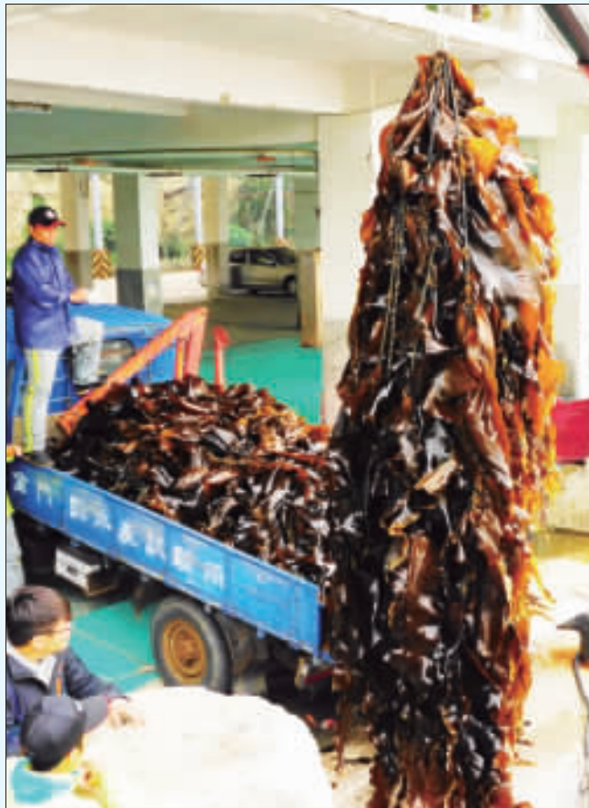
水試所新鮮海帶，今日起將陸續開始採收販售。

記者許峻／綜合報導 春季限定美食開賣囉！每年都受到地區民衆青睞，由金門縣水產試驗所自行繁殖的新鮮海帶，將在水試所內廣場進行販售，價格維持往年，以每三斤一百元的優惠售價回饋民衆，水試所歡迎大家今日午後起前往購買。 金門縣水產試驗所表示，生鮮海帶是金門春季限定的美食，水試所將在今天起陸續開始採收，基於回饋鄉親的美意，價格維持往年，以每三斤一百元的優惠售價回饋民衆，水試所歡迎大家今日午後起前往購買。 加工過且無添加物、無泡水的生鮮海帶，新鮮的海帶呈現棕色，所以建議民衆將海帶購買回去後，可先用沸騰的熱水燙洗去海帶表面的黏液，等海帶變成翠綠色後即可撈起置於冷水中，之後再裝入袋子封存至冷凍庫，約可保存一年，之後只要依個人喜好切絲、切片或製成海帶結；另也能將其曬乾(不需要加鹽)保存，只要注意不使其受潮發霉，可以保存到三年之久，每次食用再視人員多寡取之慢慢享用。 往年有民衆詢問購買的海帶表面有突出物，水試所說明，海帶在養殖過程中，葉片表皮會有局部較厚的深褐色或暗褐色之斑塊狀孢子囊，為成熟海帶獨有的特徵，在採收後會變成黑綠色；此外，葉片表面有時也會產生空腔，當空腔中有水份滲入時，表面會形成顆粒狀的水泡；無水份或是深褐色的局部斑塊，都屬於正常現象，也不會影響海帶的營養價值。 水試所養殖海帶已有十幾年，奠基於金門冬、春季海水溫度較低，適合海帶生長，是全台唯一的大量生產區，金門周邊海域遼闊，海域環境潔淨且營養豐富，養殖成本低廉，不需投資昂貴經費，因此海帶養殖是一種友善、低碳的養殖方法，是一項值得推廣的養殖產業。