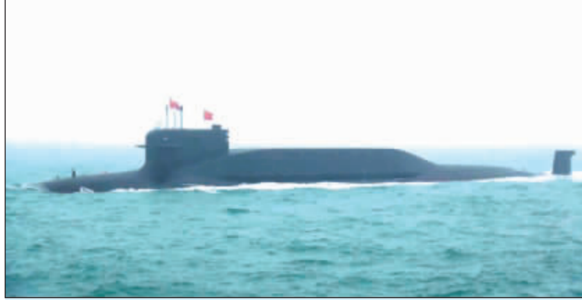
中共海上閱兵 洲際飛彈核潛艇受閱 中共解放軍23日下午在青島舉行海軍成立70週年海上閱兵式。排水量達1.15萬噸的洲際飛彈核潛艇首航11號，率先亮相。