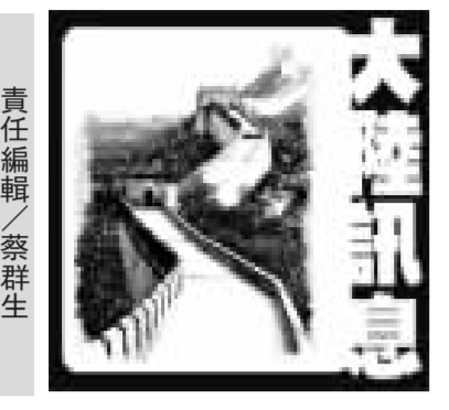
大陸一帶一路報告

中國即將在25日舉行第二屆「一帶一路」國際合作高峰論壇，官方發布報告詳述迄今多項成果，宣稱共建「一帶一路」既面臨諸多問題和挑戰，更充滿前所未有的機遇和發展前景。