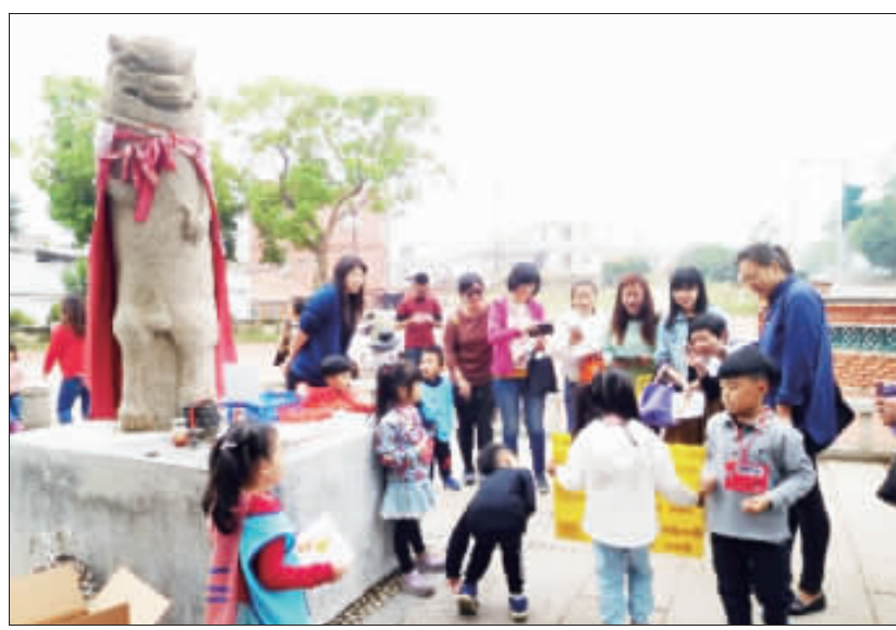
開瑄國小附設幼兒園針對教學主題「我的好厝邊」帶領學童來到瓊林社區進行戶外教學。

師從繪本故事慢導引導孩子們認識金門的守護神風獅爺，從認識探索、討論、發表、創作，更棒的是融入群體學習與人合作。 幼兒園跨班群合作計畫將學習過程發表移動至瓊林社區，在瓊林這個富有歷史文化、在地特色資源的社區，孩子們以小組分組的方式在社區中各個景點設計遊戲關卡，孩子將從社區文化中學習到的知識回饋社區，交流互動的對象不只是社區居民、家長，也可以是觀光客，透過這樣的活動讓孩子們對社區內的文化特色更加深刻，也使社區氛圍更加活潑。 責任編輯／呂士昂