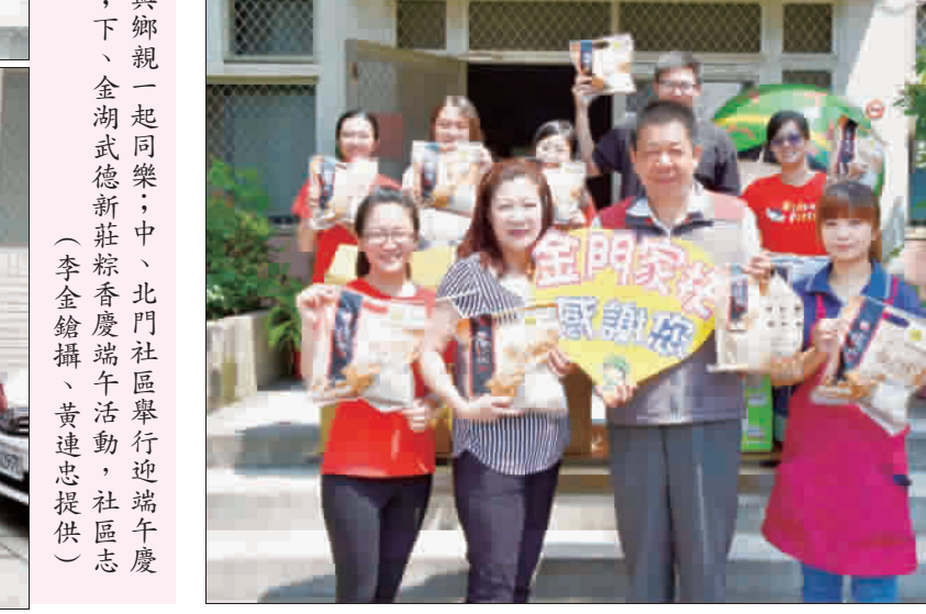
端午節將近，區漁會家政班、靜慮精舍、全聯等民間團體的愛心湧入金門家扶中心，幫助家扶家庭。

起將350顆粽子，和陳經理個人捐出的甜橙和蘋果兩大箱，送至家扶中心共同來付出社會大眾對弱勢的關懷，讓家扶的家庭可以感受到企業和民眾的關懷。此批粽子是由全聯福利中心金湖和慈湖站，發起企業員工和社區民眾所玉成的愛心粽送給家扶兒童的美事。家扶中心則安排受助家庭來中心領取愛心粽，家扶中心能向各愛心團體表達感謝之意，今年的端午節，金門弱勢家庭可以感受到社會給與的溫情和關心。