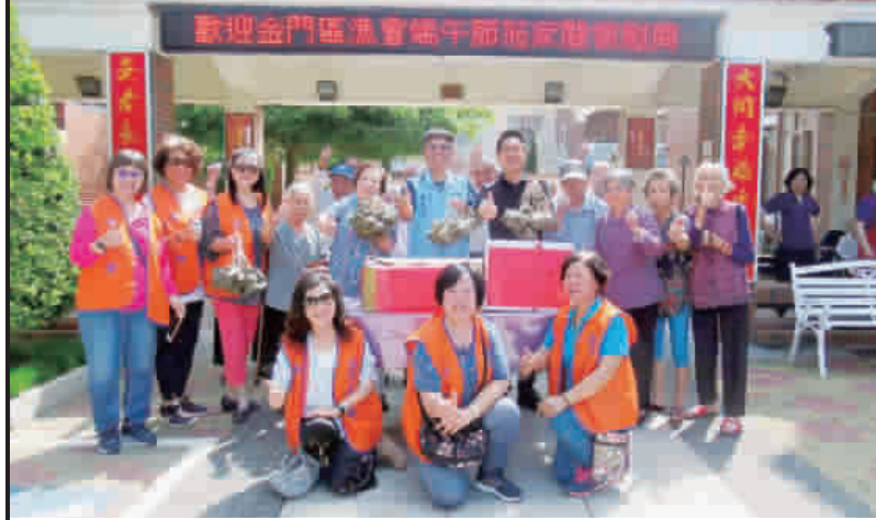
金門區漁會家政班送上料好實在的粽子給予大同之家的長輩，祝福大家平安健康。

記者詹宗翰／金湖報導 端午節將到來，婆婆媽媽忙著採買應景食材，金湖鎮鎮長陳文顯一早特地到山外傳統市場，主動關心商家供貨狀況及售價價格，並動現場攤商工作辛勞。 陳文顯肯定端節市場價格及供貨維持穩定，並於7時40分在陳振福會館陪同下視察金湖鎮公有零售市場和承銷商間好貨齊備，關心供應量與市場行情，一一走訪攤商，攤商私下說，鎮長很接地气，貼近民眾。 陳文顯表示，貨出去、錢進來，大家發大財，更歡迎鄉親到金湖零售公有市場捧場，今年端午節期間各項蔬菜、魚、肉產品市場供應充足，民眾可安心購買，並與家人歡聚享受傳統節慶假期，增進家人間情感交流。