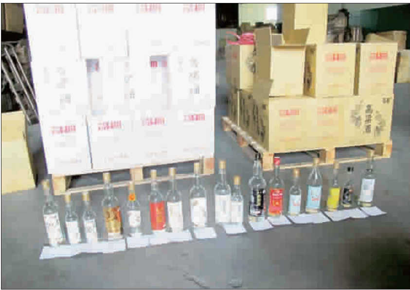
左、右：縣警局幹員跨海打假，在彰化縣與當地警方和財政處等單位，共同查獲各式侵權高粱酒品。