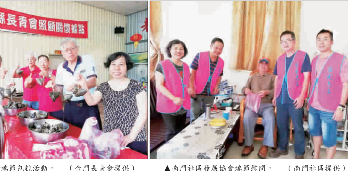
▲金門長青會端節包粽活動。 ▲南門社區發展協會端節慰問。

記者許峻魁/綜合報導 財政部北區國稅局金門稽徵所表示，被繼承人遺有大陸地區房地產者，亦應申報遺產稅。經常居住中華民國境內之中華民國國民死亡時遺有財產者，應就其在中華民國境內境外全部遺產，課徵遺產稅，並併入課稅。財政部北區國稅局金門稽徵所指出，根據遺產及贈與稅法的第十條之規定指出，遺產價值的計算，是以被繼承人死亡時之價值為準；另外根據繼承法施行細則第四十一條之規定，遺產價值的計算，本法及本細則無規定。 被繼承人於申報及贈與稅法施行細則第四十一條的規定，應依市場價值估定之，因此可委託當地公定會計師或公證人調查估定或提供繼承人原始買賣合約書以及足資證明客觀市價之資料來估價認定。 財政部北區國稅局金門稽徵所表示，該所承人遺有在大陸地區房地產，亦應申報遺產稅。經常居住中華民國境內之中華民國國民死亡時遺有財產者，應就其在中華民國境內境外全部遺產，課徵遺產稅，並併入課稅。財政部北區國稅局金門稽徵所指出，根據遺產及贈與稅法的第十條之規定指出，遺產價值的計算，是以被繼承人死亡時之價值為準；另外根據繼承法施行細則第四十一條之規定，遺產價值的計算，本法及本細則無規定。