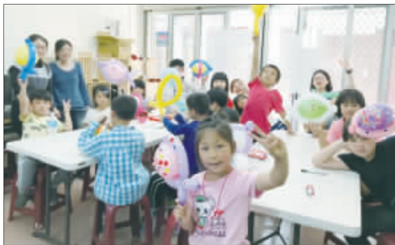
金門家扶烈嶼工作站辦理「海底撈，土裡創，山珍海味一把抓」社區兒童陪伴系列活動，小朋友樂開懷。

烈嶼工作站表示，今年透過教學課程及遊戲體驗讓兒童認識家鄉之美，深入探索家鄉特色，走出戶外與家鄉環境產生連結，活動已告一段落。社區兒童在學習體驗過程中，從知道到了解，從一知半解到可以說得頭頭是道，對於家鄉烈嶼的鹽田、金門特別魚種皆有較深入的了解。參與活動的學童們，可以運用在地野菜及貝殼設計完成作品，更自己體驗採野菜、採貝殼的樂趣。 烈嶼工作站指出，目前社區兒童們仍然每天都到社區據點的開放空間GoGo窩，享有個人閱讀和學習的空間。據點後方的舊屋空地，正好提供兒童們拔草澆水照顧好自己的小園地。學童們在課餘時間在社區裡到處跑跑，將歡笑帶進整個社區，熱鬧整個街道。 金門家扶中心表示，家扶中心烈嶼工作站設在西方社區50號，長期陪伴社區的兒童共讀、共玩及探索家鄉產業。在每週二、三、五下午及週六整天皆開放工作站GoGo窩的場域以及茉莉書屋的空間，提供在地社區的兒童入內玩耍和讀本閱覽。金門家扶中心考量社區兒童有近20餘名穩定進出GoGo窩，因此定期開放空間提供課後學習