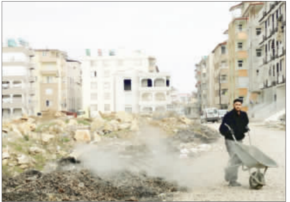
圖為雷伊漢勒市區一隅。

另外，關於行政院長蘇貞昌、總統府秘書長陳菊等人接連表態支持蔡總統，總統回應表示，感謝他們的支持，希望在初選過程中，能夠說明對國家的主張以及執政的價值，讓民進黨的同志以及支持的朋友，都覺得有信心。 蔡總統與賴清德今天不約而同都穿黑色西裝。總統穿著黑色西裝，西裝外套口袋放了一枝筆；總統說，這是為了作筆記。 賴清德同樣也是黑色西裝，但內搭紫色領帶，但內搭紫色領帶非常顯眼。外傳賴清德這條紫色領帶，他在2016年競選台南市長連任的電視政見發表會也繫同一條領帶，當年選舉得票率高達72.9%。賴清德領帶，當年選舉得票率，堪稱是賴清德的一幸運領帶。不過，賴清德發言人李退之說，賴清德這條領帶常常繫著。