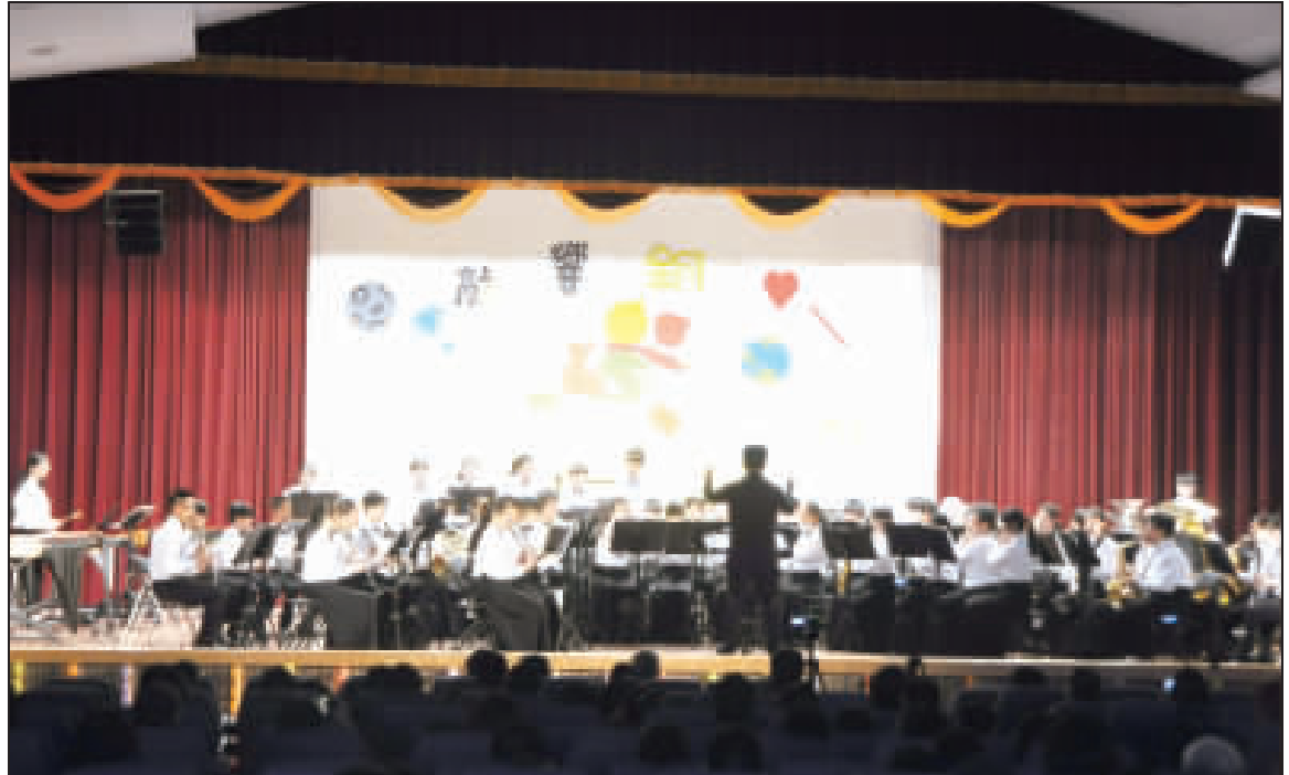
金城國中管樂團期末成果發表會昨日下午在該校藝文中心舉辦。

記者李增汪／綜合報導 金城國中管樂團今年已是連續第四年舉辦成果發表會。今年的主題以校內銅管裝置藝術「敲響銅心」為名，更取其「一童」字諧音，回顧管樂學習之路上的初表。 在成果發表會的曲目編排上，除磅磅震撼的進行曲，充滿樂比氣息、動人作品，更特別選錄了充滿回憶的動畫經典、流行樂曲、電影配樂等風格多元。