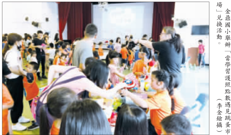
金鼎國小舉辦「當學習照顧點數遇見跳蚤市場」兌換活動。