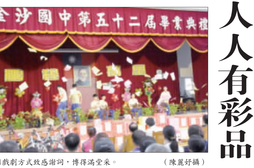
左、右：金沙國中昨日舉辦第52屆畢業典禮，與會貴賓頒發表揚績優學子，畢業生用戲劇方式致感謝詞，博得滿堂采。