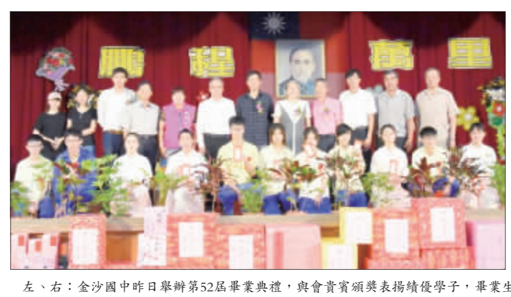
左、右：金沙國中昨日舉辦第52屆畢業典禮，與會貴賓頒發表揚績優學子，畢業生用戲劇方式致感謝詞，博得滿堂采。

活動首日前往國立科學教育館，進行情境主題式的探究學習，主題為學習步道上「究象現場大追緝」，在館內實驗室帶領參加學員複習基礎的相關知識後，針對所處情境的相關問題進行討論，現場所提供的線索，運用實驗設備進行試作，最後解決問題達成任務，從一連串的思考與回饋中，獲得相關統整概念的學習，並養成解決問題之能力。 第二日學員與蘭雅國中學生共同參與蘭雅國中數理資優班的學習課程，主題為蘭中數理資優專題探索與實作課程，涵蓋內容包括自然科學實驗觀察、數學邏輯推理等實作歷程，培養科學獨立思考與探索研究、後設思考的能力。 第三日是生態與能源科學之旅，上午走訪萬里野柳地質公園，公園所在區域是突出於海岸線的狹狹海岬，在地殼抬升過程中，歷經千萬年的侵蝕和風化的交互作用下，岩石被海水侵蝕形成了特別的外貌，園內林立包括蕈狀石、燭臺石、姜石、壺穴、棋盤石、海蝕洞等地質奇觀，其中最著名的是「女王頭」與「其未來接班人」的「俏皮公主」，怪石嶙峋有如鬼斧神工的特殊地質景觀觀讓人嘖嘖稱奇。 下午則來到位於萬里的台電北部展示館，透過導覽解說、操作體驗、劇場展示，從台電的每日發電量、電力發展史，到認識核能發電原理、安全管理與防護機制，以及未來核能科技發展的新趨勢，讓學員深入了解核能發電比例的發展趨勢，並重新認識核電的價值，結合再生能源的科技發展，以達到環保永續發展的目的。接著到陽明山小油坑旅客服務站，學員先聆聽服務站解說員說明後便實地探查火山活動所形成的噴氣孔、硫磺結晶、與壯觀的崩塌地形，當日的噴發狀況良好，雲煙裊裊，濃濃的硫磺味從遠處即撲面而來。 第四日前往台北市的天文科學教育館，從我們生活的地球開始，探索大氣層的奧妙，感受地球上不同的天氣狀態，包括日蝕、月蝕、極光等地球的美，一覽無遺，電影裡常見的科幻場景，如探測儀、太空人裝備、模擬太空站……等，館內更有詳細的解說，而浩瀚無涯的外太空，從太陽系與八大行星到各種星雲、星團、銀河、宇宙現象的照片圖列，學員可從中認識不同的星系與特徵，見識到不同的外太空面貌，透過館內各種視覺效果，充分展現宇宙與藝術的結合，不僅令人感到美不勝收，並能提升學員對於天文科學的學習興趣與素養。