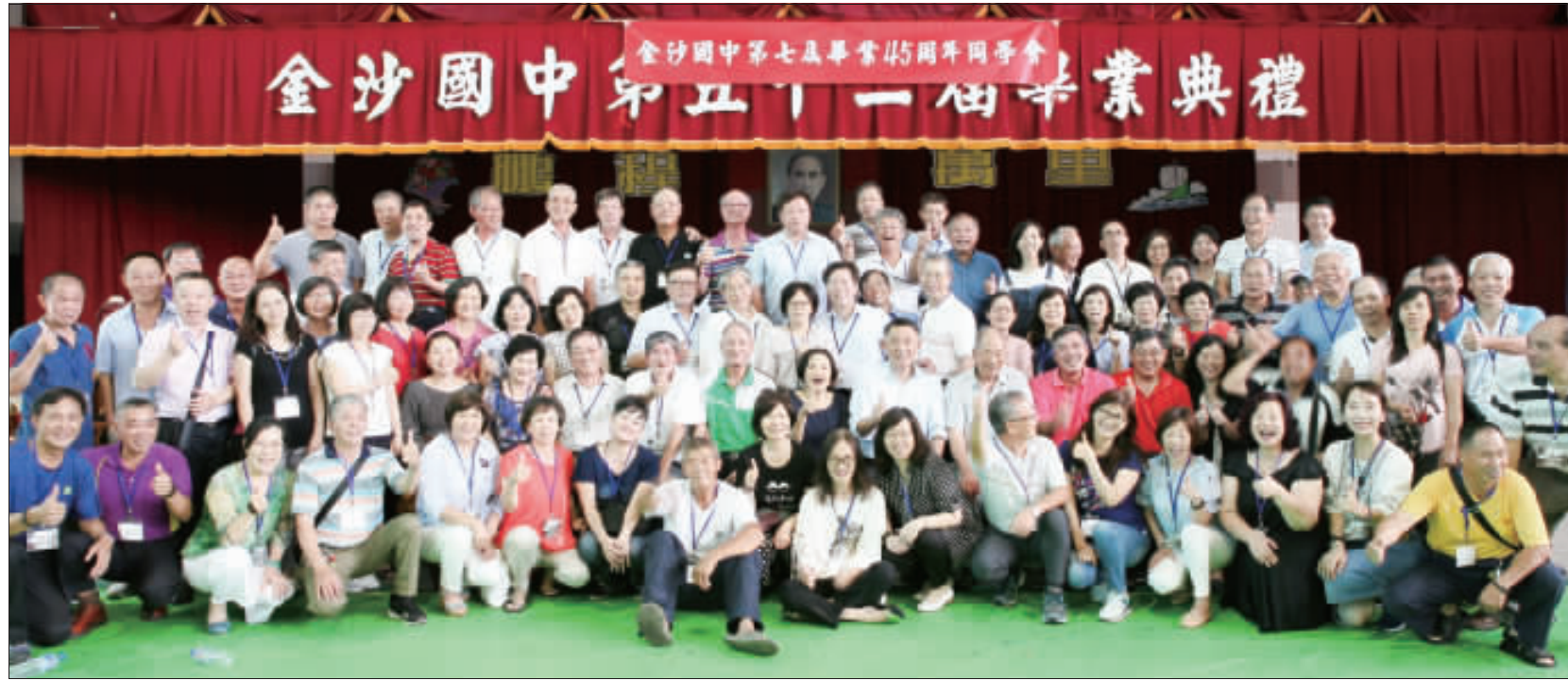
金沙國中第七屆畢業生，召開畢業45週年同學會，拜訪師長。