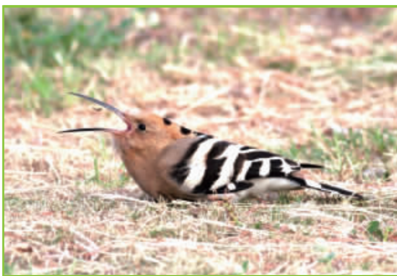
▲戴勝吞蟲妙招。(攝於石叢公園)

由於金門鳥類資源豐富，且具有特異性，無論是組團或自由行，經常都有人到金門來觀鳥。來者不僅僅是觀鳥，同時也享受金門生活步調緩慢的寧靜環境，讓工作繁忙、緊繃的情緒，沉澱下來。金門已經成為台灣愛鳥人士必來觀鳥的聖地。目前金門的長住人口，約有6、7萬人，多集中於後浦、山外和沙美外，其餘地區仍保有鄉野的狀態，也就是環境多樣，適於多種鳥類的棲息。如果未來金門的發展，建設像廈門般的高樓林立，人口也像廈門260萬人，現有的鳥類都會跑光光，這種觀光資源也就沒了。