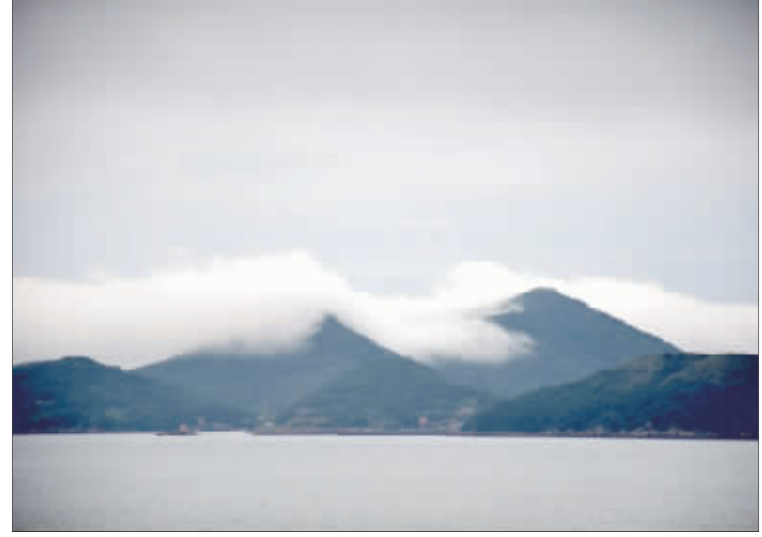
馬祖從22日起大霧，嚴重影響空中交通。