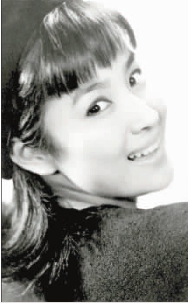
資深藝人甄珍。

【中央社記者鄭景雯台北26日電】資深藝人甄珍7月將舉辦「甄珍高雄群星會」影展，在這之前，6月28日她將在華山文創園區舉辦新書發表會——出版「真情真語：華語影視第一代玉女巨星甄珍的千言萬語」自傳，書中訴說她的人生起伏。 甄珍與她的電影是70、80年代台灣與華人社區的共同記憶，從「緹紫」、「彩雲飛」、「心有千千結」、「一箭幽夢」、「海鷗飛處」到「英烈千秋」等。甄珍出道以來，拍了80多部電影作品，曾榮獲2屆亞洲影展、獲頒金馬獎終身成就獎，她演出的作品可說是台灣電影的近代史。