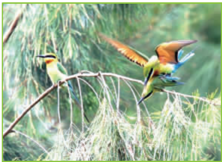
▲栗喉蜂虎樹上交配。(攝於青年山莊)

每次回金門觀鳥，內心的感覺，總是與在台灣觀鳥迥異。台灣地小人稠，即使到很偏僻的村落，仍常有摩托車和汽車等噪音的干擾。但金門的環境相當寧靜，能讓煩躁的心情沉澱下來。寧靜也是一種資源，更何況觀鳥是一種需要安寧的戶外活動。金門島上的鳥類有300多種，約為台灣鳥類種數的一半。其中長期在金門生活的留鳥，只有40種，佔金門鳥種12.9%，其餘都是南來北往的候鳥。每年有許多觀鳥團體，如台北鳥會、台灣鳥會、台南鳥會、高雄鳥會，甚至廈門鳥會等，都會組團或自由來金門觀鳥。此外，也有專門來金門拍鳥的攝影者。金門鳥類有什麼特異之處，會讓這麼多的人，願意來金門觀鳥、拍鳥。究其原因有二：一是地理因素，二是環境因素。