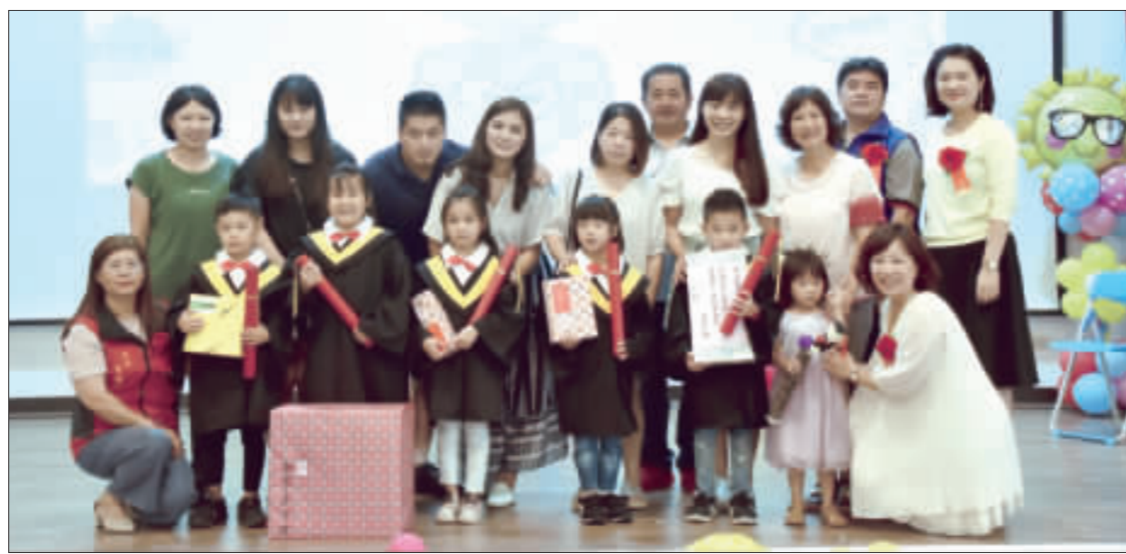
金鼎國小附設幼兒園昨舉行畢業典禮，畢業生逐一上台領畢業證書。