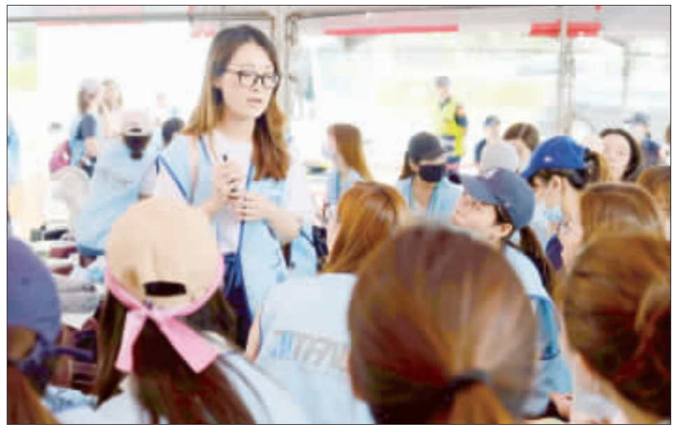
長榮空服員罷工進入第8天，工會成員以分組方式討論調整訴求。

【中央社記者王承中台北27日電】參謀總長李明哲將於7月屆齡退伍，國防部副部長沈一鳴將調任軍政副部長，國防部副部長張哲平將調任空軍司令，空軍司令部副司令熊厚基將調任空軍二級上將。熊厚基是空軍官校72年班、戰政務辦公室主任及空軍作戰指揮部指揮官等重要軍職，學、經歷完整。任職期間，指導空軍各項戰訓任務及戰力整備規劃等項工作，著有貢獻，特拔擢調任空軍司令，藉其豐富經驗，銜續推動各項建軍整備。