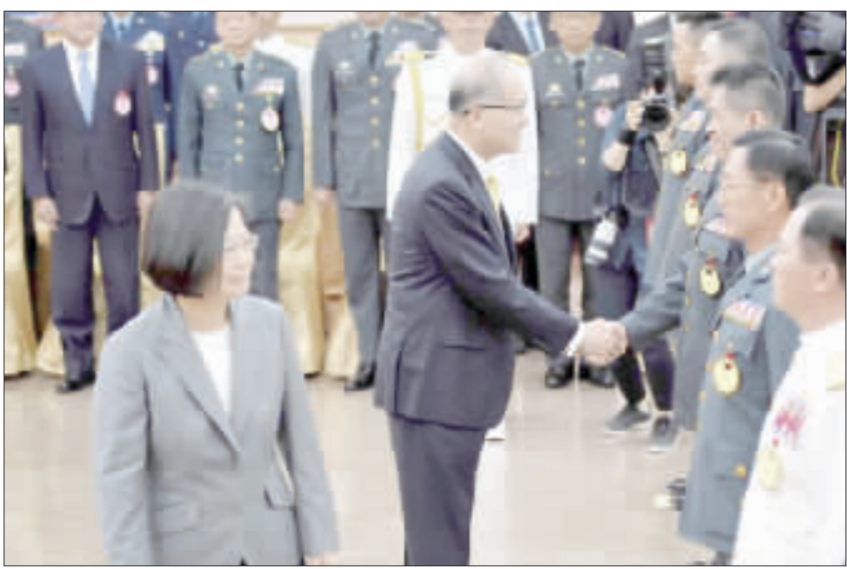
總統蔡英文(前左)、國防部長嚴德發(前左2)逐一與晉升將官致意。

【中央社記者王承中台北27日電】總統蔡英文今天出席國軍108年下半年將官晉任授階典禮，期勉將官莫忘從軍初衷，時時以捍衛中華民國為己任，不辜負國家託付與全民期許。 「中華民國108年下半年陸海空軍將官晉任授階典禮」上午在國軍俱樂部舉行，有6名人員晉升中將、13名人員晉升少將，7月1日生效，典禮由國防部長嚴德發主持，蔡總統也親臨訓勉、鼓舞軍心。 蔡總統在致詞時首先向晉任將官以及眷屬表達最誠摯的恭賀。她表示，各位晉升將官可以在今天與家人分享榮耀，除才德、學識獲得肯定之外，還要有非常傑出的績效、表現，才能獲得今天榮耀，而榮耀的賦予也代表責任加重，希望各位晉任將官未來在