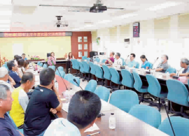
烈嶼鄉公所舉辦「108年上半年度社區交流座談會」，邀請各村村長、19個社區發展協會意見交流。