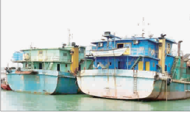
金門地檢署於該署五樓會議室進行越界抽砂的陸籍「宏興769號」、「海潤9688號」抽砂船拍賣，展現維護國土及保護環境生態之鐵腕手段。