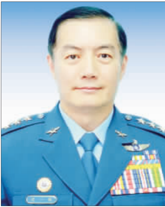
參謀總長李明哲將於7月屆齡退伍，職缺由國防部軍政副部長沈一鳴上將調任。

【中央社記者王承中台北27日電】參謀總長李明哲將於7月屆齡退伍，國防部副部長沈一鳴將調任軍政副部長，國防部副部長張哲平將調任空軍司令，空軍司令部副司令熊厚基將調任空軍二級上將。熊厚基是空軍官校72年班、戰政務辦公室主任及空軍作戰指揮部指揮官等重要軍職，學、經歷完整。任職期間，指導空軍各項戰訓任務及戰力整備規劃等項工作，著有貢獻，特拔擢調任空軍司令，藉其豐富經驗，銜續推動各項建軍整備。