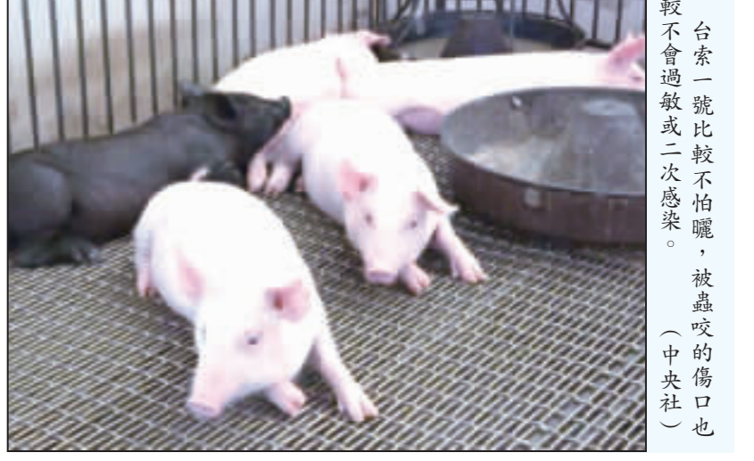
台索一號比較不怕曬，被蟲咬的傷口也較不會過敏或二次感染。

【中央社記者吳晉祺桃園15日電】桃園市大溪區具百年歷史的新勝社飛龍團，今年獲邀參加日本「成田傳統藝能祭」活動，今年由秘書處團長顏子傑代表桃園市長鄭文燦，率領具百年歷史的大溪區新勝社飛龍團前往參訪，除了擔任開幕式首組表演團體，也在遊街活動打頭陣，將表演團體、日本遊客驚呼聲連連搶著合照，成功的將桃園傳統技藝文化輸出到日本。 顏子傑指出，舞龍常出現在台灣廟會祭典及重要慶祝場合，具有祈求風調雨順、國泰民安寓意，但因表演時相當耗體力，因此新勝社特別精挑25名舞龍手，更新新編訓練演出，將傳統廟會文化呈現在日本觀眾面前，也成功的將桃園行銷到國際。 顏子傑此行也轉交鄭文燦的親筆慰問信給成田市長小泉一成，表達對颯風造成嚴重災害的關心外，也展現對雙方締結友好城市3年的珍貴，也展現對颯風造成嚴重災害的關心外，也展現對雙方締結友好城市3年的珍貴，也展現對颯風造成嚴重災害的關心外，也展現對雙方締結友好城市3年的珍貴。