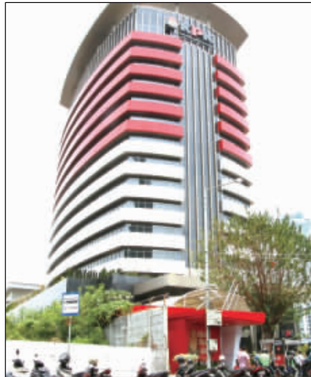
印尼肅貪委員會被認為是最受信賴的官方單位。

【中央社記者石秀娟雅加達9日電】印尼國會近期修法削弱肅貪委員會的獨立性，引發全國大規模抗議，迫使支持修法的印尼總統佐科威鬆口表示，願思考發布撤回修訂案。 印尼在2020年開始推動肅貪委員會正案的命令，此舉立即招致許多政黨反彈。佐科威會如何決定，對他下個任期的施政有關鍵影響。 印尼上屆國會在9月底卸任前，獲得佐科威(Joko Widodo)支持，在一週內快速完成KPK修法，大幅削弱KPK的獨立性。以學生為主體的抗議蔓延至雅加達等全國至少9個城市，抗議者喊著「KPK已死」，有至少2名學生不幸喪生。 如果修正案生效，KPK的運作將受一個新成立的監督機制指揮，監督機制成員由總統提名，與國會諮商，讓KPK從獨立機關變為政府機構。此外，KPK將無權獨立行使監督權，而須先獲監督機制同意，監督機制可要求KPK終止進行中的調查。 印尼過去的民調顯示，國會是最貪腐的機構，過去也曾多次試圖削弱KPK，但都未能成功，主要是因為多數民衆力挺KPK。這次國會在佐科威的支持下倉促修法，讓許多佐科威的支持者大感失望，佐科威也自陷進退兩難的困境。 印尼國會通過KPK修法後原本打算修刑法修正案，新增限制婚前性行為，可能用於打壓言論自由及宗教自由的修文，同樣成為抗議焦點。佐科威與國會溝通後，決定暫緩刑法的修正，延燒多日的街頭抗議日前也暫時落幕。 但民間呼籲佐科威撤回KPK修正案的聲浪沒有停止，學生運動要求佐科威在14日前撤回修正案，否則將再度上街。 佐科威連任成功後曾多次說，他之後不再連任，沒有包袱，能放手改革。在KPK修正案的議題上他要選擇與民衆或政治菁英靠攏，將是他執政歷史定位的第一道考驗。