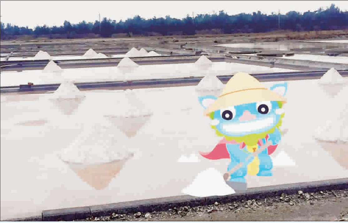
金沙鎮APP尋找風獅爺正如如火如荼進行，吸引不少鄉親及遊客參與，右圖為本週AR風獅爺。金沙鎮公所慶假期加碼服務遊客兌獎，敬請遊客多加利用。

記者陳麗好／金沙報導 2019金沙鎮「高粱老街風獅爺文化季」即將於10月19日及20日，假金沙戲院前辦理。金沙鎮公所今年推出「金沙鎮尋找風獅爺APP」集點兌獎活動，正如如火如荼進行中，而訂於每週出現兩題之實境(AR)旅行風獅爺，5日起一連三個星期六、日開放4尊旅行風獅爺；而逢國慶連續假期(非金門籍)兌領紀念品，敬請鄉親、遊客把握機會參與體驗，洽詢電話：32156轉267。 2019金沙鎮「高粱老街風獅爺文化季」即將於10月19日及20日登場，金沙鎮公所規劃系列活動，包括：親子體驗活動(風獅爺風鈴雪花黏土DIY、高粱掃把DIY(由農試所協辦)、風獅爺紅龜粿DIY、寫生比賽、APP尋找風獅爺集點兌獎、美食園遊會、相印機拍照等。相關活動訊息將陸續公告。 而其中，APP尋找風獅爺集點兌獎活動正進行中，今年新增置9尊風獅爺及10款實境(AR)旅行風獅爺，並設計月挑戰活動，供鄉親及遊客深入鄉里尋寶，體驗金門人文之美。民眾並可按點數兌領相對應之風獅爺主題紀念品。而如果不對及尋找累積點數也沒關係，今年更結合金沙地區24間商家，推出消費紅利點數回饋，有需要的民眾也可多加利用。 金沙鎮公所為行銷金沙觀光，讓更多遊客能參與今年文化季活動，除了在APP中設計遊客參與的挑戰門檻，原利用星期一至五上班日受理遊客兌獎。逢國慶連續假期，為利遊客能搭上今年金沙鎮風獅爺列車，並順利尋寶集點兌領紀念品，一同感受活動的樂趣，特別於10月11日至10月13日中午12點至下午4點加碼服務遊客，金沙鎮公所敬請完成兌獎門檻之遊客(非金門籍)，攜帶身分證及搭機證明前往金沙鎮公所二樓兌獎，如有相關兌獎疑問可電洽32156轉267查詢。