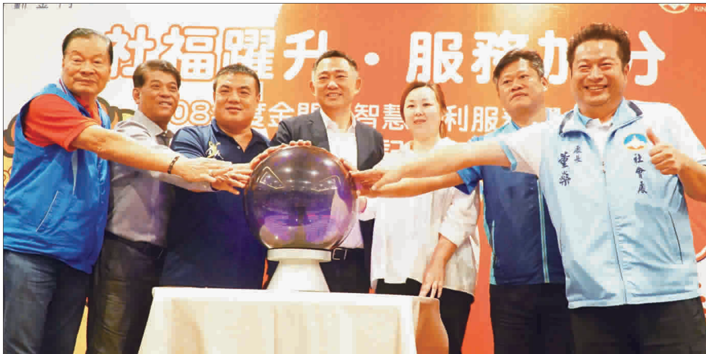
金門縣智慧福利服務躍升計畫昨日舉行啟動記者會。