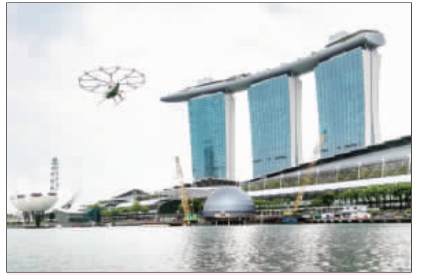
德國企業Volocopter空中計程車在新加坡濱海灣上空試飛。