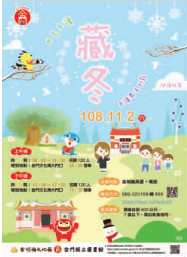
文化局邀請民眾一起實地踏訪認識家鄉，11月2日將走訪古官道豐蓮山段。

金門閱讀島 走讀庵前吳厝村庄 25日報名 記者詹宗翰／金城報導 金門縣文化局為推廣閱讀，辦理「走讀村莊」系列活動，第一梯次「藏冬」活動，將於11月2日登場。活動自10月25日上午9時起接受報名，歡迎報名參加。報名網址：https://reurl.cc/9GcKtV，報名電話：082-323163轉506。 文化局表示，歡迎全縣之民眾踴躍報名參加圖書館活動，「走讀村莊」系列活動「藏冬」活動，將於11月2日登場。活動自10月25日上午9時起接受報名，歡迎報名參加。報名網址：https://reurl.cc/9GcKtV，報名電話：082-323163轉506。