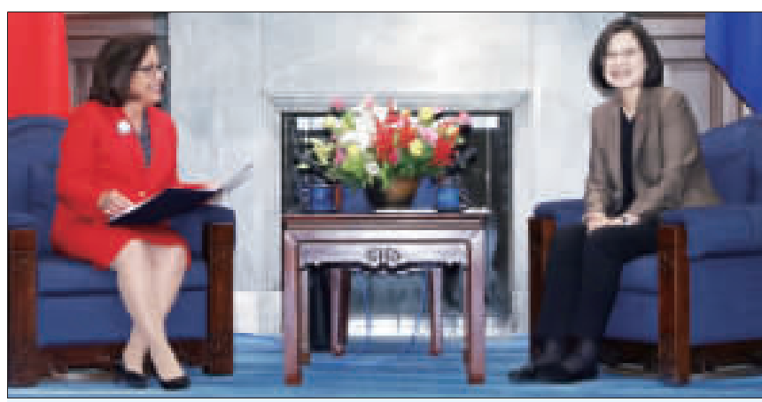
總統蔡英文（右）25日在總統府與馬紹爾群島共和國總統海妮（Hilda C. Heine）（左）會談，盼深化兩國交流，提升友好的雙邊關係。