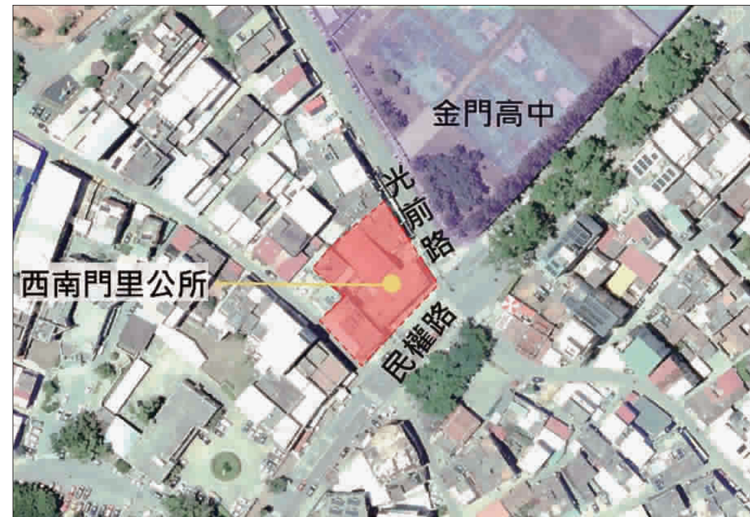
由金門縣政府主導啟動開發的金門首件都更案，經擇定將在金城鎮西南門里公所及其周邊地區進行。

記者翁維智/縣府報導 由金門縣政府主導啟動開發的金門首件都更案，經擇定將在金城鎮西南門里公所及其周邊地區進行。 縣府財政處指出，西南門里公所位於金城鎮民權路與光前路交接路口，屬城鎮核心區域，地理位置良好。西南門里公所現有建物為民國79年興建之二層樓建築物，平時做為里民集會活動中心及三節配酒之場所，但現況建築物破舊，內部屋頂水泥剝落、鋼筋外露，有傾頹及朽壞之虞。經委託福建金門馬祖地區建築師公會鑑定都市危險及老舊建築物結構安全，評估結果未達結構安全最低標準，應辦理重建。 財政處表示，縣府考量本核心區域之居住環境，為帶動商業發展，提供公益設施，藉以提升居民生活品質，決定採都市更新進行環境改造，並以此作為改善舊市區都更的首推典範。 另縣府也將透過都更重建方式，整合周邊有參與更新意願之老舊建物所有權人共同辦理重建。重建後可提供更多公益性設施，改善居民老舊重建需求及地區停車空間不足之問題，創造都市再生效益，作為本縣推動都市更新之示範基地。 而為加速都市更新作業期程，並完善公辦都市更新程序，縣府刻正與受委託之專業顧問機構「中華民國都市計劃學會」，在日前召開「金門縣金城鎮西南門里公所暨周邊地區公辦