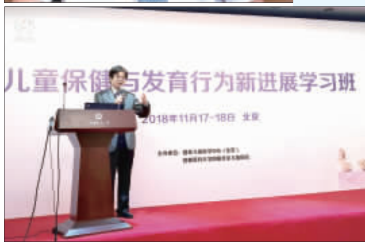
兒童保健與發育行為新進展學習班

縣政府向行政院內政部爭取金門地區應儘速設立身心障礙教養院，經他的努力推促，93年10月，獲中央補助下，終於看到金門地區第一所身心障礙教養院的雛型。97年「福田家園」完工啟用。 金門縣福田家園位於金湖鎮溪湖里裕民農莊26號，由金門縣政府社會處主管。97年03月起開始公設民營化經營，收容6歲以上，未滿65歲之中度以上智能障礙、肢體障礙、多重障礙等身心障礙者。以及低收入戶、中低收入戶、短期緊急安置、特殊個案。共有住宿110床、日間照顧20床。 力促傳統推拿工作權，獲「台灣推拿師之父」稱號 吳東昇指出，他的職志是幫身心障礙者訓練成殘而不障、且轉化為具有正面效用的社會人，比如喜歡兒得製作麵包、肢體殘障者可以從事清潔工作、盲人會按摩，甚至像蕭煌奇一樣當個歌手，雖身有殘疾不便，但可憑己之力自食其力養活自己，也改變社會對身障者的異樣眼光。