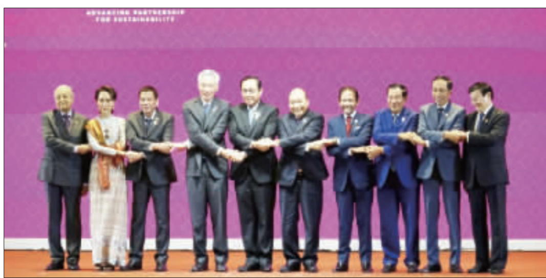
第35屆東南亞國家協會高峯會（ASEAN Summit）3日在曼谷北郊的IMPACT展覽中心舉行開幕式，東協10國領袖與會。

【中央社記者呂欣博曼谷3日專電】第35屆東協峰會今天在泰國曼谷登場，南海議題和RCEP是會議焦點。中國國務院總理李克強表示，中國和東協合作讓南海更穩定。但有菲律賓官員透露RCEP恐怕無法在今年完成。 第35屆東協國家協會高峯會（ASEAN Summit）及相關會議2日到4日在曼谷北郊的IMPACT展覽中心舉行。將於4日登場的東協峰會（East Asia Summit）亦在同地點舉辦。