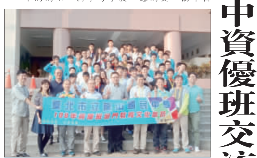
台北市龍山國中資優班和金城國中進行交流，移地教學帶給雙方更多的良好刺激。(金城國中提供)