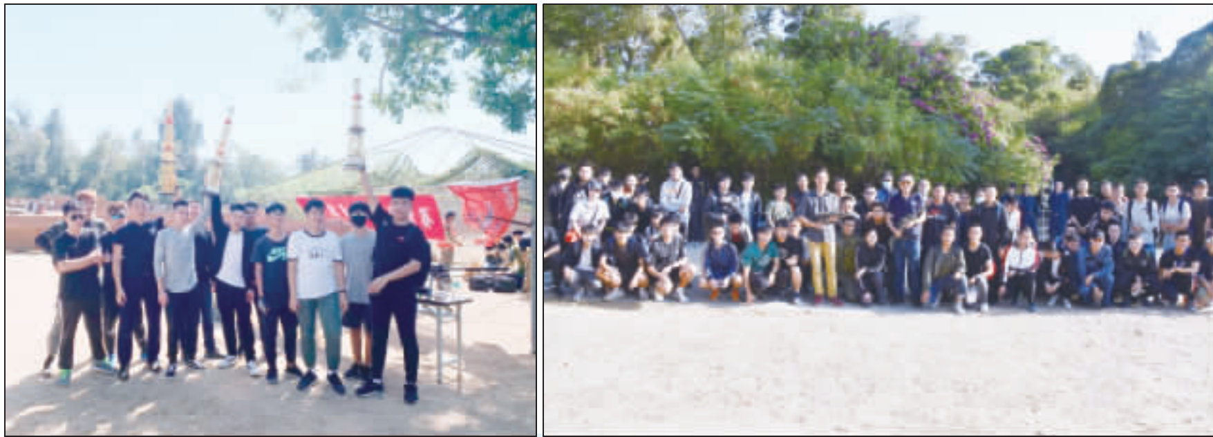
左、「第一屆金門縣生存遊戲CQB邀請賽」獲勝隊伍；右、參賽人員合影。