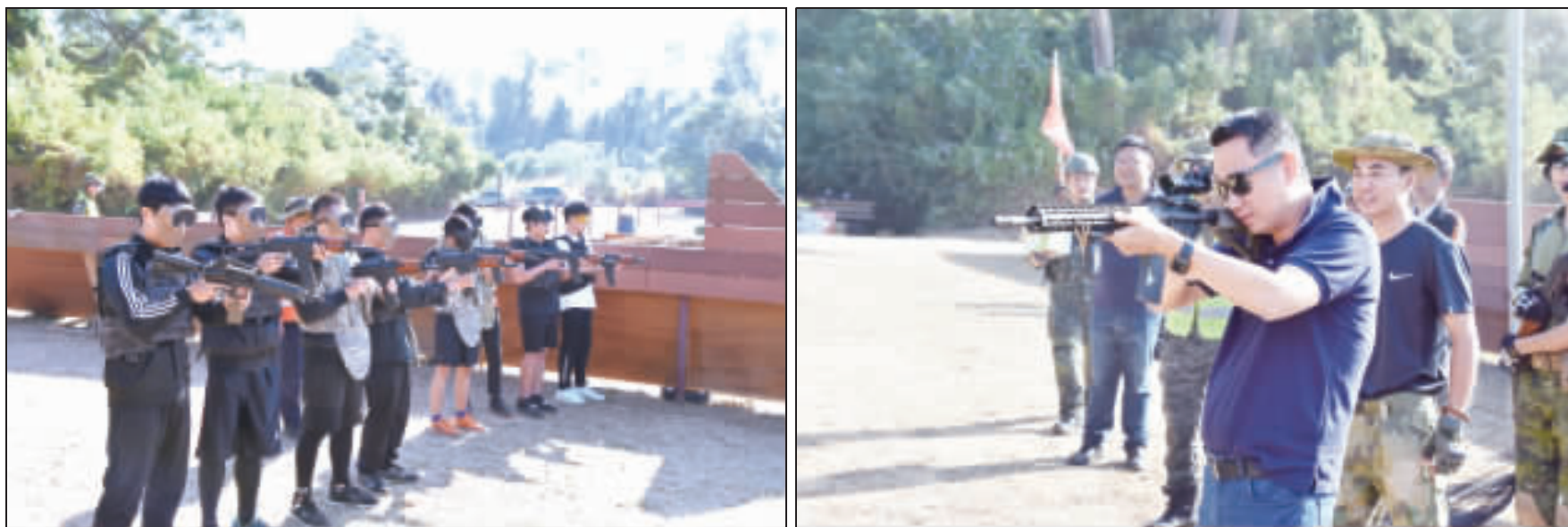
左、「第一屆金門縣生存遊戲CQB邀請賽」昨日在西洪營區舉行；右、縣長楊鎮潁體驗射擊樂趣。