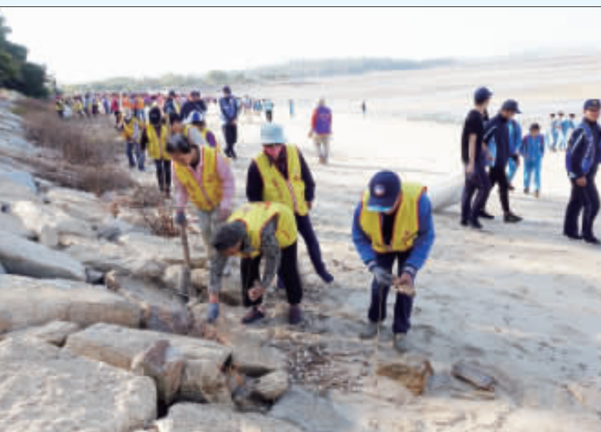
響應淨灘，金城鎮公所號召六百餘人參加。

這塊土地犧牲的兩岸英靈，離苦得樂，往生佛國善處。並藉此祈求兩岸能夠永久和平，遠離戰爭。讓金門這塊土地更慈悲、更祥和。 福慧寺也說明，法會當中除了施食，解除餓鬼飢虛之外，最重要的是為他們說法、皈依、受戒，令他們具足正見，不再造罪業。苦，早日脫離苦趣，成就菩提。 「瑜珈焰口」是根據《救拔焰口餓鬼陀羅尼經》超度餓鬼道眾生，緣起於觀世音菩薩向阿難尊者顯示面然鬼身，讓阿難尊者體悟無常，從而透過請佛開講來生得到施食儀軌。而此次，焰口施食法會，主要是通過主法的金戶名：福慧寺。 剛上師，經由身結手印，口誦真言，意持觀想，以達到身、口、意三密相應，即身為本尊聖觀音，進而能為鬼道眾生，變現甘露法食，進能為鬼道眾生，變現甘露法食，進能為鬼道眾生，變現甘露法食。 此次法會時程排定如下，歡迎鄉親一同發心參與，法會日期為國曆11月22日至23日，(11/22(五)，上午9:00起佛授「八關齋戒」，下午2:00-4:30念佛。11月23(六)，上午9:00-下午4:30念佛一日。11月24(日)，上午9:00念佛，下午2:00-6:00古寧頭戰役七十週年「一炮一施食」法會。福慧寺地址：金門縣金沙鎮陽翟20號，電話：082-351943。劃撥帳號：1986-7824。