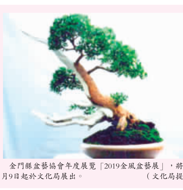
金門縣盆藝協會年度展覽「2019金風盆藝展」，將自11月9日起於文化局展出。

記者翁維智／金風盆藝展報導 金門縣文化局主辦的「2019金風盆藝展」在11月9日至12日假金門縣文化局(二)展覽廳展出，於11月9日(六)上午10時在文化局大廳舉行開幕儀式，歡迎踴躍參觀。 盆藝是活的藝術，變化無窮，以枝、葉、花、果，配合疏實、疏密、巧拙、枯榮、粗細、藏露，依美學理念與造形藝術，創造出形神兼備、有飄逸、有蒼勁、有古風、意境高和意味。 古典與現代的盆景精品，把大自然縮於咫尺盆中，講究整體美感、空間比例和色彩變化，以呈現詩畫意境的盆景藝術為主軸，誠摯與大家分享盆景藝術的樂趣，歡迎大家踴躍前往觀賞。