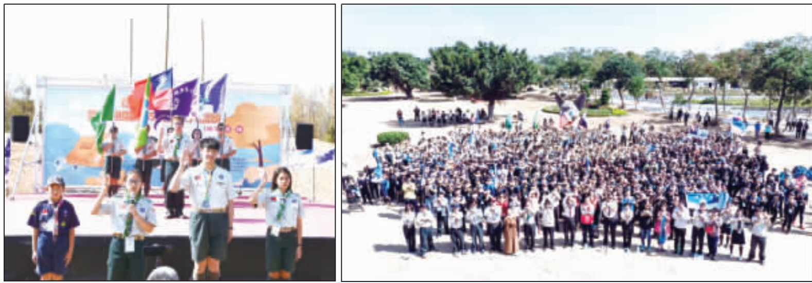
左、右：金門地區第35次童軍大露營在林務所展開，昨日舉行開幕典禮。