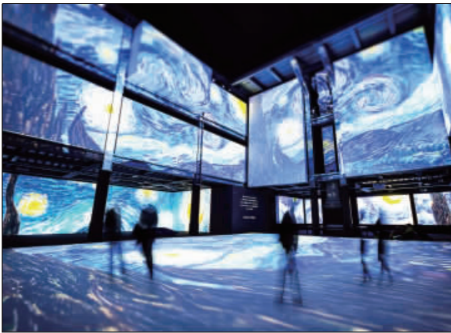
由澳洲策展公司Grande Exhibitions策劃的「再見梵谷—光影體驗展」2020年將首度登台，帶領觀眾以科技藝術形式，重新探索梵谷跨時代的才華和美術成就。

【中央社記者鄭景雯台北7日電】一巡迴全球超過50個城市、累積超過60萬人次觀看的「再見梵谷—光影體驗展」，2020年將首度登台，觀眾將在超過5公尺、近3層樓高的投影巨幕，進入梵谷的魔幻空間。