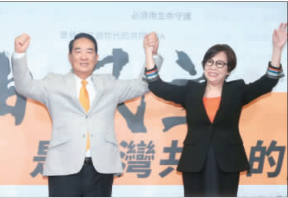
親民黨主席宋楚瑜(左)13日舉行記者會，宣布投入2020總統選舉，並公布副手人選為聯廣傳播集團董事長、廣告名人余湘(右)。

【中央社記者王承中、郭建伸台北13日電】親民黨主席宋楚瑜今天正式對外宣布，將投入2020總統大選，並說這是他的「終局之戰」。這是宋楚瑜第4度角逐總統，第5度參與總統大選，他的副手人選則選上聯廣傳播集團董事長、廣告名人余湘。 親民黨今天上午召開全國黨員大會，正式宣布參選總統。宋楚瑜說，這是他的「終局之戰」，不計利害，只求名，「我的輸贏不重要，只求台灣勝、中華民國贏！」 宋楚瑜演說後，宣布副手人選為余湘。 【中央社記者王承中、郭建伸、蘇龍龍台北13日電】親民黨主席宋楚瑜今天宣布參選2020總統，並表示將和鴻海創辦人郭台銘合作，親民黨不分區立委名單會有「郭台銘董事長的影子」；郭建伸則說，郭台銘對於幫忙站台並不排斥，泛藍郭粉可把政黨票投給親民黨。 宋楚瑜今天召開記者會宣布參選2020總統，副手為廣告名人余湘。郭台銘稱像劉有彤、蔡沁瑜等人都到場。 宋楚瑜參選宣言中提到，9月17日早上才開始對參