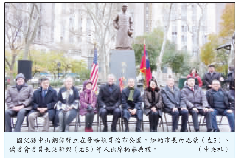
國父孫中山銅像豎立在曼哈頓哥倫布公園。紐約市長白思豪(左5)、僑委會委員長吳新興(右5)等人出席揭幕典禮。

【中央社記者張祈花花蓮13日電】因應非洲豬瘟，花蓮縣議員魏嘉彥今天建議縣府引進黑水虻，幼蟲一天可吃3公斤廚餘，又可作為農牧魚飼料，以生態處理廢棄物。 魏嘉彥指出，目前主要以中央補助建置的2台廚餘高效能處理系統去化，部分鄉鎮則自行堆肥、掩埋，但廚餘量仍有處理空間。 魏嘉彥今天在議會質詢建議，機器建置費用高，也有耗損率，西部近年推廣生態循環經濟，以彰化縣田中鎮為例，每月近20噸廚餘，就有2.5噸透過黑水虻處理，若能引進花蓮各鄉鎮推廣，就能減少廚餘去化壓力。 魏嘉彥表示，一套黑水虻養殖系統建置經費只需約新台幣40萬元，養殖技術則需專業人員輔導，建議縣府可從學校、鄉鎮公所推廣。 魏嘉彥指出，前段處理廚餘沒問題，但後端處理，過去學術報告也發現黑水虻幼蟲到成蟲確實具效益，且成蟲具高蛋白，適合作為雞隻、魚類飼料，具有農業循環經濟實力。 魏嘉彥指出，前段處理廚餘沒問題，但後端處理，過去學術報告也發現黑水虻幼蟲到成蟲確實具效益，且成蟲具高蛋白，適合作為雞隻、魚類飼料，具有農業循環經濟實力。 魏嘉彥指出，前段處理廚餘沒問題，但後端處理，過去學術報告也發現黑水虻幼蟲到成蟲確實具效益，且成蟲具高蛋白，適合作為雞隻、魚類飼料，具有農業循環經濟實力。