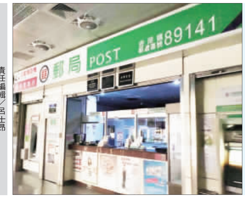
台電昨無預警停電造成東半島多戶居民無電可用，機場也巧巧發生跳電。

記者許峻魁／綜合報導 台電昨(十三)日無預警停電，導致東半島包括山外、塔后、漁村等地民衆無電可用，經過緊急搶修後，在昨日上午十點左右恢復正常供電。統計約有六千七百餘戶的用電戶受到影響。 台電在十三日的上午九時左右，因夏興電廠控制電源故障，#1、#2主變二次側CB跳脫，造成所轄七條饋線停電而造成停電，經過搶修後在當天十時十二分恢復供電。不過巧合的是，航空站昨日上午也發生停電狀況，據傳半小時內頻繁跳電了十次，導致候機大廳的燈光忽明忽暗；此外也讓隨團購票的旅客無法順利開票，只能動用人員進行手動慢慢來，造成時間延宕；此外通關過程也多少受到些許影響。 金門航空站解釋，航站昨日上午的停電，主要是塔山電廠的供電電壓過低所造成的電力不穩定，隨後航空站也馬上啟動發電機來進行緊急供電，只是在緊急供電的這段期間，無法供應中央空調。不過昨日停電的時間約半小時左右，因過程很短都是「閃停」，所以對於航班的影響並不是很。 台電金門區營業處說明，昨日的停電主要是夏興電廠控制電源故障跳脫才停電，停電時間為上午九時，不過經派員從其他線路先行供電後，再配合夏興與控制電源重啟，一小時後便恢復；而民航站方面的供電則是正常，台電經過瞭解後，應該是航站內部的低電壓保護電壓偵測到電壓不穩，保護電壓跳脫導致，才會影響內部用電。