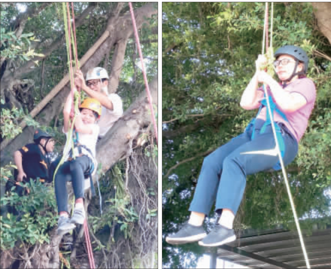
柏村國小辦理校樹「榕樹爺爺攀樹體驗」活動。