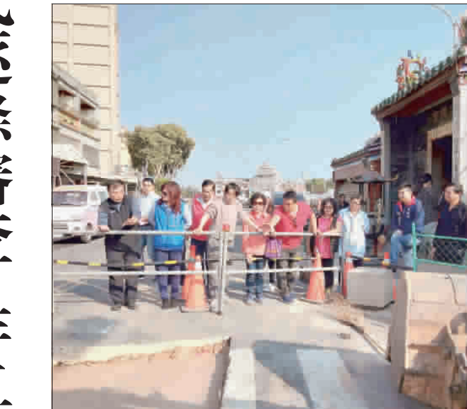
金城鎮代表會定期會，鎮務考察了解地方建設現況。

記者陳麗好／金沙報導 金門縣金沙鎮民代表會第十二屆第二次定期會，經過昨(十三)日第一、二次逐條審查，完成「金沙鎮民代表會109年度總預算案」三讀案之第二讀會，經大會審議通過。大會審議通過，其中，行政科(一)一般事務費(配合年節活動及民俗慶典慰問致費用款)，因重複編列，為免浪費公帑，原編列1,000,000全部刪減。另，社會課(一)政府機關之補助(補助本縣其他公立學校舉辦各項活動等經費)，本於鎮公所經費係以補助鎮民為宜，故原編列120,000，全部刪減。