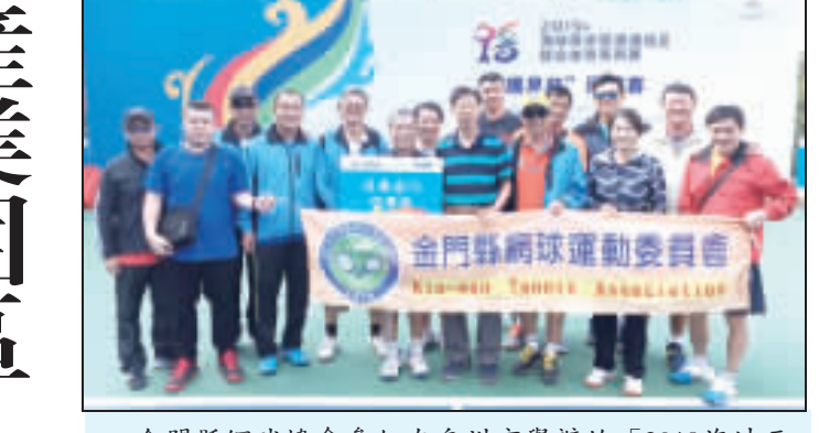
金門縣網球協會參加在泉州舉辦的「2019海峽兩岸暨港澳地區網球賽」，獲得第二名。

記者廖宗翰／綜合報導 「2019海峽兩岸暨港澳地區網球賽」日前在泉州舉行，金門縣網球協會派員參加，奪得第二名。 這項於本月9日、10日舉行的網球賽，據稱參賽人數和賽程規模遠超往年，經過一番激烈角逐，金門縣網球協會派員參加，奪得第二名。 據悉，這是海峽兩岸暨港澳地區網球賽自2015年創辦以來，每屆團體賽由五場單打比賽組成，每場雙打五局（指單打選手年齡和，下同）以上組、女雙六十歲以上組、混雙九十歲以上組、男雙一百歲以上組。比賽採用五場三勝制，錄取前八名。 「海峽兩岸暨港澳地區網球賽」由中華全國體育協進會聯合主辦，自2012年舉辦以來，受到了兩岸及港澳地區網球愛好者的喜愛和支持。活動旨在為網球愛好者搭建一個相互交流、相互學習的平台，促進海峽兩岸、港澳地區的文化體育交流，希望帶動越來越多人參與全民健身。