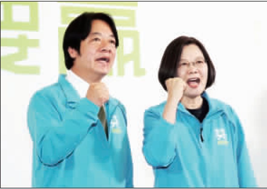
總統蔡英文(右)17日宣布，副手為前行政院長賴清德(左)，兩人也呼口號，展現團結氣氛。

【中央社記者顧亭、葉素萍台北17日電】總統蔡英文17日宣佈，副手為前行政院長賴清德，以「蔡賴配」角逐2020總統大選，迎戰國民黨選人韓國瑜、前行政院長張善政的「國政配」，以及親民黨黨主席宋楚瑜和知名廣告人余湘的搭檔。 總統蔡連任辦公室上午舉行記者會宣布副手人選，蔡總統、賴清德、副總統陳建仁、民進黨主席卓榮泰等人共同出席。平時身穿西裝的賴清德換上競選外套，4人同台上高呼「2020台灣要贏」口號，展現團結氣氛。