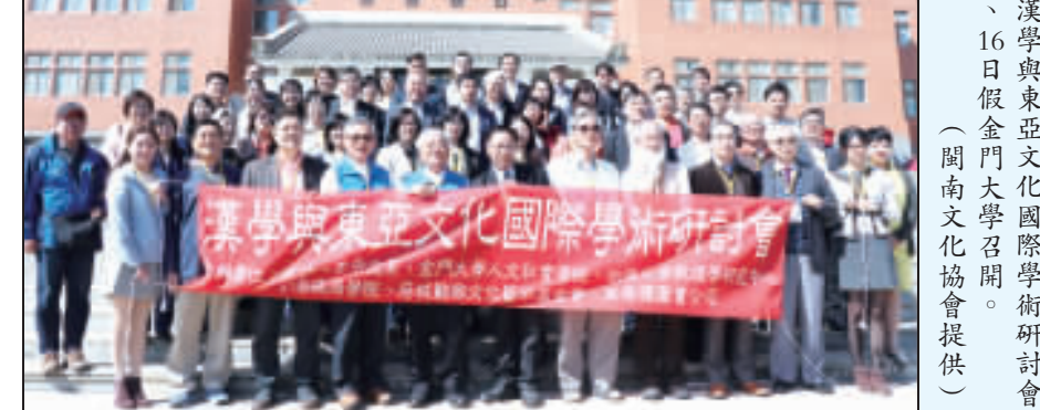
漢學與東亞文化國際學術研討會，15、16日假金門大學召開。