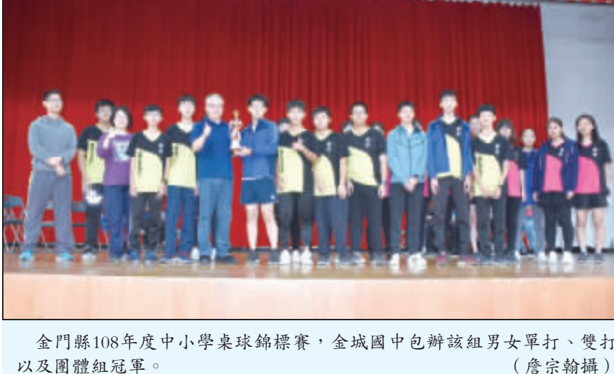
金門縣108年度中小學桌球錦標賽，金城國中包辦該組男女單打、雙打以及團體組冠軍。