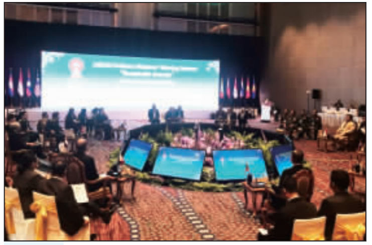
▲圖為東協防長非正式會議開幕式。

【中央社吉隆坡電】東協10國國防部長在吉隆坡非正式會議開幕式，多國防長發言聚焦南海議題，而東協防長非正式會議在吉隆坡開幕。東協防長非正式會議在吉隆坡開幕，與會防長在會後表示，將繼續推動南海和平與穩定。 【中央社吉隆坡17日專電】東協10國國防部長在吉隆坡非正式會議開幕式，多國防長發言聚焦南海議題，而東協防長非正式會議在吉隆坡開幕。東協防長非正式會議在吉隆坡開幕，與會防長在會後表示，將繼續推動南海和平與穩定。