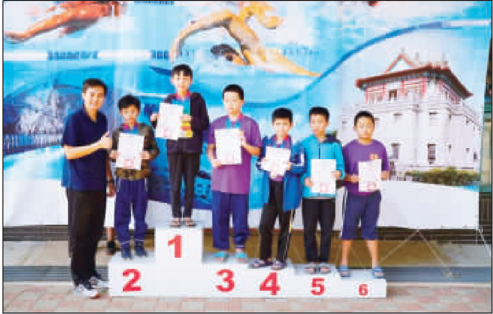
金門縣108學年度中小學游泳錦標賽頒獎嘉勉各組績優選手。(主辦單位提供)