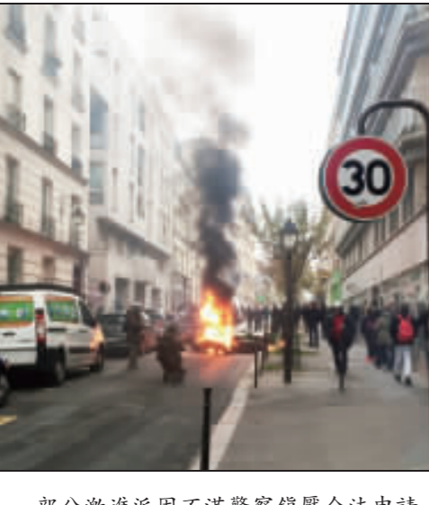
部分激進派因不滿警察鎮壓合法申請的集會，開始焚燒汽車與垃圾桶。(中央社)

【中央社巴黎16日電】法國「黃背心」運動延燒滿一年，16日黃背心第53次全國動員站上街頭。巴黎示威群眾聚集，義大利廣場發生衝突。 義大利廣場發生衝突，示威者與警方發生衝突，部分示威者焚燒汽車與垃圾桶。