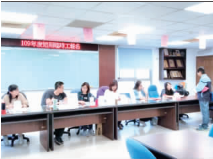
左、右：金門縣政府明(109)年將持續實施具有公法救助性質之短期臨時工計畫，提供三百個按日計酬之臨時工名額，報名作業昨日在金城鎮公所三樓受理。

記者李增汪／綜合報導 金門縣政府明(109)年將持續實施具有公法救助性質之短期臨時工計畫，提供三百個按日計酬之臨時工名額。報名作業昨日在金城鎮公所三樓受理，計有560人(一般47人、特定143人)報名。這項報名作業，今(十八)日上午九時至中午十二時，續在金城鎮公所三樓受理。