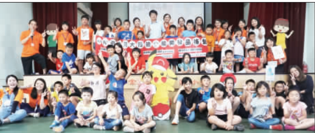
上、下：臺北市立大學崇德社連續4年攜手述美推品格營，透過營隊方式以趣味遊戲和體驗，帶領學子學習「五心」品格，並引導學童將孝等品格落實於生活中，用行動向父母及家人表達感謝。