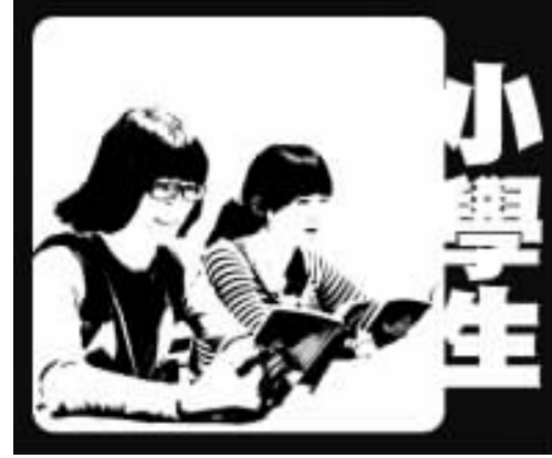
小學生投稿信箱 primary.kmdn@gmail.com, 來稿請以word格式, 並書明學校、姓名、班級。