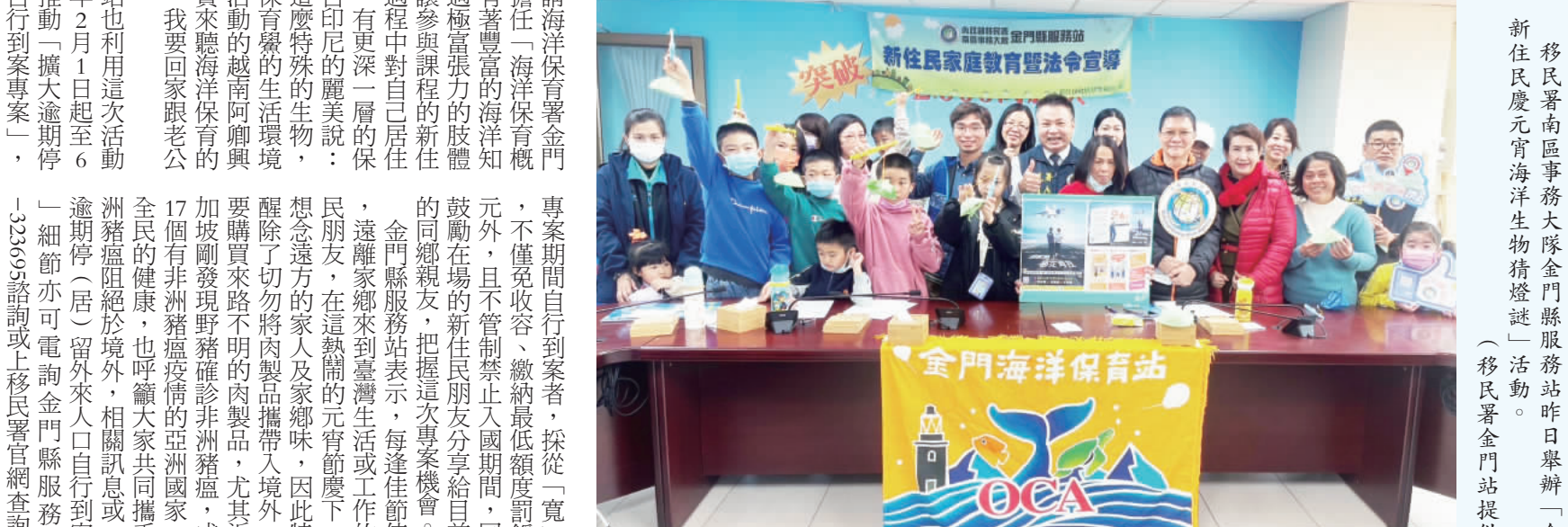
移民署南區事務大隊金門縣服務站昨日舉辦「金門新住民元宵猜燈謎」活動。

記者陳冠霖／金城報導 元宵節是我國重要的傳統節慶，除了吃湯圓、看花燈外，最有趣的就屬猜燈謎。雖然元宵節剛過，但為了讓居住在新住民的新住民朋友體會元宵節的歡樂，移民署南區事務大隊金門縣服務站結合金門縣服務隊與海洋保育署金門工作站，昨(19)日在水頭港區旅客服務中心舉辦「金門新住民元宵猜燈謎」活動。