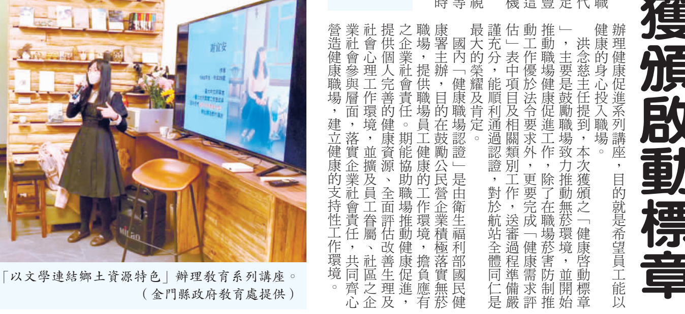
金門縣政府教育處「以文學連結鄉土資源特色」辦理教育系列講座...