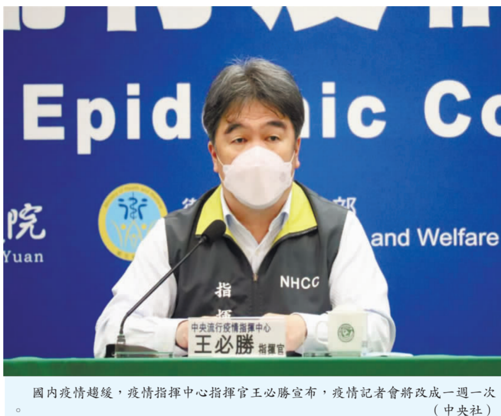
國內疫情趨緩，疫情指揮中心指揮官王必勝宣布，疫情記者會將改成一週一次

國內COVID-19疫情趨緩，中央流行疫情指揮中心指揮官王必勝表示，因疫情趨緩，記者會將改成一週一次，詳細擬定隔離方式；另外將討論調整確診隔離方式及通報定義，最快3月上路。 指揮官王必勝，日前新增16萬例COVID-19(2019)冠狀病毒疾病)本土病例，是連續13天較上週同期下降。王必勝在記者會中表示，因疫情趨緩，記者會將改成一週一次，詳細擬定隔離方式；另外將討論調整確診隔離方式及通報定義，最快3月上路。 各界關注COVID-19從第五類傳染病降為第四類可能性，王必勝表示，降類是最後措施，將優先處理確診者隔離方式調整，以及通報定義改變，與專家討論之後會盡快實施，當然前提是國內疫情穩定，3月實施比較有可能。 至於校園室內口罩禁令將於3月6日放寬，有家長擔心以後學生在教室戴口罩恐遭霸凌。王必勝表示，這部分由教育部與地方教育當局協調，在指揮部與各地則下，各校因地制宜都尊重；過去經驗來看，亞洲不會有這種霸凌問題。