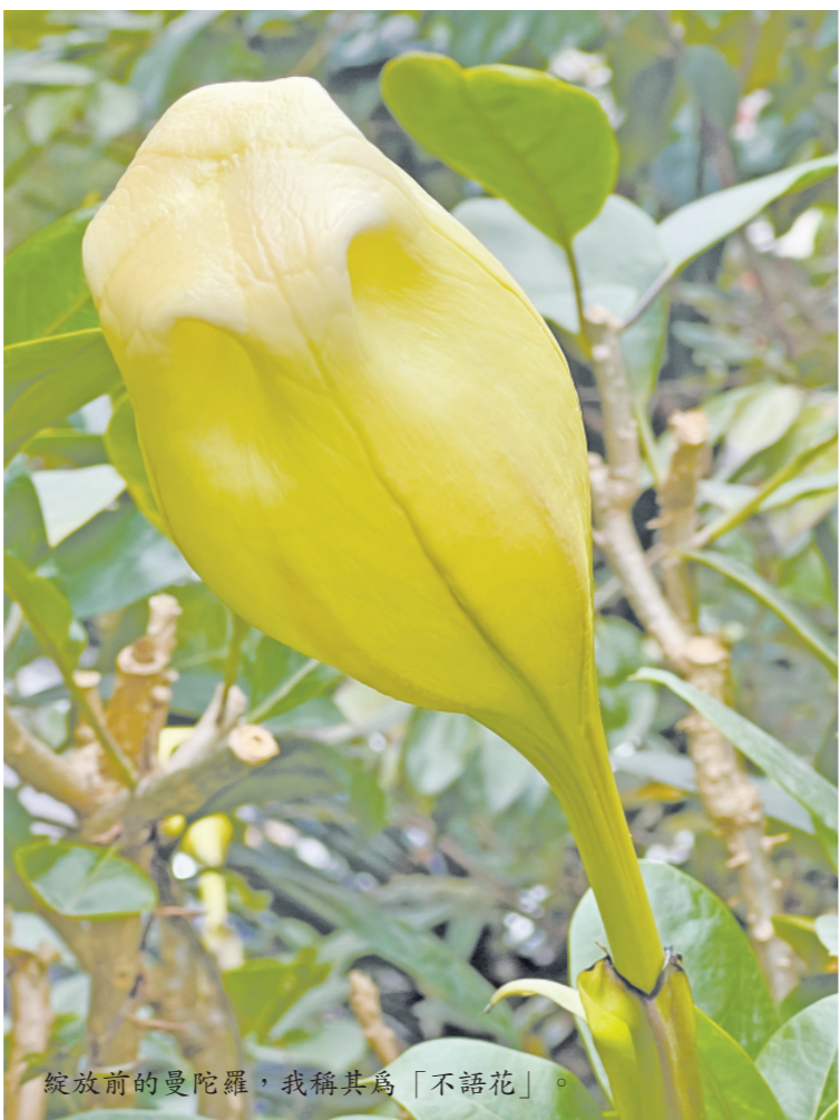
綻放前的曼陀羅，我稱其為「不語花」。

此花偶有所遇，總覺得她是花族的異類，除了她的名，還有她不語的形態。 在去川西的崎嶇山路上，看見她大放異彩，驚為天人，那可是三千多公尺的高原耶。她與仙人掌為伍，從熱帶沙漠到熱帶雨林，讓人誤以為她是平地「嬌娃」。 直到我在海拔三千多公尺的香格里拉看到沿陡峭山壁叢生的仙人掌和她，還在藏人導遊的慫恿下吃到多刺卻甜美的仙人掌果，當下很篤定，屬於仙人掌的荒原，同樣是她的家園。