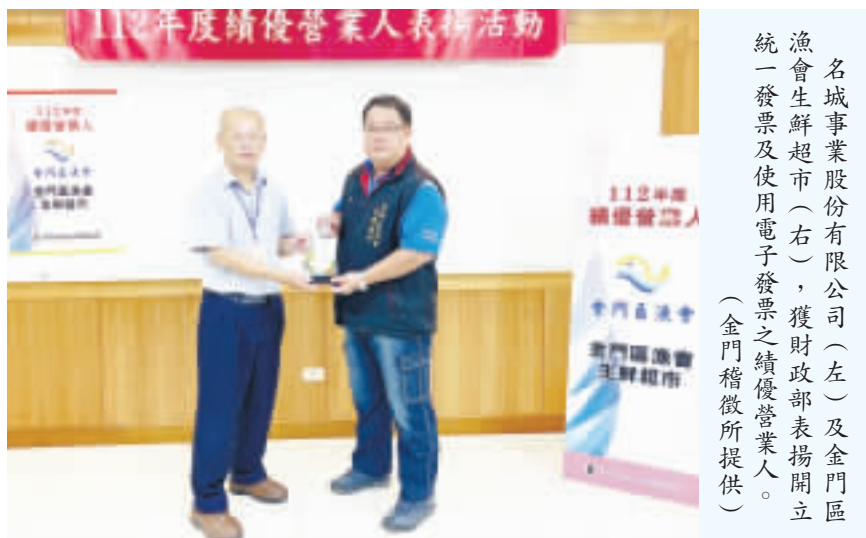
名城事業股份有限公司(左)及金門區漁會生鮮超市(右)，獲財政部頒發績優營業人一發票及電子發票之績優營業人。