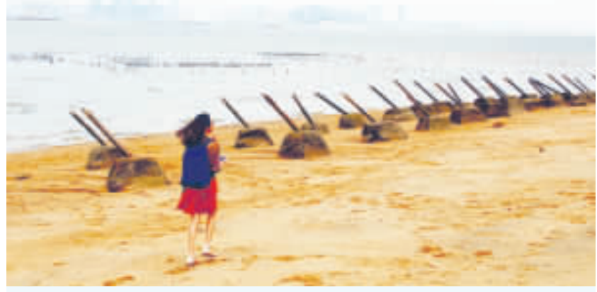
金門是論述「戰爭與和平」的最佳場域，圖為遊客悠閒走在矗立反登陸「鐵條岩」的小金門海灘。