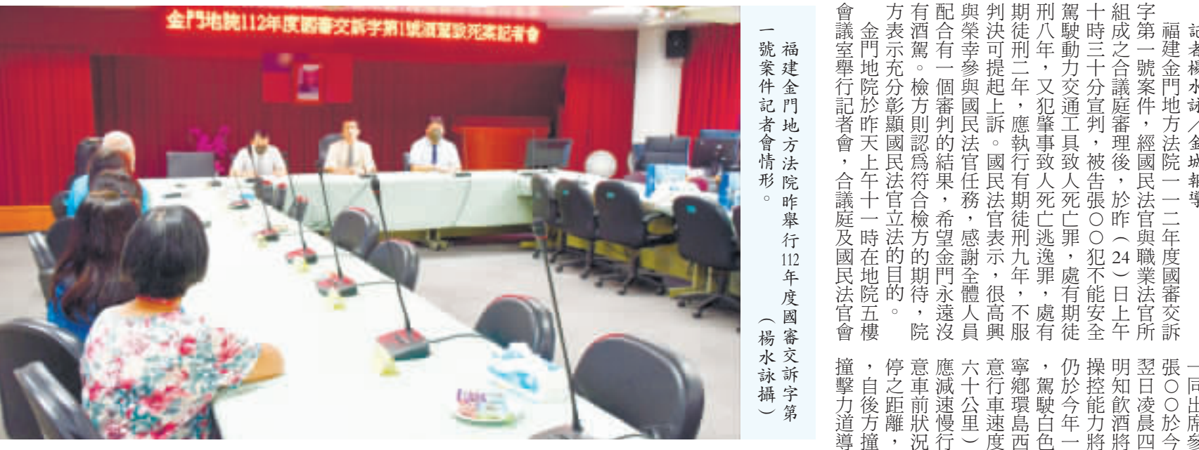
福建金門地方法院昨日舉行112年度國審文新字第1號酒駕致死案宣判記者會。

記者楊水冰／金城報導 福建金門地方法院一〇二年度國審文新字第1號案件，經國民法官與職業法官所組成之合議庭審理後，於昨(24)日上午十時三十分宣判，被告張○○犯有安全駕駛動力交通工具致人死亡罪，處有期徒刑八年，又犯肇事致人死亡逃逸罪，處有期徒刑二年，應執行有期徒刑九年，不服判決得提起上訴。國民法官表示，很高興與榮幸參與國民法官任務，感謝全體人員配合有一個審判的結果，希望金門永遠沒有酒駕。檢方則認為符合檢方的期待，院方表示充分彰顯國民法官立法的目的。 金門地院於昨日上午十一時在該院五樓會議室舉行記者會，台議庭及國民法官會一同出席參加，說明該案判決事實理由：張○○於今年一月十一日晚間十一時許至翌日凌晨四時許，分別於兩處飲用酒類，明知飲酒將導致注意力、判斷力、反應與操控能力將顯著降低，不應於飲酒後駕駛動力交通工具致人死亡罪，處有期徒刑八年，又犯肇事致人死亡逃逸罪，處有期徒刑二年，應執行有期徒刑九年，不服判決得提起上訴。國民法官表示，很高興與榮幸參與國民法官任務，感謝全體人員配合有一個審判的結果，希望金門永遠沒有酒駕。檢方則認為符合檢方的期待，院方表示充分彰顯國民法官立法的目的。