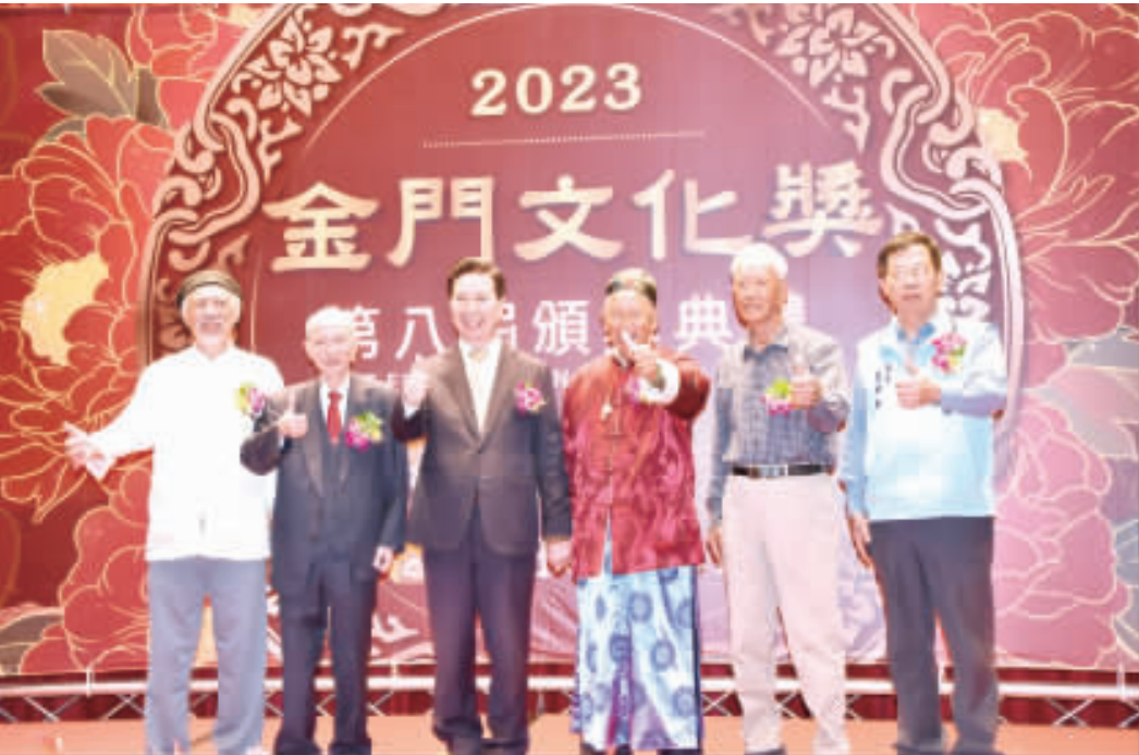
第8屆「金門文化獎」頒獎典禮昨日上午舉行，縣長陳福海親自頒發獎券各獲獎者，並和歷屆文化獎得主和貴賓合影留念。

前文化部長陳水扁在說的一句話「金門拋開了文化，還剩下什麼？」文化是一切的根本，尤其在金門，「我在局長8年前就任第一屆局長當天，就期許局長，要把文化局長的視野、格局拉高到文化局長的高度，要有一天當兩天用的拚勁，這個期許至今未變。 他說，他最懷念老縣長陳水在說的一句話「金門拋開了文化，還剩下什麼？」文化是一切的根本，尤其在金門，「我在局長8年前就任第一屆局長當天，就期許局長，要把文化局長的視野、格局拉高到文化局長的高度，要有一天當兩天用的拚勁，這個期許至今未變。 前文化部長陳水扁在說的一句話「金門拋開了文化，還剩下什麼？」文化是一切的根本，尤其在金門，「我在局長8年前就任第一屆局長當天，就期許局長，要把文化局長的視野、格局拉高到文化局長的高度，要有一天當兩天用的拚勁，這個期許至今未變。 前文化部長陳水扁在說的一句話「金門拋開了文化，還剩下什麼？」文化是一切的根本，尤其在金門，「我在局長8年前就任第一屆局長當天，就期許局長，要把文化局長的視野、格局拉高到文化局長的高度，要有一天當兩天用的拚勁，這個期許至今未變。