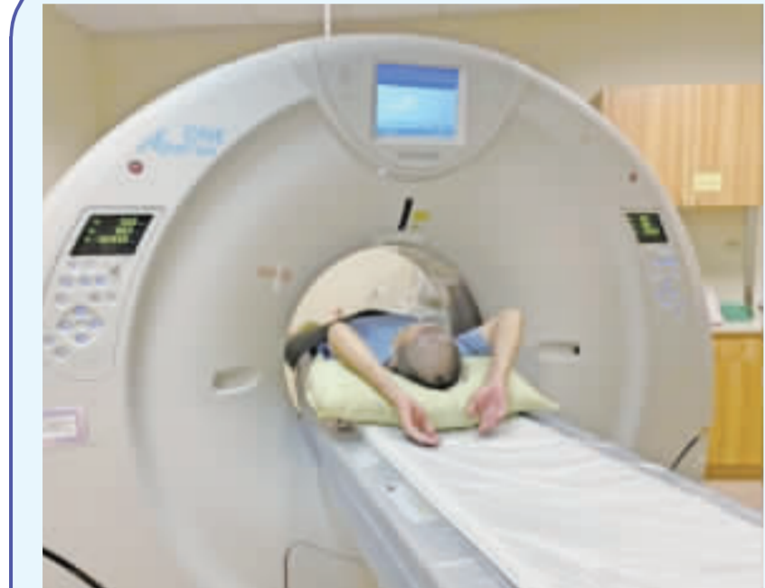
高市證明肺癌篩檢有效 早發現早治療 國健署自民國111年7月推動肺癌篩檢服務，提供符合篩檢資格民眾低劑量電腦斷層掃描(LDCT)，高雄市迄今已有超過1萬2000人接受篩檢，其中確診肺癌者為早期比例超過7成，證實肺癌篩檢有助早期發現。(中央社)

據統計，台灣每6名孕婦就有1人貧血，國健署建議孕媽咪善用貧血檢驗，掌握攝取富含鐵質食物、葉酸補充、維生素B12很重要及蛋白質攝取增加等飲食技巧，遠離孕媽咪貧血風險。 衛生福利部國民健康署10至11年「國民營養健康狀況變遷調查」結果發現，20至49歲育齡婦女貧血盛行率為5.7%，10年7月1日至12年6月30日孕婦產檢資料統計中，懷孕第24至28週接受產檢貧血檢驗超過26萬人次，異常率約1.5%，大約每6名孕媽咪就有1位有貧血現象。 國健署長吳昭昇近日特別透過新聞稿提醒，懷孕孕媽咪需要更注意孕早期飲食攝取，避免血色素低於標準值，出現所謂「孕媽咪貧血」現象。自10年7月1日起國民健康署提供於妊娠第24至28週貧血檢驗服務，希望所有孕媽咪都能善加利用，以早期發現及早治療。 國健署提醒，孕早期貧血影響母嬰健康，造成貧血的原因主要有遺傳、疾病或營養素攝取不足，若懷孕第12週前的產檢血液常規檢驗時發現貧血，建議就醫釐清貧血是先天遺傳性或營養素缺乏等因素，若產前貧血將增加產前、生產及產後妊娠併發症與胎兒健康危害的風險，孕媽咪避免孕早期貧血飲食技巧並不難。 第1是攝取富含鐵質的食物，經由攝取內臟類，如豬肝、鴨血、紅肉類、海產類，如蛤蜊、章魚及豆類與其製品，如黑豆、小方豆可補充鐵質。另外，於用餐中或餐後2小時內食用富含維生素C的水果，如芭樂、柑橘、文旦、小番茄，則可以促進鐵質吸收。 第2是葉酸補充不可少，建議孕婦每天至少需攝取1至2碗深綠色蔬菜，如菠菜、紅苜蓿、紅鳳菜等，可全穀雜糧如紅豆、綠豆、鷹嘴豆、燕麥、紅藜等搭配入菜。另外，堅果類食物，如瓜子、黑芝麻、及蛋白質類食物中的海鮮類，如鱈魚、牡蠣或雞肝、黃豆、黑豆等，也富含葉酸。 第3是維生素B12很重要，國健署表示，維生素B12主要食物來源為動物性蛋白質，包含海鮮類，如蝦子、文蛤、牡蠣或肉類、蛋、乳製品等，孕婦也可食用紫菜、海髮菜來補充；至於全素者，建議在醫生指導下，使用維生素B12補充劑。 第4是蛋白質攝取需增加，國健署提醒，攝取充足的蛋白質，可提供足夠的造血元素。懷孕期間蛋白質每天攝取量需額外增加10公克，建議蛋白質來源中一半以上應來自優質蛋白質，如黃豆、毛豆、黑豆與相關製品，或乳製品、魚、蛋、肉等。