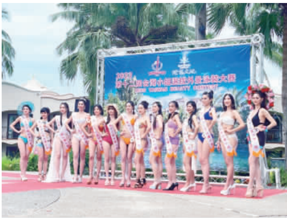
台灣小姐選拔外景泳裝賽登場 第12屆台灣小姐選拔外景泳裝大賽登場，花蓮知名度假飯店泳池畔22日下午聚集14名泳裝美女，各自換上特色泳裝，展現姣好身姿。(中央社)

活動新聞稿指出，此次訴求包含：應訂定合理人力政策與法制規範，補足醫療人力，改善醫療人員過勞問題，打破人力不足導致排班不穩、需跨科支援，引發更多人離職的惡性循環；應將醫療人員薪資整合計算，避免薪資浮動；要求健保會納入1席由醫療工會推派的醫療勞工代表等。