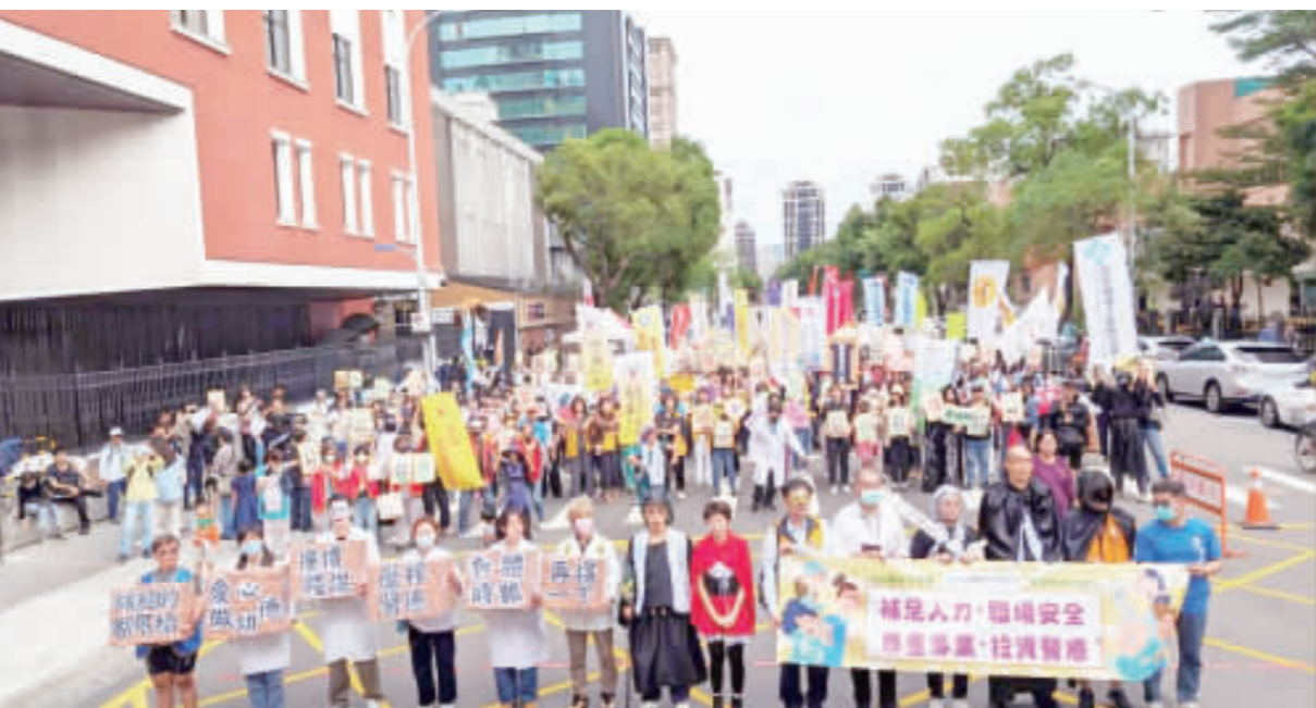
近500名第一線醫療人員22日在台北參與「地獄職場嘉年華，醫療勞權大遊行」，以變裝方式比喻醫療人員「累到變成鬼」，諷刺醫療勞動環境現況。(中央社)

【中央社記者曾以寧台北22日電】近500名一線醫療人員今天上街爭取勞權，提出人力補不足、安全職場不煩惱、尊重專業提升待遇、政府投資救護保4大訴求，並以變裝方式比喻醫療人員「累到變成鬼」。