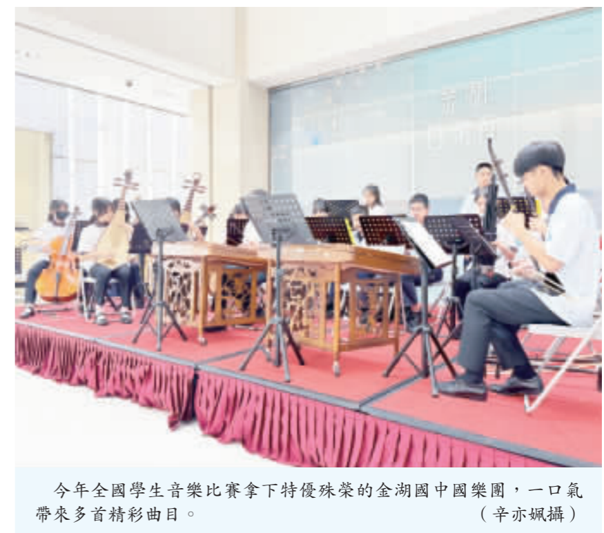
今年全國學生音樂比賽拿下特優殊榮的金湖鎮國樂團，一口氣帶來多首精彩曲目。

記者高凡洋／綜合報導 金湖鎮國樂團在日前舉行的國樂盛會上，展現了精湛的演奏技巧。樂團成員表示，他們非常榮幸能參與這次活動，並希望通過音樂傳遞中華文化的魅力。此外，金湖鎮還舉辦了多場國樂講座，讓更多人了解國樂的歷史和發展。