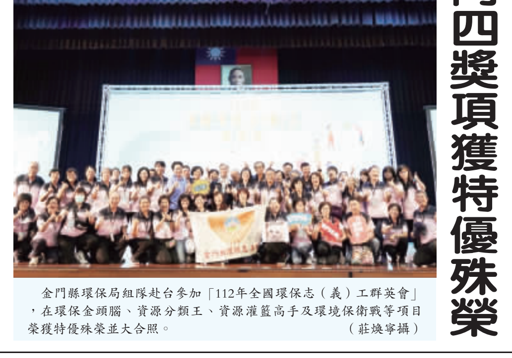
金門縣環保局組隊赴台參加「112年全國環保志(義)工群英會」，在環保工頭腦、資源分類王、資源滙整高手及環境保衛戰等項目榮獲特優殊榮並大合照。

1999縣民服務熱線 明暫停服務一天 記者莊煥寧／縣府報導 金門縣政府1999縣民服務熱線，為進行例行維護作業，將於10月31日(星期二)暫停服務一天，若相關業務提早完成，將儘速恢復服務，屆時親親若有緊急需求，請撥打：報案電話110，或救災專線119，或救災專線119，或救災專線119，或救災專線119。