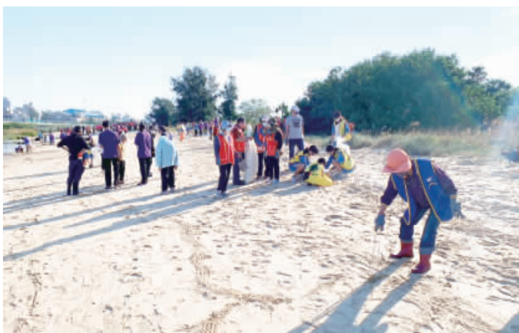
金城鎮昨日舉辦秋季淨灘，500多位志工共同參加。