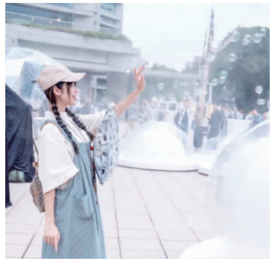
你做了什麼顏色的白日夢 台灣團隊「穀米機工」裝置藝術作品「你做了什麼顏色的白日夢」榮獲2023台北文創新意節潛力新銳組優選，民眾只要在相關網頁輸入夢想或願望，就能將心願化為具體色彩、煙霧或五彩泡泡呈現。 （文：中央社）

【中央社東京29日綜合外電報導】日本觀光業逐漸從疫情打擊中復甦，但隨之而來卻是嚴重的人手不足問題。箱根旅館業者表示，為了留住員工，他們採取了反常態經營方式。 箱根旅館業者表示，為了留住員工，他們採取了反常態經營方式。他們提供員工更多的福利和保障，甚至允許員工在旅館內長期居住。此外，他們還加強了員工培訓，提高員工的專業技能和服務水平。 然而，這種反常態經營方式並不能從根本上解決人手不足的問題。由於旅遊業的復甦，旅館的業務量大幅增加，對員工的需求也隨之增加。許多員工在旅館工作一段時間後，便選擇了其他行業或地區。 日本政府也意識到了這一問題，並採取了多項措施來緩解人手不足的情況。這些措施包括提供培訓補貼、提高最低工資等。然而，這些措施的效果尚不明朗。