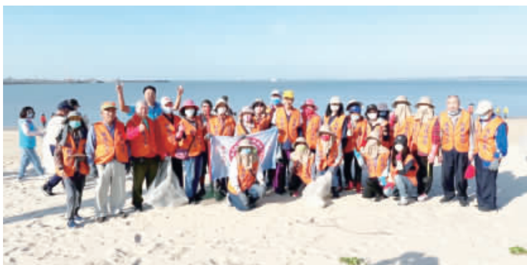
金湖鎮公所29日上午8點在料羅海濱公園，實施秋季海漂垃圾清除淨灘活動。