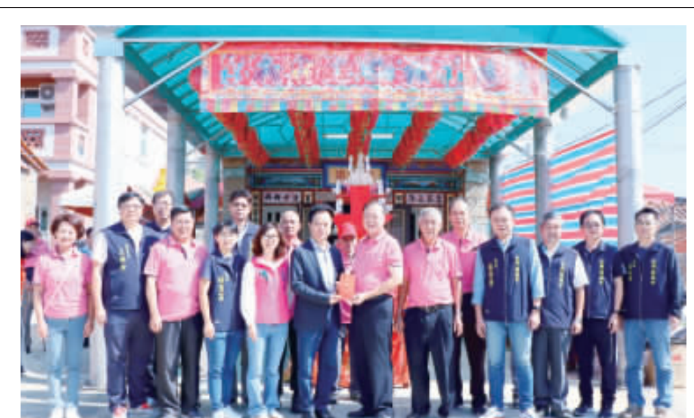
縣議會昭靈宮上香。

昨日參與的社區及機關包括：金城鎮民代表會、金防部、第九岸巡隊、金城國中、北門社區發展協會、庵前社區發展協會、吳厝社區發展協會、賢聚社區發展協會、向陽吉第社區發展協會、夏墅社區發展協會、後豐港社區發展協會、前水頭社區發展協會、金門城社區發展協會、燕南山社區發展協會、官裡社區發展協會、東沙社區發展協會、鳳翔新莊社區發展協會、西門社區發展協會、東門社區發展協會、小西門社區發展協會、和平社區發展協會。