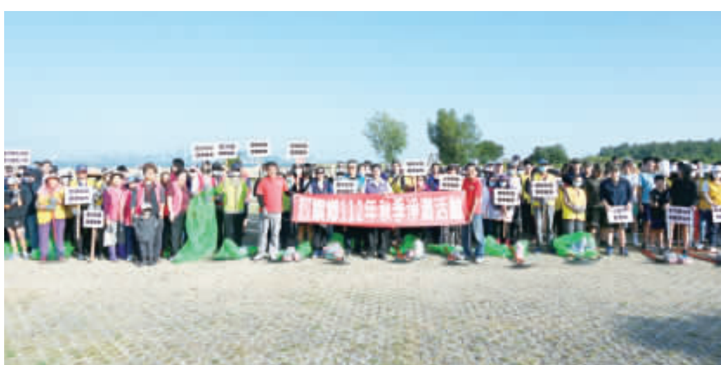
烈嶼鄉112年秋季淨灘活動，昨日上午在上林海灘展開，鄉公所結合社區單位參與淨灘。

金寧鄉清理成效卓著 記者高凡淳／金寧報導 為提供民眾更優質的海岸休閒環境品質，響應「金秋環境季」，金門縣政府與五鄉鎮公所昨(29)日聯合舉行112年度秋季淨灘活動，廣邀各鄉鎮的機關、社區團體投入淨灘活動，以實際行動守護海洋環境，讓海洋環境保護的永續觀念能獲得更大迴響，使海洋能永續維持原有風貌。