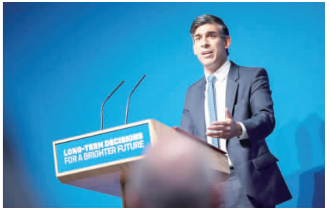
英國11月1至2日舉行全球首屆人工智慧(AI)安全峰會，共有27個國家政府代表與會。圖為首相蘇納克10月26日在英國皇家學會演說，預告峰會欲達成目標及英國將設立全球第一所「AI安全研究院」。

美中峰會在即 美國務卿布林肯8日將訪韓 【中央社記者廖禹揚台北一日專電】美國白宮證實總統拜登將在11月中旬APEC峰會場與中國國家主席習近平會面，南韓外交部今天也公布美國國務卿布林肯將在8日至9日訪韓消息，外界推測可能討論美中峰會相關議題。 布林肯(Antony Blinken)預計出訪7日至8日在日本東京舉行的七大工業國集團(G7)外長會議，8日會議結束後將直接前往韓國，9日上午與外長朴振會談，預期討論美韓同盟、北韓核問題、經濟安保、尖端技術合作及各種區域、國際議題。 這次是布林肯於南韓總統尹錫悅上任後首次訪韓，距離上次訪問已逾兩年。布林肯上次訪韓是2021年3月於文在寅政府任內，當時在首爾舉行韓美外交部長與國防部長2+2會議。 拜登(Joe Biden)預期將在11月中旬亞太經濟合作會議(APEC)領袖峰會場與習近平會面，可成為美中關係的轉捩點並對東北亞區域局勢造成影響；布林肯這次訪韓時間點正巧落在峰會前，格外受到媒體關注。 外界推測，布林肯這次訪韓可能就美中峰會內容交換意見和尋求合作，並討論近期引發關注的朝俄合作、以哈戰火、烏克蘭戰爭等重要區域、國際議題。 此外，不久之前俄羅斯外長拉夫羅夫(Lavrov)訪問北韓，與北韓領導人金正恩及外交部長崔善姬會面，表明進一步合作立場，尤其在軍事上可能達成合作關係被美日韓陣營視為區域穩定的一大風險，布林肯這次訪韓可能也代表一種立場宣示。 南韓外交部表示，期待布林肯這次訪韓，能為今年迎來70週年韓美同盟關係帶來更多具國際戰略合作發展。