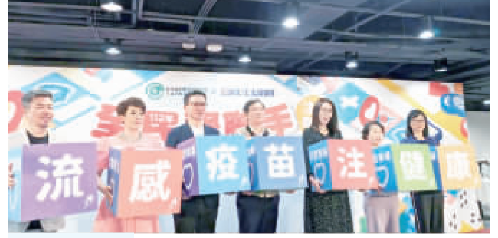
公費流感疫苗第2階段開打，對象為50至64歲無高風險慢性病人，衛生福利部疾病管制署與全聯福利中心在全聯南港旗店舉辦記者會...

【中央社記者曾以寧台北一日電】公費流感疫苗第2階段開打，50到64歲可接種。衛福部疾病管制署長莊人祥說，受到免疫負債影響，今年全年都在流行流感，尤其近幾個月疫苗預約高，呼籲民眾盡快接種。 公費流感疫苗第2階段開打，對象為50至64歲無高風險慢性病人，衛生福利部疾病管制署與全聯福利中心在全聯南港旗店舉辦記者會，藝人夫妻檔黃國倫、寇乃馨擔任防疫大使。 莊人祥致詞表示，受到免疫負債影響，今年全年都在流行流感，尤其近幾個月疫苗預約高，呼籲民眾盡快接種。 公費流感疫苗第2階段開打，對象為50至64歲無高風險慢性病人，衛生福利部疾病管制署與全聯福利中心在全聯南港旗店舉辦記者會，藝人夫妻檔黃國倫、寇乃馨擔任防疫大使。 莊人祥致詞表示，受到免疫負債影響，今年全年都在流行流感，尤其近幾個月疫苗預約高，呼籲民眾盡快接種。