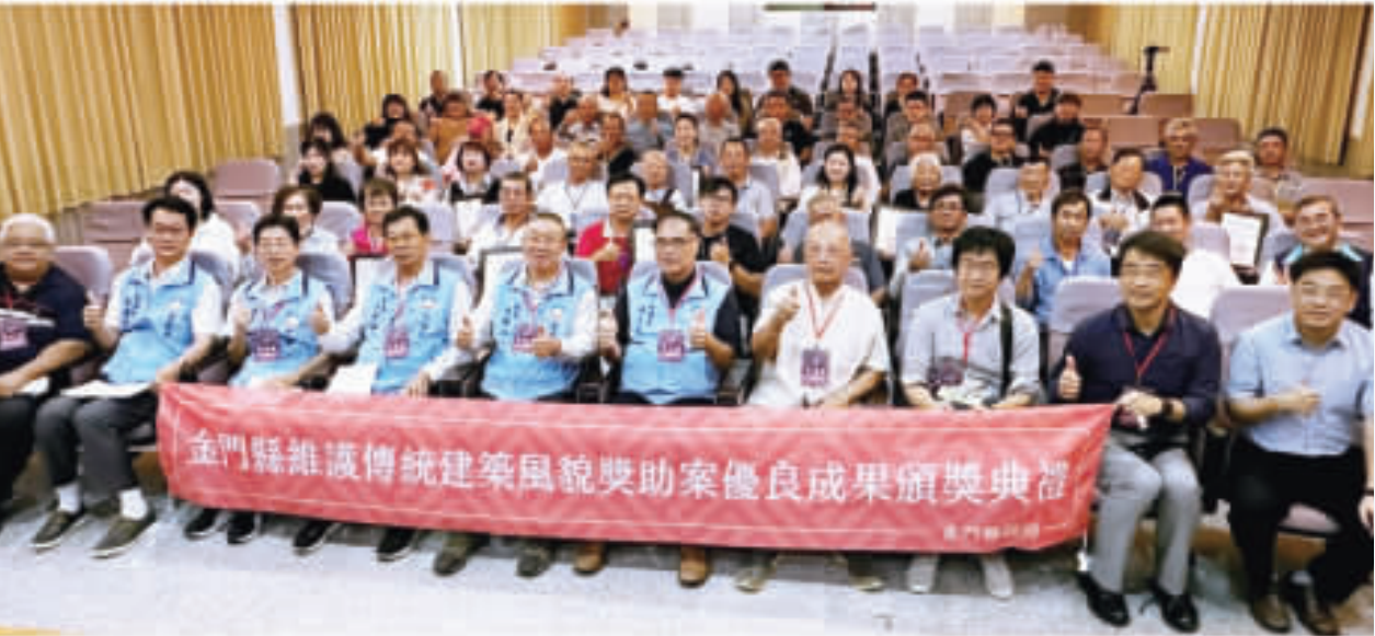
上、金門縣政府舉辦「金門縣維護傳統建築風貌獎助案優良成果頒獎典禮」。