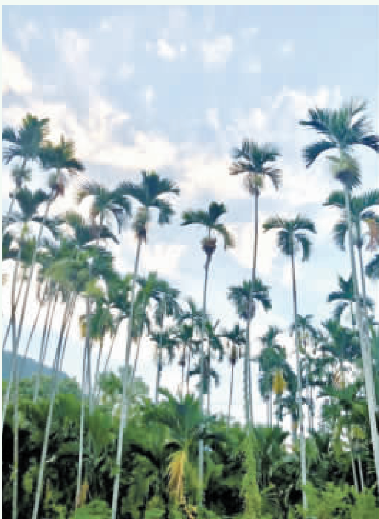
原民部落隨處可見的檳榔樹。

張著晶亮的眼，咧著嘴的笑容，零距離的朗聲招呼，我都忍不住當下一念，一願，願他們能好好念書，未來有好的發展，平安幸福。 抬頭看看檳榔樹，有沒有發現檳榔的樹幹與椰子樹很像？其實檳榔樹原產自馬來西亞，與椰子樹都屬於棕櫚科，是常綠喬木，可長到20公尺。檳榔攤常可看到「菁仔」，指的就是檳榔樹尚未加工的嫩果。 我跟檳榔樹一點也不熟，所知大概這麼多。 記得以前剛到此地時，中午出門訪友，回來用導航，眼看著怎麼有好多大魯閣族的圖騰，荒僻窄小的路徑，安靜到彷彿只剩風聲的檳榔樹小鎮，當時已近一點半，也就是上班時間快到了，一邊開車，沿途不停的檳榔樹，使我覺得前路漫漫，忍不住邊開車對著手機裡導航「小姐」埋怨：「哈囉！我要回去，要回去啦！為什麼妳導航要導到山上的原住民部落？」心想這下子要迷路和遲到了，卻忽然看到附近熟悉的路近在眼前，真所謂「柳暗花明」。 新同仁就一起走那麼一回，某日忽告訴我「做到今天」，就離職了。 現在偶爾獨自漫步山林，看到椰子樹，都會想起家在高雄的那位新同仁（轉眼已是老朋友），也發現，其實走出辦公室，才幾步路，就能彎近原住民的家裡、學校、派出所，甚至村里辦公室了，這才發現原來我跟原住民這麼近？這是在家鄉難以想像的事啊……。