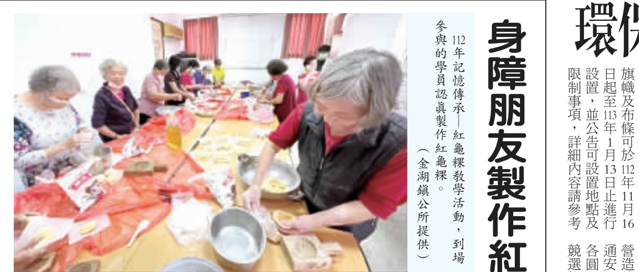
112年記憶傳承-紅龜粿教學活動，到場參與的學員認真製作紅龜粿。

記者陳冠霖／縣府報導 金門縣政府昨(1)日上午9時在縣府多媒體簡報室舉辦「金門縣維護傳統建築風貌獎助案優良成果頒獎典禮」，由副縣長李文良頒獎，表揚10年來在維護傳統建築風貌方面表現優異的獲獎案。共頒發特優獎2件、特優獎6件、優良獎15件、佳作獎12件。獲獎案均由民間團體或個人提出，經縣府遴選評選委員會評選出之。 獲獎案包括：金湖鎮新湖里新頭72號(特優獎)、金城鎮古城里大古崗14號(特優獎)、雙港大厝(特優獎)、申請人為董慶仁，設計單位為冠營造公司(負責人楊忠泰及匠師團隊)。該案多處構件與裝飾保存良好，修復過程採用舊材比率高，修復成果精良，值得肯定。另一獲特優獎位於金湖鎮新湖里新頭72號，建築形式一落四層樓，申請人為陳峰棋，設計單位為七號工作室，營造廠商為煥進土木包工業(負責人王天木及匠師團隊)。該案磚石材料保留完整，修復細節作工用心，風貌維護成果優秀，值得借鏡。 副縣長李文良表示，維護傳統建築風貌，是金門90年自治條例立法以來，縣府總計在傳統建築風貌維護工作上投入超過新台幣10億元的預算，並完成多達75棟傳統建築的整體維護工作，成績可說非常亮麗。他強調，20多年來，金門縣政府一直致力於保存和傳承地區富有特色的文化風俗和傳統建築，這些具體有形的文化成果是我們的根，是我們身分與認同的一部分，也是邁向未來的關鍵基石。李文良表示，本次特別頒發表揚民國107年 到110年期間被評為優良成果的維護傳統建築風貌獎助案。這些獲獎者不但是集結傳統建築持有者、設計單位與營造團隊多方的共同努力而獲得的成果，更是由縣府邀集相關領域的學者專家在數次現地勘查、彼此討論研商後所選出的代表性案。他們既達成了階段性成就，亦是金門文化延續與發展的重要助力。他相信這些在技術實踐、風貌維護成果上各有可觀的獲獎案將會成為日後金門傳統建築風貌維護的楷模，並且引領這項代表本縣文化與記憶的重要工程持續發展與前進，讓金門傳統建築風華再現。 縣府建設處表示，此一獎項設立之意旨係期望透過傳統建築風貌維護優良成果的評審與表揚，就本縣積極支持傳統建築風貌保存之建物所有人，以及堅持追求建築風貌維護與施作品質的設計、營造單位給予最直接的肯定。並期望能鼓勵更多傳統建築的持有者與此領域之從業人員與縣府攜手合作，共同推動傳統建築文化保存、維護領域中的標準地位得以更加凸顯。 建設處強調，金門縣政府多年來秉持維護本縣獨特文化風情、保存傳統價值觀的使命感，透過各種法制與政策工具，建立維護傳統建築風貌獎助申請機制，以鼓勵地方居民主動參與、支持此一重要理念。一方面期望能為金門地區的文化觀光創造更多的亮點，另一方面也能藉此提供設計單位、地方匠師、工程營造人員更多實際參與及發揮所學的機會，以強化本縣傳統建築修復專業技術人才的培養及傳承，使金門地區多樣而精彩的閩南建築和作為其底蘊的文化傳統得以綿延不斷、持續壯大。