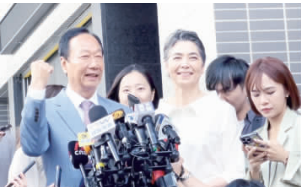
鴻海創辦人郭台銘(前左起)與副手賴佩霞、吳昇鴻台北一日電...

【中央社記者陳昱婷台北一日電】鴻海創辦人郭台銘與副手賴佩霞今天下午前往台北，遞交連署書，但並未公布遞交數量，但郭台銘表示，將會與賴佩霞繼續奮勇向前。 郭台銘遞交連署書後，在信義區行政中心前發表談話，他說，今天是非常重要日子，他來傳遞台灣人民追求民主自由的心聲，每份連署書對他都是一份責任及鞭策，他與賴佩霞會銘記在心，繼續奮勇向前。 至於遞交數量，郭台銘表示，競選會再說明，但他發現競選中華人民國總統的連署書上面，竟然沒有中華民國字樣，應盡快修改。 媒體追問是否有再與民眾黨總統參選人柯文哲會面、是否參選到底的日子，他來傳遞台灣人民追求民主自由的心聲，每份連署書對他都是一份責任及鞭策，他與賴佩霞會銘記在心，繼續奮勇向前。 郭台銘遞交連署書後，在信義區行政中心前發表談話，他說，今天是非常重要日子，他來傳遞台灣人民追求民主自由的心聲，每份連署書對他都是一份責任及鞭策，他與賴佩霞會銘記在心，繼續奮勇向前。