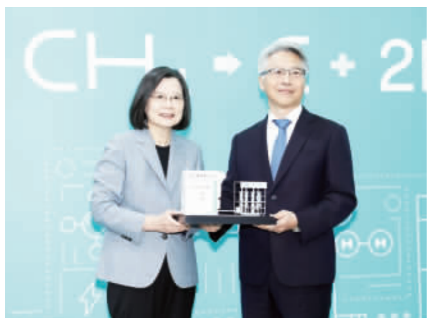
蔡總統今天上午在經濟部部長王美花及中研院院長廖俊智等人陪同下，出席中研院及台電「去碳燃氫發電技術發布會」，並於致詞後參觀去碳燃氫發電技術展示場。

蔡總統今天上午在經濟部部長王美花及中研院院長廖俊智等人陪同下，出席中研院及台電「去碳燃氫發電技術發布會」，並於致詞後參觀去碳燃氫發電技術展示場。 蔡總統致詞表示，2050淨零轉型是全世界的共識，也是台灣的目標。政