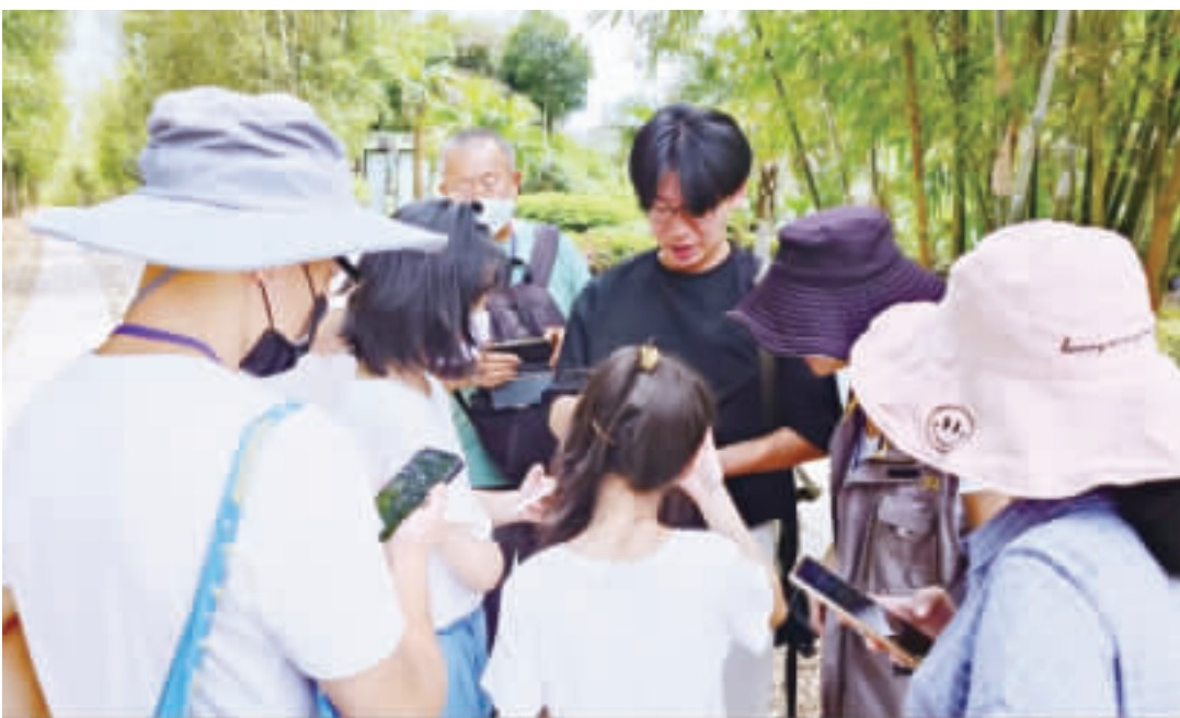
金門植物園今年首次舉辦「小島共學團」系列課程，帶領與會民眾學習成果製作成獨一無二的植物園旅遊手帳。

但真的開始之後，漸漸地體會到工作的樂趣，常有學員完全沉浸在自己的手工世界裡，忘記了時間。尤其看到自己壓製的植物壓花，每個人都驚嘆不已，竟然能做出那麼漂亮的壓花，並語帶懷疑地形容，「這真的是我做的嗎？」過程中，許多人從認為自己無法完成，到能運用創意搭配紙膠帶、將壓花、照片編排繪製成美麗的一幅畫，原來這都是一開始陌生的想像限制了我們的行動力。而首次舉辦的小島共學團，在學員的成果分享與讚揚聲中完美落幕。 金門植物園表示，感謝大家願意一同在植物園中探索學習，在這四個月的旅程中一起創造許多有趣的共同回憶。民眾若想要知道更多關於植物園的活動內容，歡迎傳送郵件至kkg0330@gmail.com，或於上班時間(周二至周日，上午9時至12時，下午2時至5時)電話082-332420。