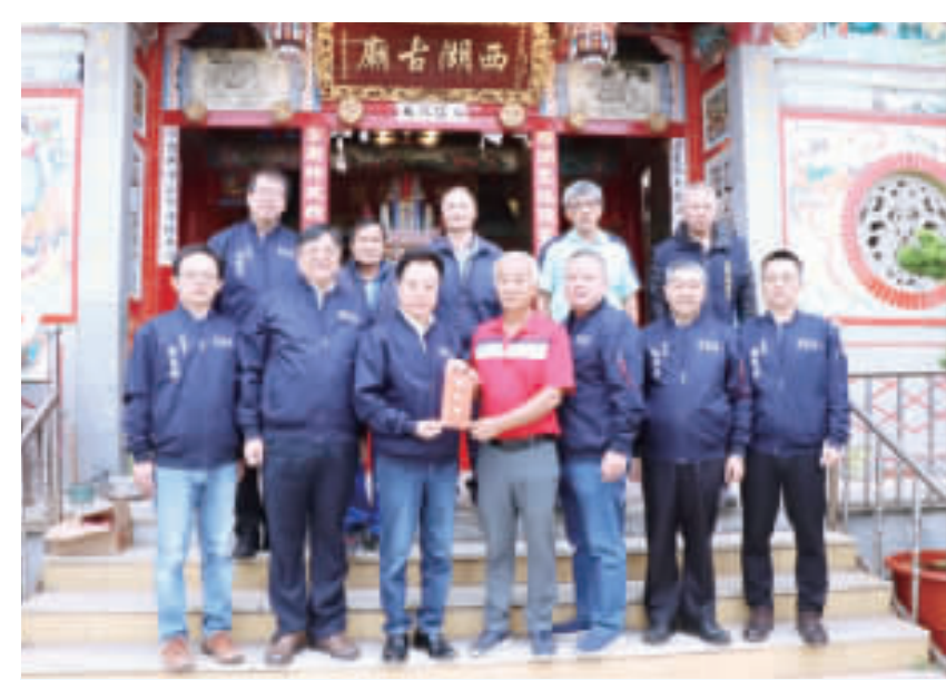
議長洪允典率議會人員至西湖古廟參拜祈福。

機構針對上述問題之改善情形，並與機構管理人員直接面對面溝通，希望機構管理人員與消防單位一起努力，為機構內的長者及身心障礙者提供最安全的環境。 消防局指出，此次在消防安檢人員的檢視下，日前查驗的前許多問題，如消防設備故障等，已經大多數完成了改善，只剩下部分消防安檢設備尚待廠商出貨即可完成修繕，而機構人員之防火應變能力，透過完善建立機構內防火區劃，讓機構人員可以透過疏散至鄰近區劃方式，大幅減少收容人員疏散至相對安全區之時間，以爭取消防人員介入救援之機會。在機構的走訪過程中，消防人員穿著一身鮮紅色的制服，機構住戶表現出極大的熱情，歡迎所有消防人員的到來。 局長呂英華表示，能長期投入在照顧長者及身心障礙者的工作人員，往往都是最具愛心與耐心的一群人，每個照顧者都是社會上的活菩薩，因為有這群人的存在，讓許多家庭可以獲得喘息，住民也能獲得最全面的照顧，期待大家能自願協助他人，能與消防人員一同注意自己工作環境的安全，未來消防局會持續與老福機構合作，讓機構人員學會保護自己和保護他人的能力，共建無災家園。