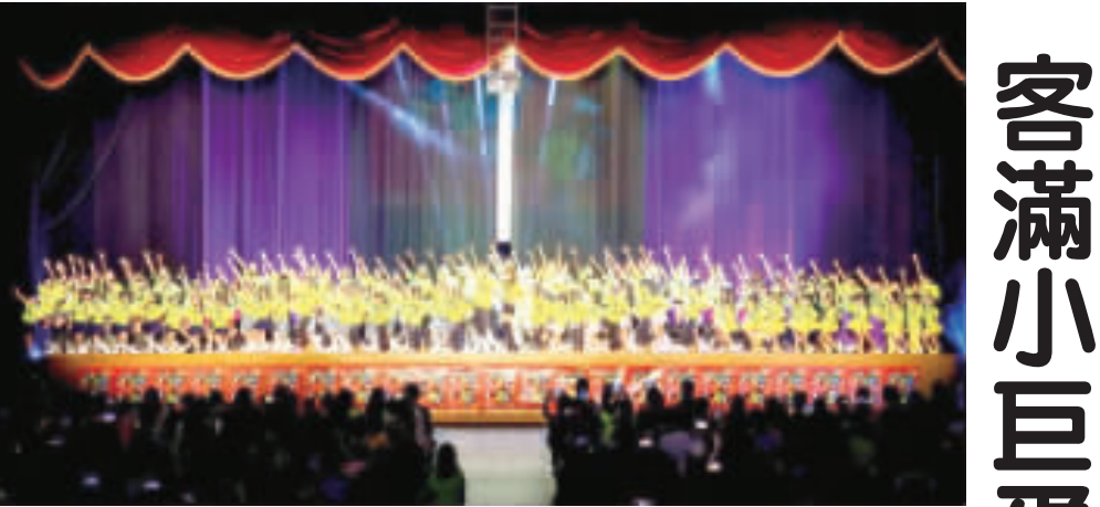
KDC金門流行舞蹈團舉辦第十一屆大型舞蹈公演，舞者大合影。

KDC表示，很感謝大家長期以來對於舞蹈的支持，已經列為每年必須要進劇場觀看的在地指標性藝文活動。因為前來觀看的民眾一年比一年多，以往在文化局演出時將近800個座位是供不應求，連走道都坐滿了熱情的民眾。今年由於文化局演藝廳進行整修工程，首度移師金湖鎮綜合體育館演出，場館可以提供更多的座位，看到現場大約250個位置都坐滿了人，真的很感謝大家願意走出家門，到現場支持在地藝術創作。