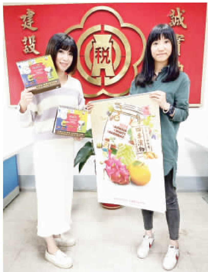
稅務局正辦理捐發票兌水果月曆及三角桌曆活動。