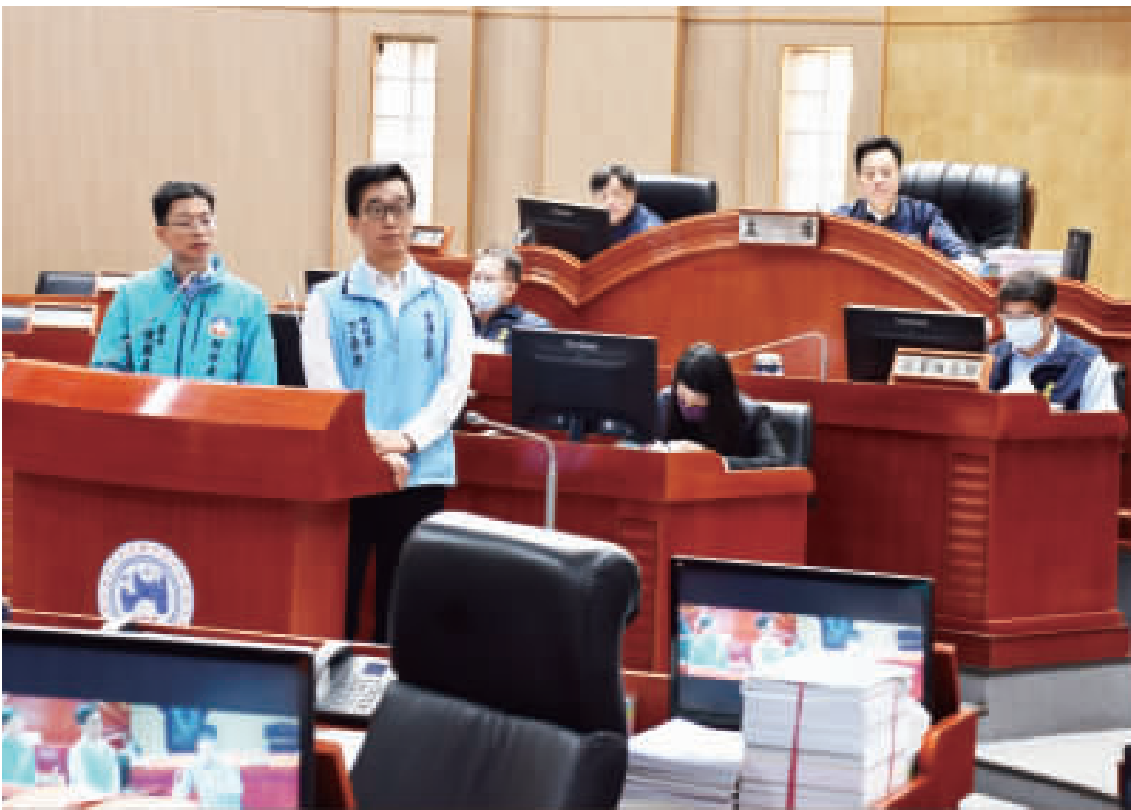
金門縣議長洪允典昨主持議會定期會第九會次議程。