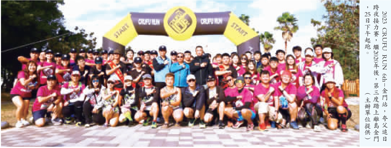
2023 GRUHU RUN 6th-金門站，夸父追日跨夜接力賽，繼2020年後，第三次踏上離島金門，25日下午起跑。

蓋金沙鎮、金湖鎮、金城鎮、金寧鄉、烈嶼鄉，在金門縣政府相關單位協助下，今年活動更加熱鬧；主辦單位邀集金門在地各大伴手禮成為「追日」的夥伴，如「聖祖貢糖」、「金太丈一條棍」及連續三屆為大會租車夥伴並提供夸父跑友租車優惠的「冠城租車」，也讓選手有賓至如歸的感受。