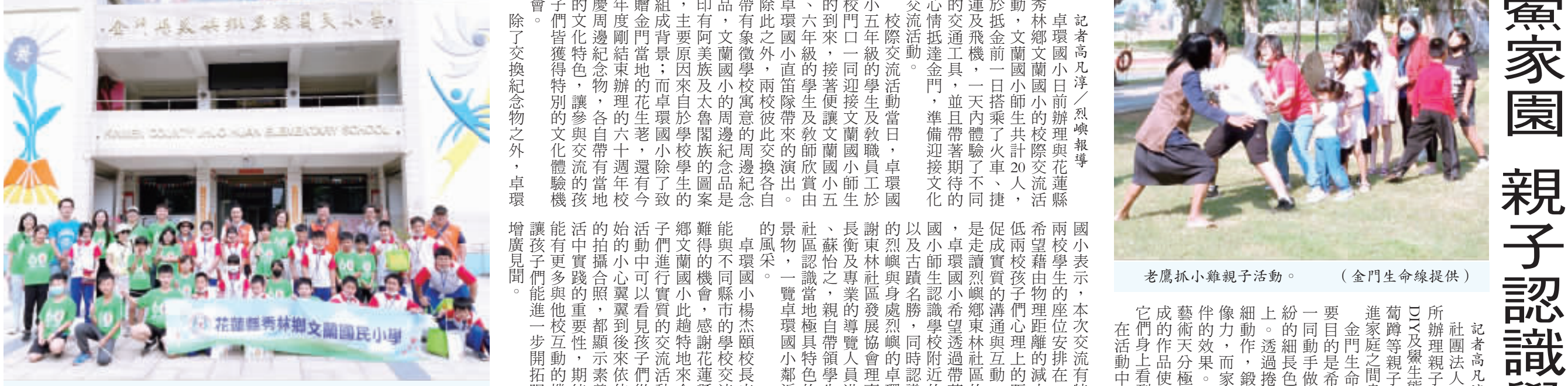
卓環國小與花蓮縣秀林鄉文蘭國小進行校際交流活動。

卓環國小日前辦理與花蓮縣秀林鄉文蘭國小的校際交流活動，文蘭國小師生共計20人，於抵金前一搭乘了火車，抵達卓環後，與卓環師生進行了不同形式的交流活動，並且帶著期待的心情抵達金門，準備迎接文化交流活動。 校際交流活動當日，卓環國小五年級的學生及教職員工於校門口一同迎接文蘭國小師生的到來，接著便讓文蘭國小五年級、六年級的學生及教師欣賞卓環國小的直落仔寮文化園林。卓環國小直落仔寮文化園林除了有象徵學校精神的周紀念品、阿美族及太魯閣族的圖案，主要原則來自於學校學生的組成背景；而卓環國小除了精緻的園林，更在園林中融入了許多在地文化特色，讓參與交流的孩子們獲得特別的文化體驗機會。除了交換紀念物之外，卓環國小與文蘭國小的師生們，在兩校學生的座位安排在一起，希望藉由物理距離的減少，減低兩校學生心理上的距離，促成實質的溝通與互動。