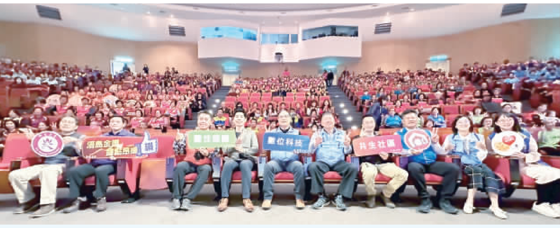
縣府舉辦社區照顧關懷據點成果展暨績優表揚。