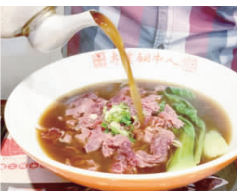
現沖牛肉麵。

記者林靈／專訪報導 一碗牛肉麵看似簡單，卻需要很多輔料，包括新鮮的食材、耐心，以及充沛傾注的情感，肉香而不膩、湯鮮味美、麵條筋道，各司其職的構成了一碗令人流連忘返的牛肉麵，勾得人食指大動。 一碗碗熱氣騰騰的牛肉麵，無論清燉或紅燒，講究做法與配料，仔細掌握火候，每一絲理步都至關重要，絲毫不馬虎，又著感人的故事，更有著鄉愁的寄託，還有記憶版圖的重建，這一碗視與味覺的雙重誘惑，不僅是一種難以忘懷的美食情結，亦是一種醇厚鮮香的舌尖體驗。 在地牛肉料理店家如榕榕園麵館、金伴餐廳、康坤牛肉店、金橙牛肉麵、喜相逢小吃店、談天樓、老爹牛肉麵、高坑牛肉食樂苑、張記牛肉麵館、真善美牛肉麵、五哥牛肉麵、金門第一味牛肉麵、中壢新永明川牛肉麵、牛二爺酒糟全牛海鮮料理館、金門牛家莊、高安牧場、圓頭農牧食品有限公司、良金牧場等，口味各有千秋，無不料足味美，知音擁躉者不少。 一碗落胃又舒心的牛肉麵，融合了此岸與彼岸，集匯了權宜與恆存，含括著昔年風味，一部分就地取材，味濃香口，每一碗肉料都令人心花怒放。牛肉麵以外，各種牛肉料理、各式周邊商品，在漫時光中生長、變化、開枝散葉，面貌多元，百花齊放，百家爭鳴，樣樣俱全，處處蘊含深刻的用心，可一人獨享，也可三五好友共嚐，自用送禮皆適宜。