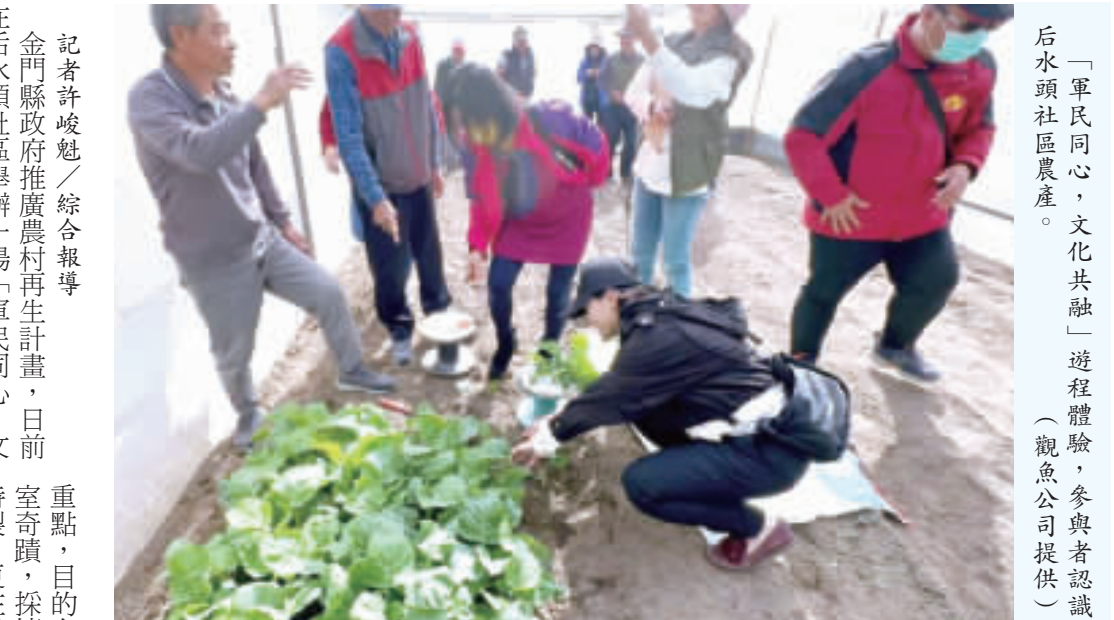
「軍民同心，文化共融」遊程體驗，參與者認識后水頭社區農產。

金門縣政府推廣農村再生計畫，日前在后水頭社區舉辦一場「軍民同心，文化共融」爲主題的軍民同心遊程體驗活動，把社區的戰地文化、傳統閩式建築、當地美食相互融合，同時結合食農教育，把后水頭的獨特魅力呈現給參與者。 農村再生計畫是由農業部農村發展及水土保持署指導，金門縣政府主辦，並由觀魚有限公司協助輔導后水頭社區發展協會進行計畫的執行。