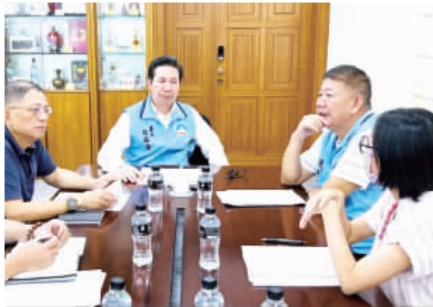
縣長陳福海強調，所有法規修訂與執行，都會經過各局處審慎的商討研議，向鄉親保證任內65歲年金「福利不縮水」。

記者陳冠霖／縣府報導 近日縣府基於整體財政紀律與社會福利資源整合配置的永續發展，於金門縣議會定期會提案「金門縣歷屆地軍管時期老人慰助金自治條例」修正案。有諸多鄉親關切該案的發展與內容，縣長陳福海特別強調，所有法規修訂與執行，都會經過各局處審慎的商討研議，向鄉親保證任內65歲年金「福利不縮水」。