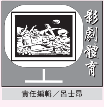
責任編輯 / 呂士昂

「永遠的東方不敗」林青霞獲頒第60屆金馬終身成就獎，69歲的她以一身紅禮服優雅登場，獲全場如雷掌聲。她說，能在生養她的地方獲獎意義重大，要把獎獻給土地上的兄弟姐妹。 由本屆金馬獎評審團主席、導演李安擔任引言人，他笑說，當年看了電影「古鏡幽魂」後成為林青霞的影迷，一講到她就感覺著羞起來，變得比較文青一點。 李安指出，半個世紀以來，林青霞不斷以不同類型的電影、角色與美好的演技形象，提供大家源源不絕的動人故事，她跨越地域時間，成為集體記憶裡最美好的回憶，即使步履蹣跚，依舊牽動大家關注，「她不僅是金馬影后，更是東方不敗的超級巨星」。 林青霞致詞時表示，她從千里之外歸來，在生養她的地方獲得電影界最高榮譽終身成就獎，對她來說意義非常重大，要把獎獻給父母親，他們為她辛苦拍戲不知道操碎了心，此刻在天的他們，必定感到莫大欣慰，並把獎也獻給這片土地上的兄弟姐妹們，「我是多麼的愛你們」。 林青霞說，她17歲從台北市西門町走入電影圈，22年裡拍了100部戲，跟上千名台前幕後的工作人員合作，「你們有莫大的功勞，要謝謝你們。」 同時林青霞也感謝在電影事業裡對她有關鍵性影響的人物，包括作家瓊瑤，她的第一部小說「窗外」成為林青霞的電影啟蒙。 最後林青霞衷心感謝先生與3個女兒，默默支持她，讓她去做自己有興趣的事，成全了今天的林青霞，「現在我站在33年前獲得金馬影后的舞台上，這座獎帶給我無比鼓勵，讓我有動力邁向下一個新的里程碑，謝謝大家，謝謝金馬獎。」（中央社）