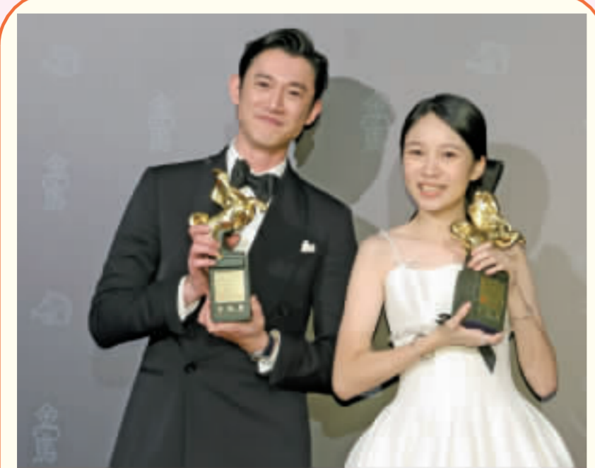
金馬60 新科影帝影后開心留影 第60屆金馬獎揭曉各大獎項得主，被稱為「死亡之組」的最佳男主角最後由演員吳慷仁（左）脫穎而出，最佳女主角則由年僅12歲的林品彤（右）寫紀錄。 （中央社）

第60屆金馬獎頒獎典禮，台灣大哥大旗下 MyVideo 為官方指定直播平台，直播收視人數較去年成長 12%，再創新高，且直播當上與回顧專區總收視人次突破 492 萬。 此外，台灣大另一部投資電影「疫起」拿下金馬獎「最佳視覺效果」、「最佳美術設計」。 台灣大總經理林之晨表示，台灣大從 2015 年至今投資超過 40 部本土戲劇及電影，過去 5 年台灣大拋磚引玉，率先投入獎典禮每一橋段結束，即時上線。 傳精彩影片提供免費收看，累積觀看人次最高紀錄為「最佳男主角」吳慷仁的感言，第 2 名青霞獲「終身成就獎」，第 3 名最佳女主角林品彤的致詞片。 （中央社）