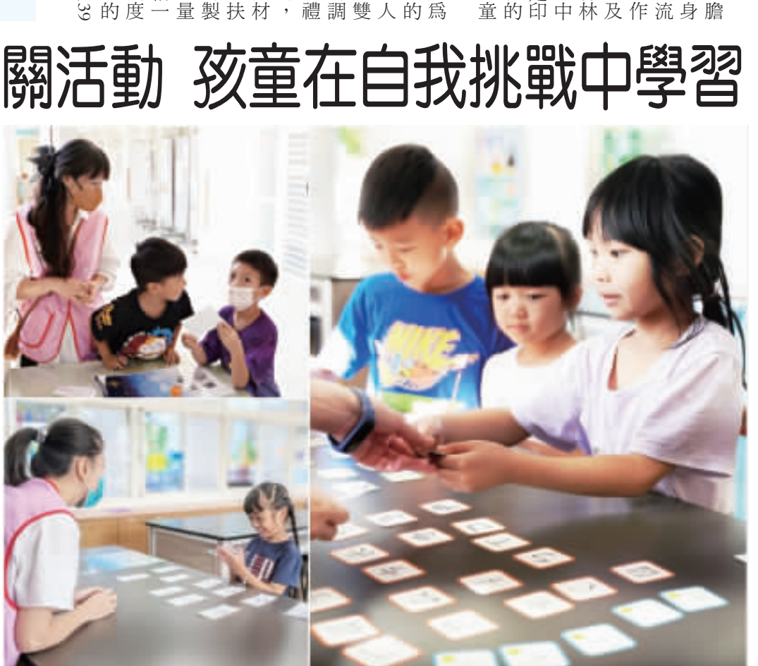
西口國小一年級學生進行注音符號闖關活動。

記者高凡洋／烈嶼報導 烈嶼鄉西口國小一年級學生運用十週時間，投入注音符號的學習，這段旅程在獨特而有趣的注音符號動能評量中迎來挑戰，學校老師設計闖關關卡，檢視孩子們在注音符號學習上的成果。 西口國小提到，許多家長志願踴躍擔任關卡，陪伴學生度過每一個關卡，共同感受孩子們在注音符號學習中的進步，見證孩子們的成長。關卡在老師的精心設計下，內容多元有趣。例如：「注音符號敲敲樂」，敲擊關卡聽出的注音符號，考驗學生對注音符號的聽辨能力與