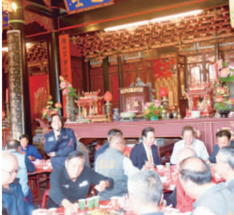
金門縣陳氏宗親會舉行「冬季祭祖大典」，縣長陳福海到場參與祭祖，展現緬懷祖德、崇祖敬宗的傳統美德。他也感謝宗親的支持與奉成。此外，尋求連任的立委陳玉珍也出席聯誼餐會爭取宗親的支持。

福海也到場參與祭祖，彰顯緬懷祖德、飲水思源以及崇祖敬宗的傳統美德。此外，尋求連任的立委陳玉珍也出席聯誼餐會爭取宗親的支持。金門縣陳氏宗親會昨(十三日)舉行冬季祭祖大典，由陳氏宗親會各股宗親代表、長老、宗親會理事等，遵循典禮儀式，虔誠的向祖先祭拜，縣長陳福海也到場參與祭祖，展現緬懷祖德、崇祖敬宗的傳統美德。他也感謝宗親的支持與奉成。此外，尋求連任的立委陳玉珍也出席聯誼餐會爭取宗親的支持。