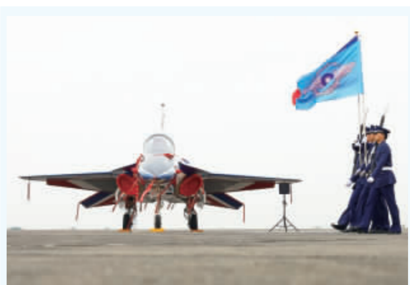
飛訓部編成 地面部隊校閱 駐地高雄同山的空軍飛行訓練指揮部1日編成，現場安排「勇鷹號」新式高教機、AT-3型機與T-34C型機供媒體拍攝。