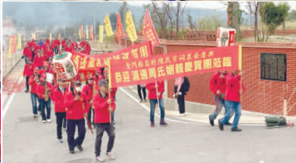
后坵陳氏宗祠奠安慶典昨舉辦，縣長陳福海（上左）、議長洪允典（上右）、立委陳玉珍（下左）等各界陸續前往祝賀；下右、姻親浦邊周氏也前往祭祀及祝賀。（陳麗好攝）

記者陳麗好／金沙報導 農曆十月二十七（日）日舉辦奠安慶典，縣長陳福海、議長洪允典、立委陳玉珍等各界陸續前往祝賀；姻親浦邊周氏也前往依禮祭祀及祝賀。后坵鄉親及在外兒女各地返鄉參與；高齡104歲的阿嬤滿心歡喜見到家廟落成奠安，甚至落番第三代族裔巧巧返鄉尋根，躬逢家廟奠安，感佩萬分。