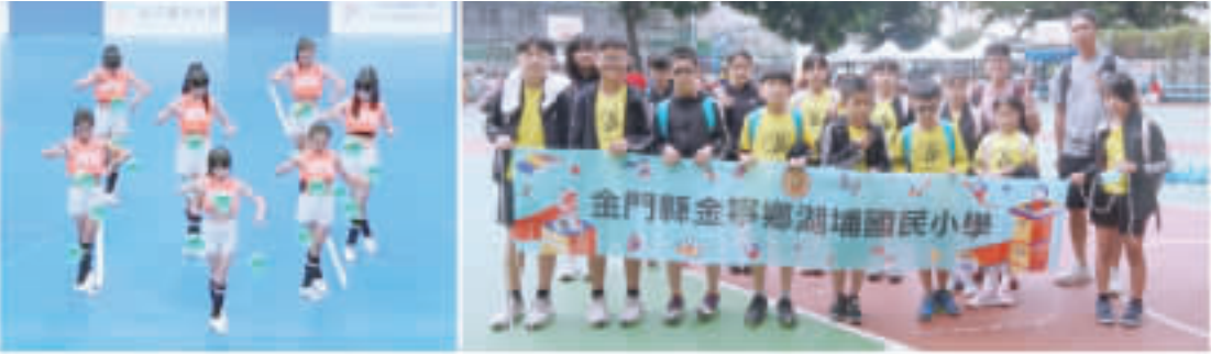
上左、上右、寧中小參與民俗體育競賽扯鈴及跳繩項目，獲一座菁英獎及兩座金質獎肯定。 下左、金鼎國小扯鈴獲特優數量，創歷年成績新高。 下右、湖埔國小獲獎豐富，盼未來能有專長老師加入校內的跳繩運動。

記者高凡洋／綜合報導 教育部體育署主辦「112學年度全國各級學校民俗體育競賽」，於11月25日起在吳鳳科技大學及台南大學熱烈展開，代表金門縣出賽的金寧學區金寧國小、金鼎國小及湖埔國小，於12月1日至3日在台南大學參加扯鈴及跳繩項目，參賽學生個個都卯足全力，精湛的表現及優異的成績成為全場焦點，打響了「金門」的知名度，賽後選手之間互相交流，英雄惜英雄的情誼相當可貴。