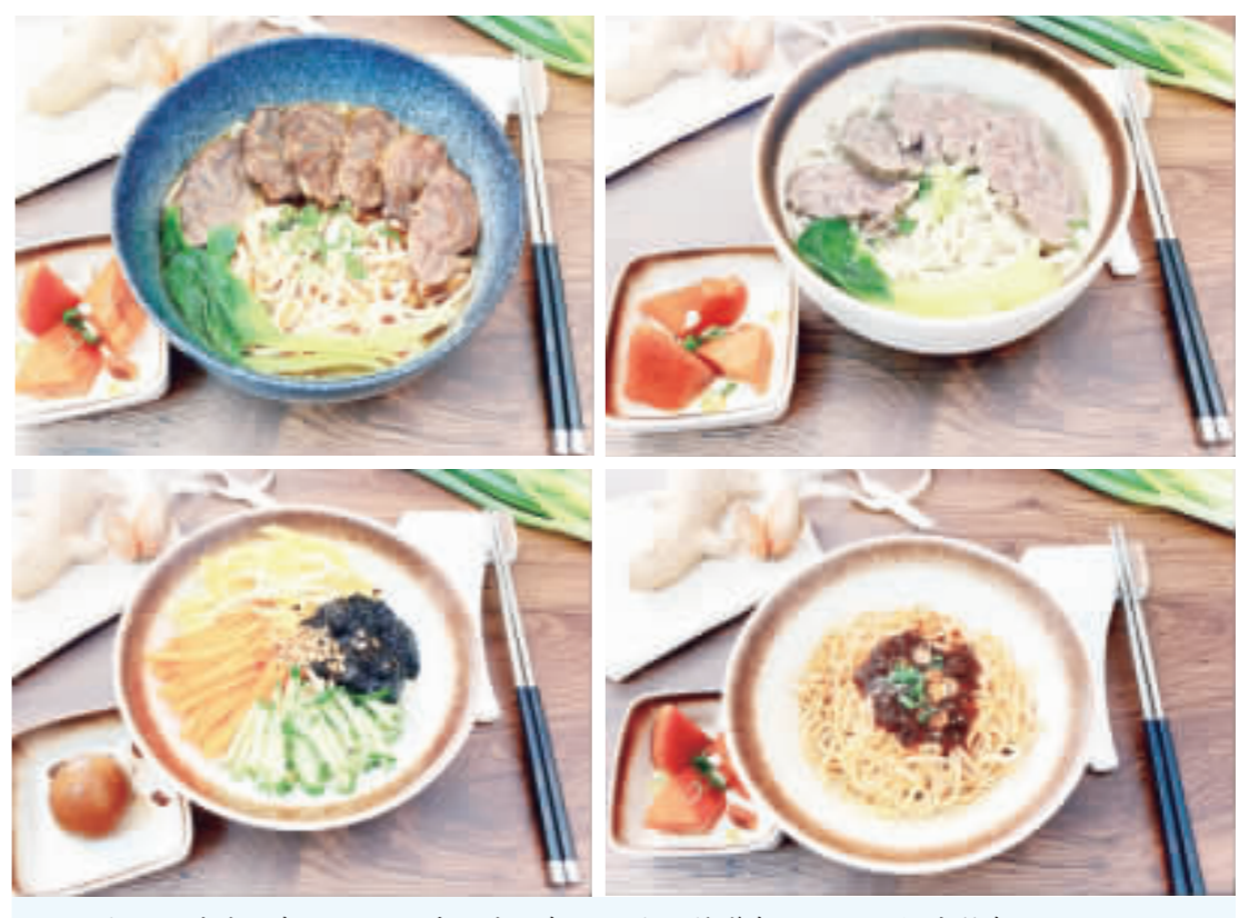
上左、紅燒牛肉麵；上右、清燉牛肉麵；下左、炸醬麵；下右、椒麻拌麵。