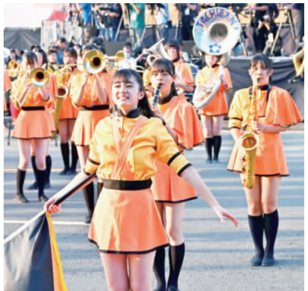
京都橘高校吹奏樂部高雄演出 日本京都橘高校吹奏樂部再度訪台演出，10日下午在高雄時代大道帶來精彩表演，展現青春熱情，團員動作整齊劃一、活力十足，成功博得滿堂彩。

正義，政府責任在哪裡？」為主題，自台北市中華路勞動部直聘中心出發，沿漢口街、館前路，經台北車站西門轉承德路，接著朝市民大道轉中山北路、南京東路後到松山勞動部。 遊行隊伍高喊「政府承擔、仲介滾蛋」口號，並敲打大鼓、自製樂器提振士氣，許多移工在遊行的路途中合唱歌曲，沿途吸引許多民眾圍觀。 聯盟指出，根據統計，今年在移工高達75萬人，本地仲介公司超過上千家，其中很多甚至到移工母國跨國營運，母國仲介費、國內仲介費、兩筆費用同時收。 聯盟強調，只要政府繼續選擇不擔起移工就業服務責任，私人仲介就能永遠壟斷移工就業市場；當移工的就業機會這條命脈被仲介緊緊把住，仲介對移工的掌控就永遠牢固。 勞動部發布新聞稿回應，現行引進移工管道多元，雇主可自備需求選擇，包括自行引進、透過直聘中心專案自國外引進或委託仲介公司辦理引進移工，引進方式仍宜回歸市場機制。 勞動部指出，鼓勵雇主直聘、減少移工經濟負擔為勞動部既定政策，並自97年起成立直聘中心，提供雇主直聘移工申辦受理及雙語諮詢通譯等服務，為強化國對國直聘機制，近年已與來源國達成協議辦理專案選工，協助雇主自國外引進製造移工，未來將持續透過雙邊會議協助選工工作範圍。 另外，為避免仲介介紹費用問題，將加強仲介公司管理與查察，同時透過跨部會合作協力，提供移工雙語化申請表及通譯服務，完善移工在台工作及生活服務，回應外界期待。 勞動部表示，樂見社會各界表達多元意見，均將納入評估，並採穩健務實態度，審慎規劃並積極推動辦理。