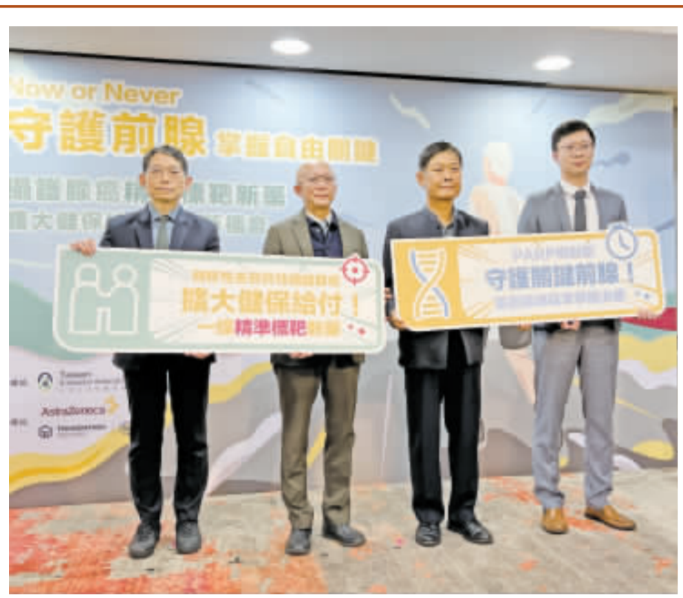
醫籲50歲以上男性定期篩檢防攝護腺癌 攝護腺癌為台灣男性常見的泌尿道癌症，醫師在衛教記者會中提醒，50歲以上的男性應定期進行攝護腺癌特異性抗原（PSA）篩檢，家族有癌症病史者更要格外注意。 (中央社)

國健署提醒民眾調節身體保暖溫度，尤其在起床、出門及進門時的3個關鍵時機，避免過差造成心血管問題。 各地氣溫明顯轉涼，衛生福利部國民健康署長吳昭軍近日透過新聞稿建議，民眾注意頸部與四肢的保暖，留意家中長輩有無穿戴帽子、圍巾、圍巾、手套及襪子等，早上出門的民眾則以洋蔥式多層次穿著，方便隨著溫度變化穿脫衣物，避免過差增加心血管負擔。 國健署提醒心臟保暖抗溫差，應該掌握3個關鍵時機。第1個時機是起床的時候，建議晚上睡覺前應先準備好保暖衣物，放在伸手可拿到的地方，半夜或早上起床到廁所時，記得先動一動四肢及身體，緩緩坐起，穿好保暖衣物，再慢慢下床、腳步踩穩地板再行走，千萬不可過於急促。 第2個時機為出門的時候，國健署表示，民眾應適時添加衣物，尤其注意頸部及四肢末端的保暖，可以戴上帽子、圍巾、圍巾、手套及保暖衣物。最外層可選擇具有防水與防風功能外套，以容易穿脫與合適肢體活動衣物為主，避免穿得過於笨重厚實，才是維持恆定體溫的好方法。 第3個時機則是進門的時候，國健署提到，從寒冷戶外走進溫暖室內，千萬不要立刻洗澡，應該讓身體逐漸回暖，尤其血管彈性不佳或有心血管疾病者，注意保暖不可少，不要馬上進入環境較低溫空間，但仍建議維持室內空氣流通，避免緊閉門窗。 國健署強調，氣溫驟降與濕冷時，血管內平滑肌會跟著收縮，容易造成血壓升高，可能增加心臟病及急性中風發作的機會，尤其是三高患者、心血管病患者及高齡長者等族群，務必維持規律運動、均衡飲食、定期量測血壓、定期回診，做好三高的管理與控制，避免使用菸酒。 (中央社)