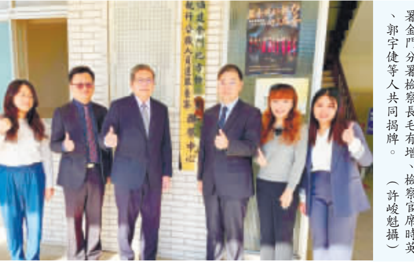
執行公職人員選舉查察中心昨日(由左至右依序)檢察官陳俊君、主任檢察官施家榮、檢察長周士楡、福建高等檢察署金門分署檢察長毛有增、檢察官席時英、郭宇健等人共同揭牌。

檢察長周士楡表示，距離選舉的時間已經相當接近，目前也正式進入最後的查賄、反賄的階段。除了積極查察賄選之外，對於接獲的線索，也會秉公辦理，而對於提供線索的民眾資訊，也絕對是做到滴水不漏的保密。 周士楡表示，檢察官在執行職務時，必須秉持公正、客觀、嚴謹的態度。對於任何可能影響選舉公正性的行為，都將依法嚴辦。他呼籲選民踴躍提供線索，共同維護選舉的公平與正義。