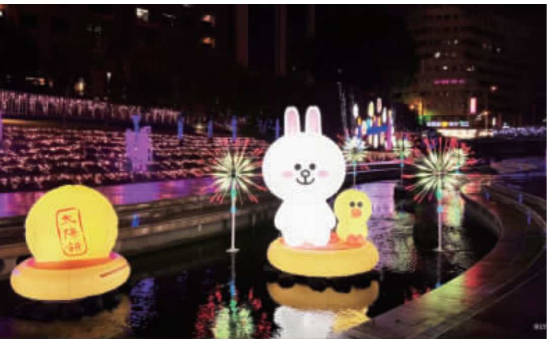
台中耶誕嘉年華將於15日登場，首度攜手人氣明星LINE FRIENDS，搭配台中名產太陽餅。

【中央社記者郝雪卿台中11日電】台中耶誕嘉年華將於15日登場，台中市新聞局今天表示，首度攜手LINE FRIENDS打造主題燈飾，活動燈區除了往年的舊台中火車站前廣場、柳川及綠川外，還延伸到中山路。 台中耶誕嘉年華將於15日登場，今年主題「2023台中好甜，LINE FRIENDS好友來聚」，首度與LINE FRIENDS攜手，搭配16公尺高粉紅耶誕樹，打造主題燈飾。 台中市新聞局表示，今年首度攜手人氣明星LINE FRIENDS，在舊台中火車站前廣場設立16公尺高粉紅耶誕樹，搭配手拿台中名產太陽餅與冰淇淋的熊大兔兔，以及360度轉動的耶誕樹，打造「甜蜜音樂盒」。 新聞局指出，今年活動燈區除了往年舊台中火車站前廣場、柳川和綠川外，還延伸到中山路，範圍更大、內容更加豐富，讓民眾進入光影交織的夢幻境界中，加上LINE FRIENDS明星熊大兔兔，與現場燈光、音樂、柳川河水呈現可愛又浪漫的歌舞表演，珠寶盒劇場表演時間為12月15日至明年1月1日，每天下午5時30分至9時30分，每半小時一場。