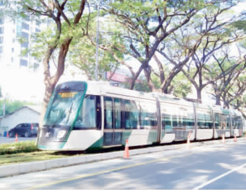
高雄環狀輕軌將完成最後一哩路的大順路工程，預計2024年元旦全線通車，達成「輕軌成圓」目標。

【中央社記者蔡孟好高雄16日電】高雄環狀輕軌將完成最後一哩路的大順路工程，預計明年元旦全線通車。環狀輕軌全線共38站，可與捷運紅、橘、黃線及台鐵等8站互轉乘，成為串連高雄大眾運輸路網重要一環。 高雄輕軌為圓形環狀線，分兩階段興建，第一階段從C1離仔內站到C14哈瑪星站，第二階段C15壽山公園站到C7輕軌機廠站，全線38站。輕軌也分多次逐站通車，最後的大順路工程完工後，輕軌正式成圓，全線明年元旦通車。 回顧輕軌施工過程，輕軌第一階段新增「岡山車站」一，預計明年6月通車，全線預計預計118年通車。 「4線齊發」完工後，高雄捷運路網將從現有的紅、橘線38站及輕軌38站，增加至全線42站，總長度112公里，將大幅提升高雄大眾運輸路網覆蓋率，吸引大眾運輸人口成長。