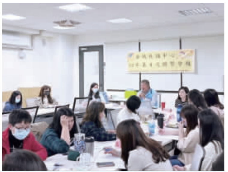
社會處召開金城社會福利服務中心暨網絡單位聯繫會報。

彼此合作與討論，除了每一組都輕鬆過關；強化了彼此間的溝通，也增進親子良好互動及情感，現場充滿歡笑聲。家長覺得木育館及活動很棒，孩童則欲罷不能，期待能再次參與。