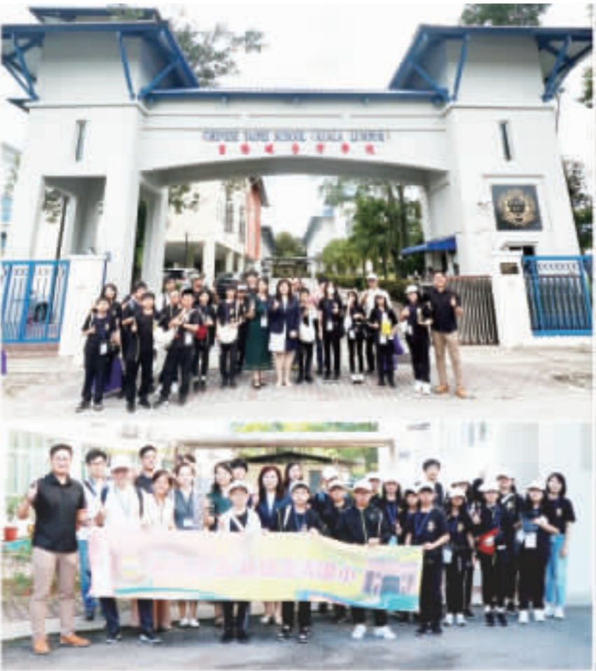
上、下：正義國小赴馬來西亞、三度會見姊妹校吉隆坡壹校。