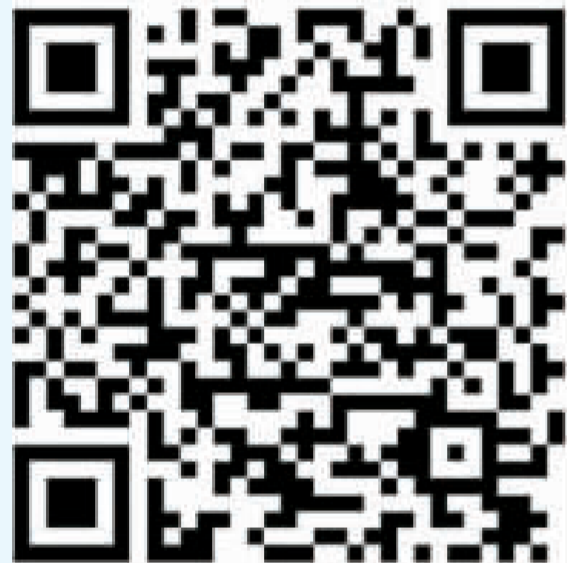
掃描可以進入冬至資訊網站

【節慶篇】 （整理撰稿：僑訊小組） 冬至或冬至節在新加坡是一個根深蒂固的中國文化傳統，也是一個重要的國際節日。儘管這個慶祝活動在華人社區中普遍，但不同背景的人也會參與其中。雖然冬至不是公共假日，但在新加坡的日曆上卻是一個重要的文化節日。 冬至在華人農曆新年之前六週舉行，標誌著新一年中最短的一天。在新加坡，這一天比最長的一天短約八分鐘，因為新加坡位於赤道上的緯度。 傳統上，人們會與家人在這一天的聚會，雖然有些家庭可能會到市中心參觀公共擺設或參加特別活動，但節日的核心仍然是在家中。冬至的傳統主菜是「湯圓」，這是一種粉糯豆湯，其中包裹著煮熟、甜味十足的糯米糰。有些糯米糰呈白色，而有些則是粉紅色，象徵著好運。 儘管新加坡沒有明顯的「一冬」或氣候變化，但冬至的傳統仍然存在。年復一年，人們能夠在這種找到各種不同的慶祝方式和表達形式。 舊時新加坡的過節方式 有些新加坡華人也會在冬至這天到廟裡祭拜祖先，在祖先牌位前擺放祭品，以表孝心。祭品包括不同顏色、動物形狀的饅頭等祭品，代表家中六畜興旺。過去在新加坡吃的節日小吃之一是一種叫「Koyoc」的糯米糰，有時會用糖蜜蘸著吃。它們經過沸水煮熟，類似於沒有餡料的湯圓。 現今的過節方式 時至今日，具有象徵意義的湯圓已成為新加坡冬至慶祝活動一道食物。每逢冬至，新加坡的華人家庭通常都會團聚在一起，共進晚餐，結束後每人也會來一碗熱騰騰的湯圓。有些家庭也會在這一天的祭祖和祭神，準備的供品包括各種顏色的湯圓。 新加坡華族文化中心為了讓更多新加坡華族認識冬至，特地製作線上有趣網站，讓新加坡與世界各地的華族朋友一起來認識中國傳統節日「冬至」！ 短網址： https://reurl.cc/outD7V