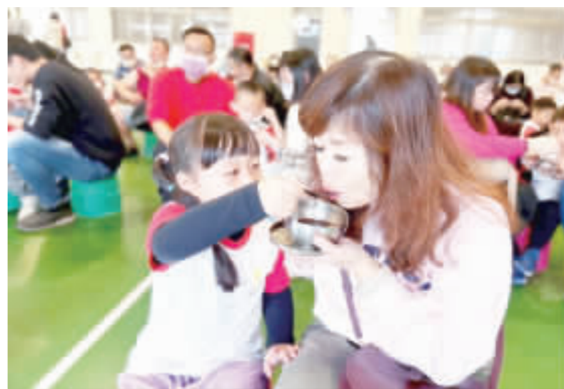
上、中：親子們一同進行各項闖關卡，增進親子間的情感，下：金鼎國小附設幼兒園舉辦冬至至親子活動，全園三百多位親師生共同參與。