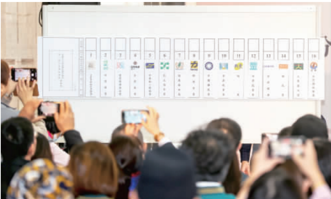
中選會20日舉行第11屆全國不分區及僑居國外國民立法委員選舉政黨號次抽籤，民進黨抽到6號、時代力量8號、國民黨9號、台灣民眾黨12號。

【中央社記者賴于榛台北20日電】中選會今天舉行第11屆全國不分區及僑居國外國民立法委員選舉政黨號次抽籤，民進黨抽到6號、時代力量8號、國民黨9號、台灣民眾黨12號。 中選會今天舉行第11屆全國不分區及僑居國外國民立法委員選舉政黨號次抽籤，民進黨抽到6號、時代力量8號、國民黨9號、台灣民眾黨12號。中選會今天舉行第11屆全國不分區及僑居國外國民立法委員選舉政黨號次抽籤，民進黨抽到6號、時代力量8號、國民黨9號、台灣民眾黨12號。