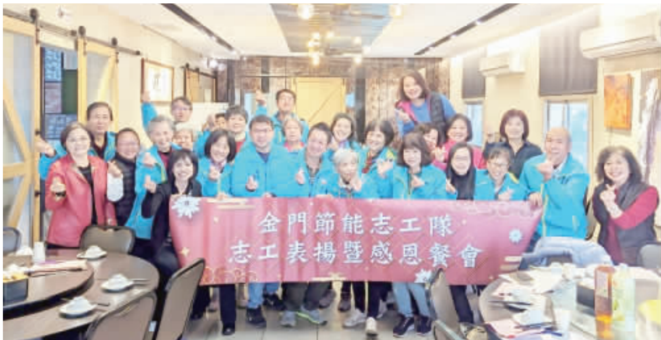
金門縣政府舉辦112年度志工表揚暨感恩餐會活動，表揚績優志工和肯定服務精神。

記者楊水冰／縣府報導 金門節能志工隊在今年節 累積參與一百五十七次的節 能宣導活動，累積服務時數 超過達八百四十八小時，共服 務超過一萬三千人次。值此歲 末年終之際，金門縣政府舉辦 一、二年度志工表揚暨感恩餐