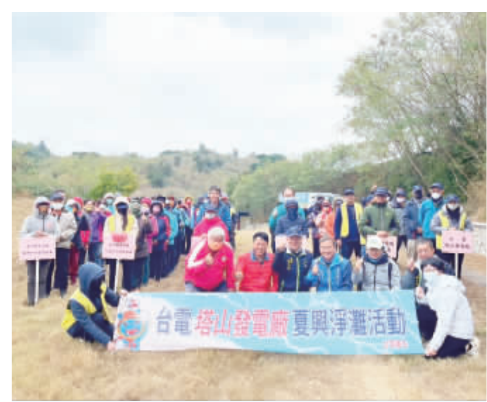
塔山電廠在夏興排水溝出口舉辦淨灘活動。

明。例如施行細則方面修正各機關辦理公 開甄選之候補期間最長為5個月；各機關 檢視現行陞遷序列表，如有未合規定，應 儘速辦理修正並報備查。 另外，縣府112年10月31日府人一字第 二200933號函重申公務服務法不得經營 商業及兼職相關規範，請轉知所屬遵守。 「金門縣政府及所屬機關(構)學校約用 人員管理要點」部分規定於112年1月10日 修正。「約用人員聘用契約書(範本)」於 112年12月11日修正。「金門縣政府及所 屬機關(構)學校聘僱人員薪級及考核管 理要點」部分規定於112年4月19日及12月 11日修正，並請各人事人員多宣講所屬同 仁，勿把志願卡當福利，忘則卡卡數過多 ，應將名單給主管參考。