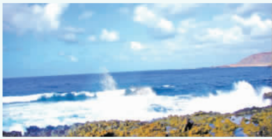
拍岸的浪喋喋不休說著季節的故事……。

如此赤裸裸飛奔而來的多情，這麼急促地喋喋不休說著季節的故事……拍岸成洶湧滾滾的梵音與鼻息只為泊靠，千年的岑寂