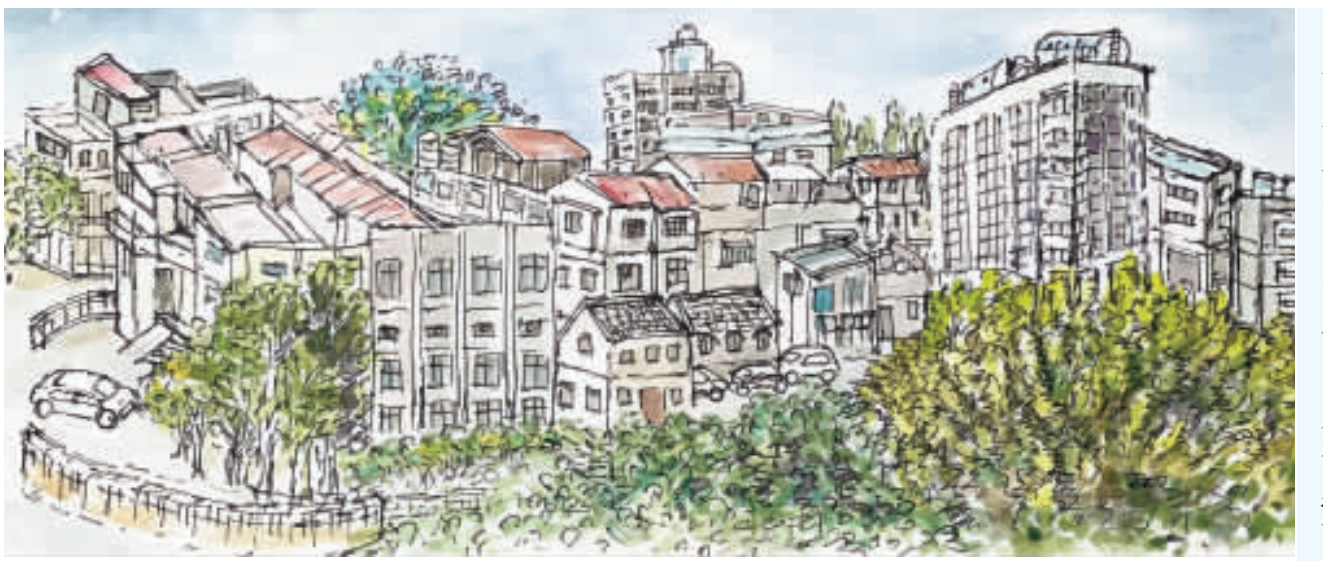
▲左、右：黃彩戀淡彩畫作。