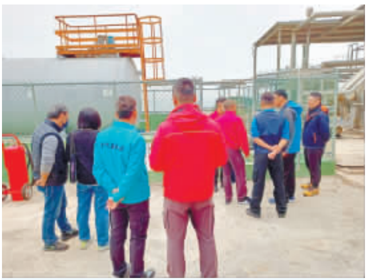
聯合檢查小組至金門酒廠金城廠檢查。

記者高凡洋／綜合報導 有鑑於近年公共危險物品工廠火警案件頻傳，日前亦有屏東縣明揚大火火警，為維護公眾安全，加強業者自我檢視工作並落實公共危險物品管理，金門縣消防局辦理「112年度加強公共危險物品場所消防安全聯合檢查」。 消防局指出，為有效列管及掌控本縣公共危險物品工廠，防止發生公共安全事故，維護民眾生命財產安全，由消防局召集社會處、建設處、環保局針對縣內達管制度30倍以上之公共危險物品工廠執行聯合檢查工作，計有6家場所包括：金門酒廠金城廠、金門酒廠金寧廠、金門電力公司塔山電廠、夏興電廠、麒麟電廠及皇家酒廠，為主要檢查對象。 消防局表示，各單位依據實地公共危險物品場所位置、構造及設備、勞工工作環境安全、建築物結構安全、商業登記規範及是否造成環境污染等進行檢查，對於不符合法令規定之缺失，督促及輔導業者限期改善，降低危害事故發生機會。並且透過召集各單位聯合檢查，強化各權責機關間溝通之協調機制，共同輔導業者就缺失部分進行改善，及強化業者危害評估管理與應變作為，進而達成預防危害發生、降低人員傷亡及財物損失、確保社會大眾生命財產安全之宗旨。