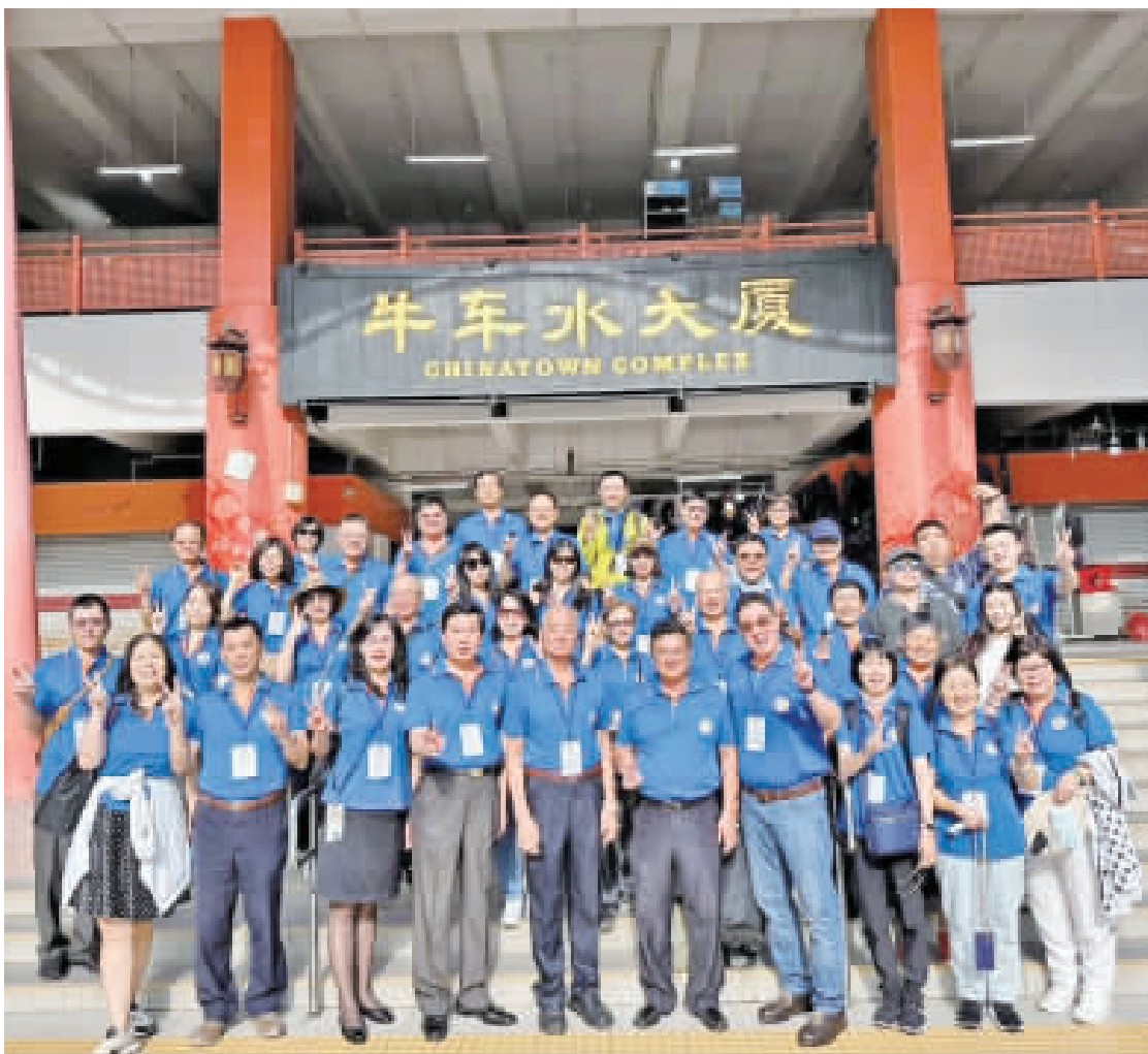
參訪團於牛車水大廈合照。

（台北訊） ◎整理撰稿：邱聖瑄 台灣金門同鄉總會於本月19日率領由42名成員組成的代表團，前往馬來西亞和新加坡展開為期數天的海外交流之旅。這次代表團結合了旅台金門同鄉會與宗親會的成員，其中包括近12個同鄉會及宗親會的組織成員。首站來到新加坡後，金門同鄉總會參訪團已完成了對當地金門同鄉會館的參觀。在這次交流活動中，兩地同鄉會的成員們進行了熱烈的交流與互動，分享了各自的經驗和見解。前往新加坡保存良好的華族文化地標。牛車水、海牙寺以及歷史悠久的街道，成為了代表團的旅程目的地。成員們得以深刻感受先賢們當年在南洋大地上所歷經的艱辛與奮鬥歷史。