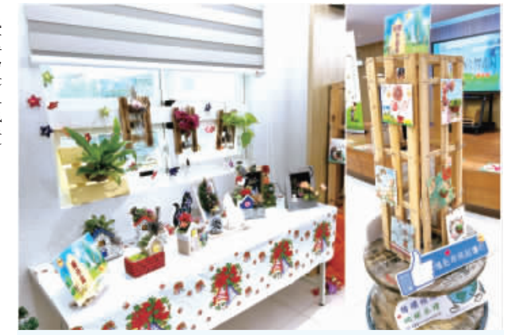
台電金門區處舉辦「朽木的傳奇」成果發表會，分享同仁讓朽木變成藝術品的成果。

記者許加泰／金門報導 廢棄材料不是只能等著被銷毀，用點創意和巧手，就能賦予它們嶄新面貌。日前舉辦「朽木的傳奇」成果發表會，展示以蝶谷巴特特繪木料的過程。把原本粗糙的廢棄的包裝用木條箱、木棧板等，裁切組合，穿上美麗優雅的圖案，重新發揮藝術及生活可用性的價值。會中特捐贈50組木棧板裝藝術成品給家扶中心，協助其募款做公益。