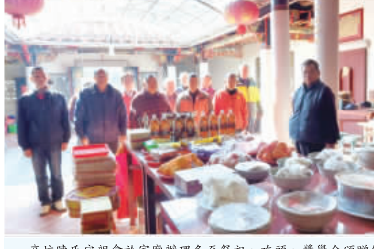
高坑陳氏宗親會於家廟辦理冬至祭祖、吃頭、獎學金頒贈儀式。

高坑冬至祭祖活動於上午11時熱鬧展開，首先獻拜文昌帝君及福德正神，再祭祀祖德流芳大祖。清酒、五牲、三牲、12菜碗、果品、糕點一應俱全，獻禮叩禮儀，鳴炮以求國泰民安，風調雨順，五穀豐收、子孫昌盛。「凝聚宗親親緣誼誼」，晚間並舉辦吃頭活動，宗親「論輩不論歲」的禮俗在吃頭聚餐間相見歡歡更顯重要，一般不敬可要「巴頭」的，近年民情開放，已於冬至日開放女輩參與吃頭，同享祖宗恩澤慶典喜悅。宗親高堂博士將軍喜慶晉匾高掛，皆是後生效法榜樣，特別辦理獎學金頒贈，以鼓勵後進子弟，效法先賢進士，金榜題名，弘揚祖德，今年獲得獎學金成績優秀子弟有高坑、新