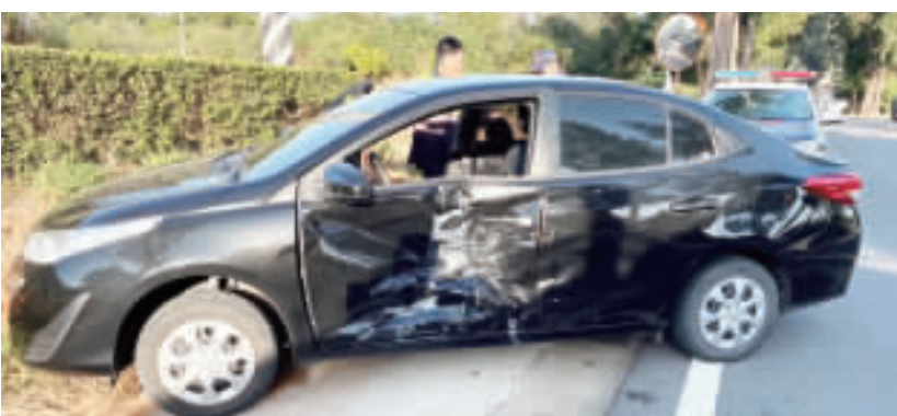
左、右：環島北路二段發生交通事故，雙方車輛嚴重毀損。