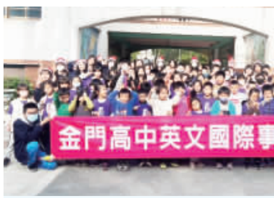
金門高中英文國際事務社前進國小校園，舉辦聖誕巡迴活動。(金門高中提供)

記者許峻魁／綜合報導 金中國際社走出教室前進國小，以活潑輕鬆的活動，增進國小學童對學習英文的喜愛，也藉由認識異國節慶內容，擴增文化涵養。英語國際事務社的「12年度國小聖誕節巡迴活動」共計舉辦兩場。第一場來到古寧國小，由於校舍施作中，改在戶外進行活動，但仍不減金中學子的熱情。