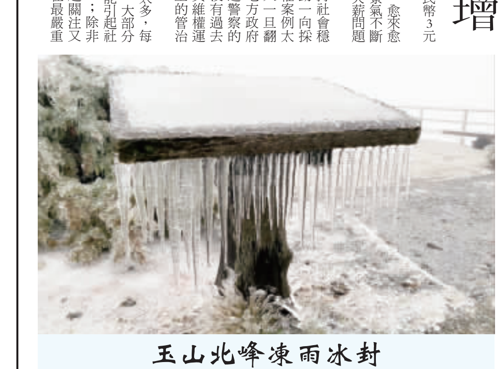
大陸冷氣團影響，玉山氣象站（北峰）24日清晨最低溫為攝氏零下2度，冰封山頭。（圖、氣象署提供/文、中央社）