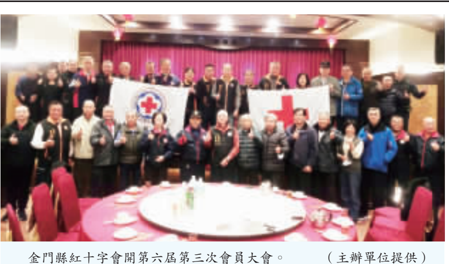
金門縣紅十字會開第六屆第三次會員大會。

金門高中英文國際事務社表示，該活動藉由聖誕節主題單字、遊戲、短劇表演及帶動跳，加上歌舞同樂，全場歡樂無比，也提前共度耶誕佳節，第二場安瀾國小同樣受到小朋友的熱情回饋。