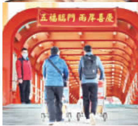
上、下：小三通今年初重啟，本次陸方政策放寬，可望帶動新一波金門高粱酒的營銷量。

記者陳冠霖／綜合報導 中國大陸廈門海關於12月22日公告，自25日起，放寬廈門—金門與泉州—金門小三通航線旅客攜帶的台灣高粱酒數量限制，由原先的4瓶或總量不超過3公升，放寬至6瓶或總量不超過4.5公升。 對此，縣府觀光處表示，金門高粱酒名聞遐邇，飄香兩岸，是金門重要的經濟命脈，也是金門財政收入與社會福利的主要來源，面對廣大的中國大陸市場，推動金門高粱酒營銷大陸是縣府努力的施政重點。 縣長陳福海自去年12月25日上任以來，成功恢復兩岸小三通客運航線營運，並積極推動金門與大陸各項民間交流與民生議題，為了提升金門高粱酒的營銷量，縣府團隊多次透過組團