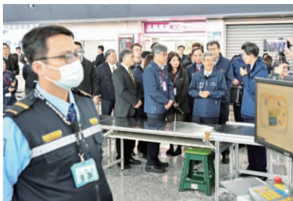
行政院長陳建仁25日上午前往桃園國際機場視察非洲豬瘟邊境檢疫情形，他強調，非洲豬瘟的防疫工作，是台灣防疫工作的重中之重，他此行是視察桃園機場的防疫工作，並瞭解非洲豬瘟的防疫工作。

行政院長陳建仁25日上午前往桃園國際機場視察非洲豬瘟邊境檢疫情形，他強調，非洲豬瘟的防疫工作，是台灣防疫工作的重中之重，他此行是視察桃園機場的防疫工作，並瞭解非洲豬瘟的防疫工作，他此行是視察桃園機場的防疫工作，並瞭解非洲豬瘟的防疫工作。 陳建仁視察桃園機場第一航廈非洲豬瘟邊境檢疫作業，先是聽取業務單位的簡報並致贈加菜金，隨後前往視察X光機掃描檢查行李流程，並瞭解發燒篩檢站近期的檢查狀況，同時叮嚀作業人員，面對即將來臨的農曆春節要提前做好萬全的準備，後續則轉往視察華僑作業情形。 陳建仁致詞表示，每次遇到節日，就會找到較多進口肉類，特別是春節即將