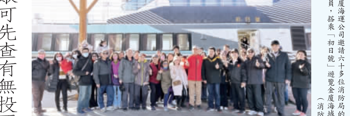
金廈海運公司邀請六十多位消防局的職消及義消人員，搭乘「初日號」遊覽金廈海域。

記者高凡洋／綜合報導 為了表達對金門義消今年度赴台參加12年全國義消人員體技交流活動，獲得有史以來最佳成績，團體成員犧牲奉獻及樹立的功績，團體成員犧牲奉獻及樹立的功績，團體成員犧牲奉獻及樹立的功績。